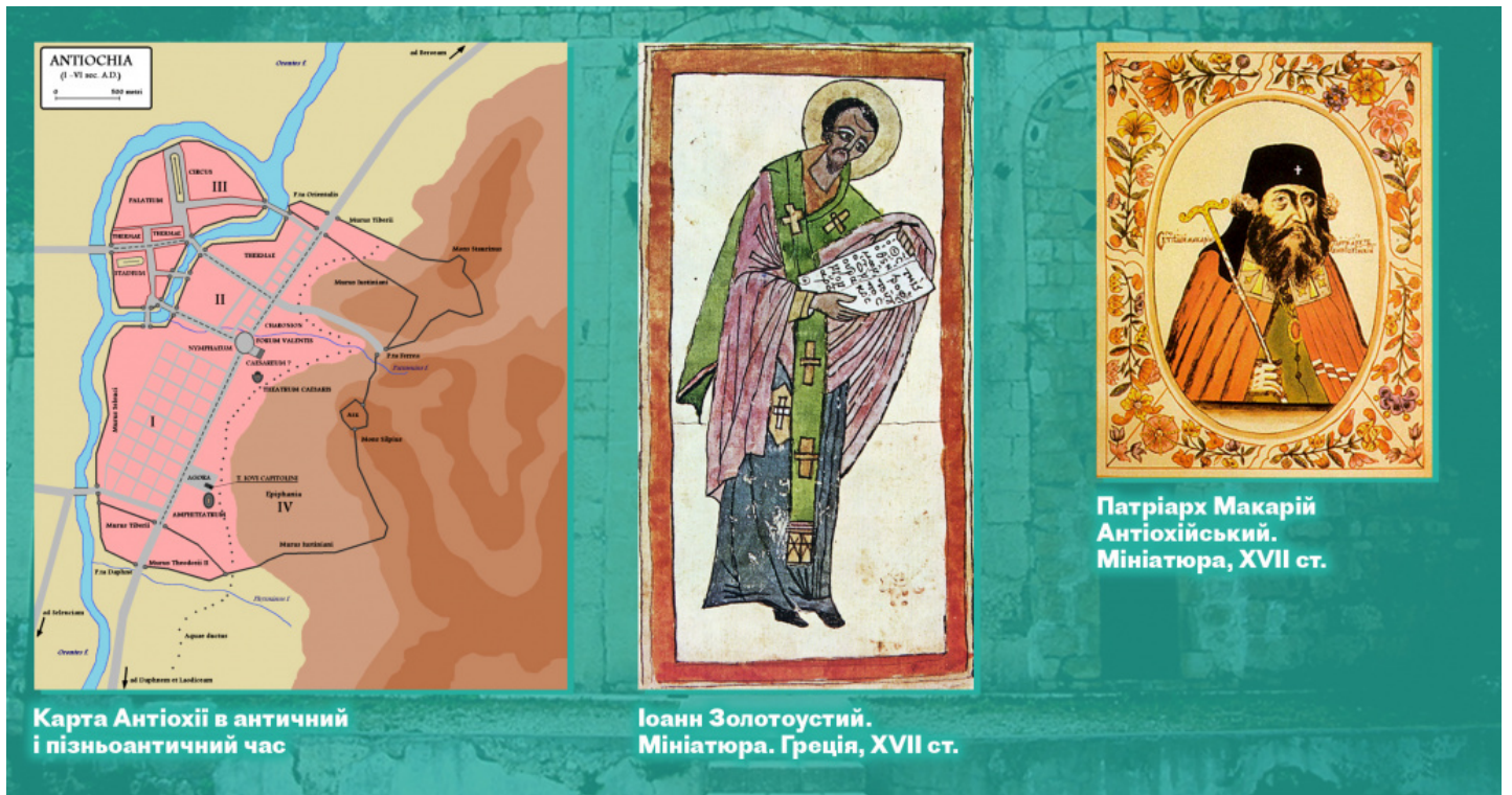
Карта Антіохії в античний і пізньоантичний час