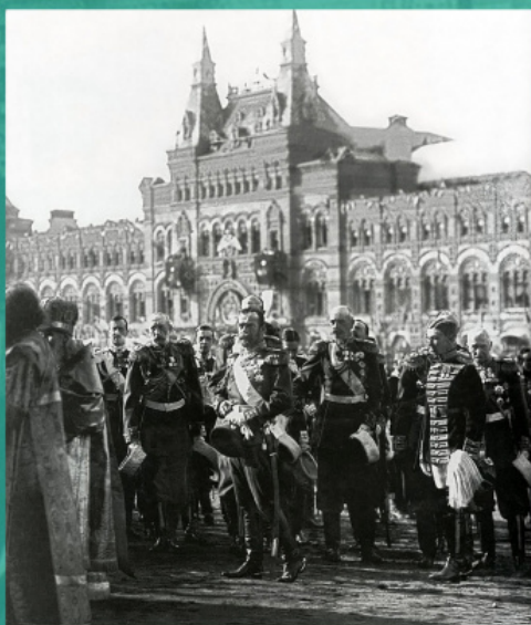
300-річчя дому Романових. Миколай II бере участь в урочистому молебні на Красній площі

В результаті був відправлений до Петербурга ящик з дарами російському імператору (52 предмета античного скла; кіпрська фігурка з розфарбованого фаянсу; 3 предмета з єгипетського фаянсу, глиняні лампи). Більшість з них і понині зберігаються в Державному Ермітажі. В решті решт ідею створення музею антіохійських старовин було відкинуто, щоби unikнути конфліктів з турецьким урядом, який суворо забороняв вивіз археологічних пам'ятників.