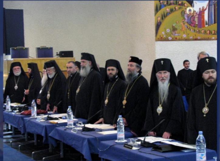
Митрополит Іларіон (крайній праворуч) на IV всеправославній передсоборній нараді. Шамбезі, Швейцарія, 6-13 червня 2009 р.

Звичайно, Руська Православна Церква з таким підходом погодитися не могла.