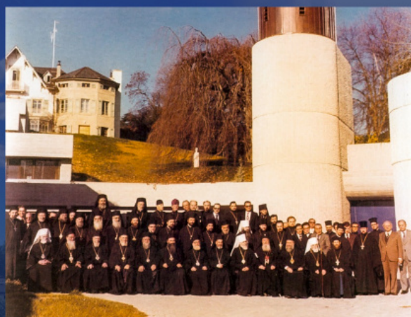
Перша Всеправославна передсоборна нарада. Шамбезі, Швейцарія, 1976 р.

- «Канонічне надання автокефалії неможливе без попереднього підтвердження всеправославного консенсусу».