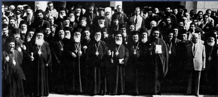
Перша Всеправославна Нарада. Острів Родос, 24-30 вересня 1961 р.