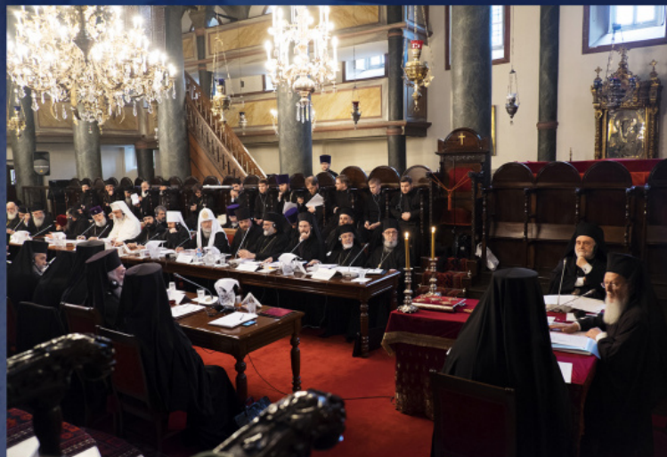
Синакис Предстоятелів і представників Помісних Православних Церков. Стамбул, Туреччина, 6-9 березня 2014 р.

підготовчу комісію (2011). Але у 2011 році консенсусу знову не було встановлено, тому що діючий регламент передбачав прийняття документів тільки у випадку одностайного ухвалення всіма Помісними Церквами.