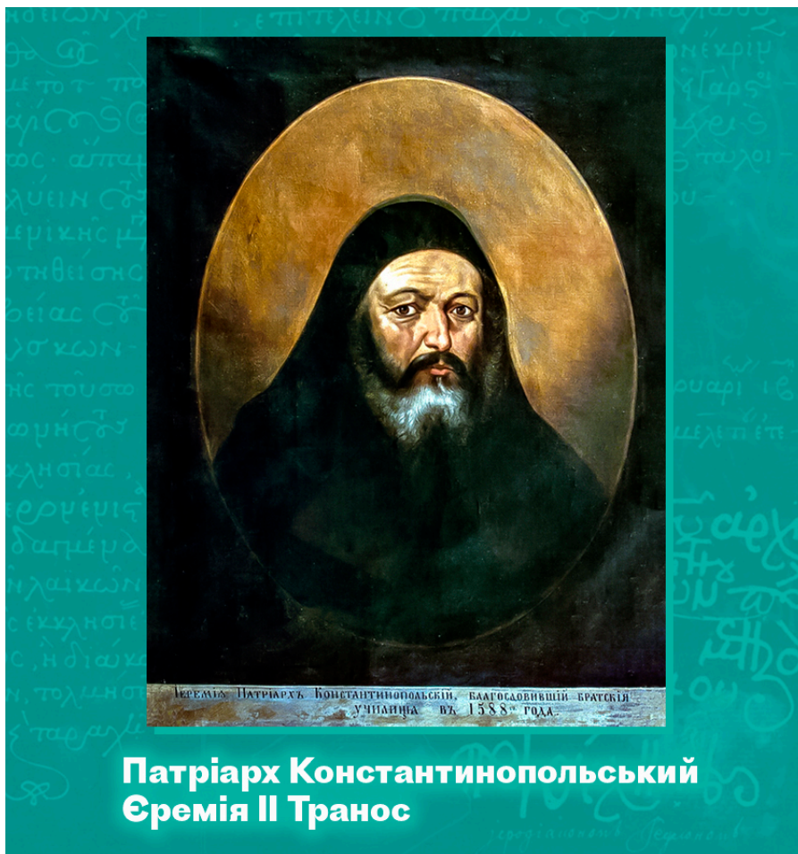
Патріарх Константинопольський Єремія II Транос

В актах і документах Руської держави концепція «Третього Риму» не знайшла відображення. Вочевидь, московські государі ставилися до цієї тези з обережністю. Неправильно витлумачена, ця теза могла бути зрозуміла як претензія на політичну спадщину Візантії - що неминуче вело до загострення відносин з Османською імперією.