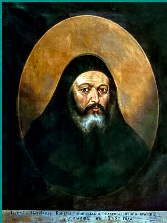
Патріарх Константинопольський Єремія II Транос

В актах і документах Руської держави концепція «Третього Риму» не знайшла відображення. Вочевидь, московські государі ставилися до цієї тези з обережністю. Неправильно витлумачена, ця теза могла бути зрозуміла як претензія на політичну спадщину Візантії - що неминуче вело до загострення відносин з Османською імперією.