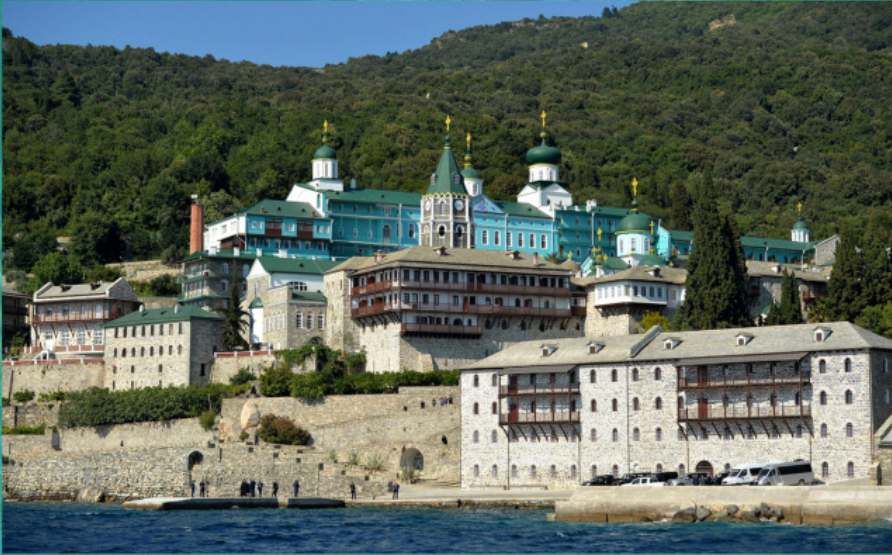
Монастир Святого Пантелеїмона на Афоні