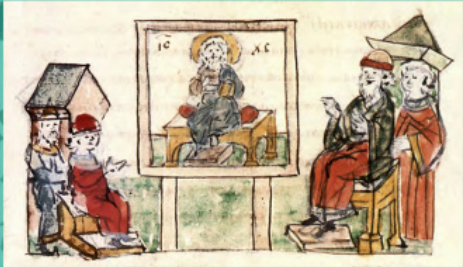
Показ грецьким філософом штори з зображенням Господа Ісуса Христа. Мініатюра з Радзивілівського літопису