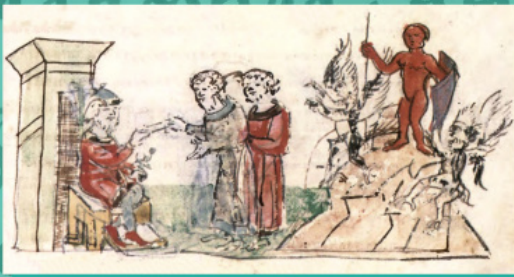
Княження Володимира у Києві; Воздвиження за його велінням на пагорбі дерев'яних зображень Перуну та іншим язицьким божествам. Мініатюра з Радзивілівського о літопису

Після хрещення Володимир, згідно літопису, поставив у Херсоні – Корсуні церкву Іоанна Предтечі на горі, яку було насипано посеред Граду під час облоги із землі, яку мешканці вибирали із руської насипі.