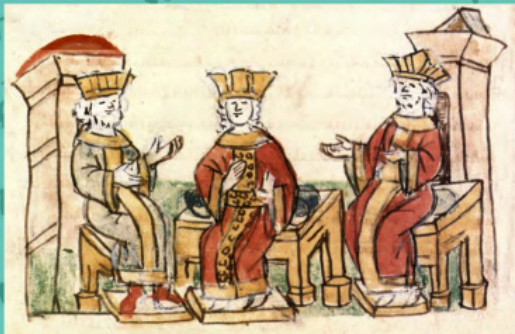
Переконання візантійськими імператорами Василієм II і Костянтином VIII царівни Анни. Мініатюра з Радзивілівського літопису

Анна сіла на корабель і, попрощавшись з близькими, з плачем відправилася морем у супроводі чиновників і пресвітерів.