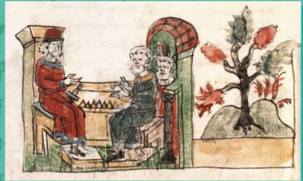
Бесіда Володимира з болгарами - магометанами мініатюра з Радзивілівського летопису

Під 6493 роком від створення світу (985 рік за нашим літосчисленням) літописець повідомив про похід князя Володимира на болгар і підписання з ними миру.