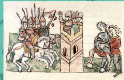
Здача Корсуні війську Володимира. Мініатюра з Радзивілівського літопису

На початку наступного, 6496 року ( з вересня 987 по серпень 988 нашої ери), літопис розповідає про похід князя Володимира на головну візантійську твердиню у Північному Причорномор'ї – славетне місто Херсонес, відоме в середні століття як Херсон, а в руських джерелах – як Корсунь.