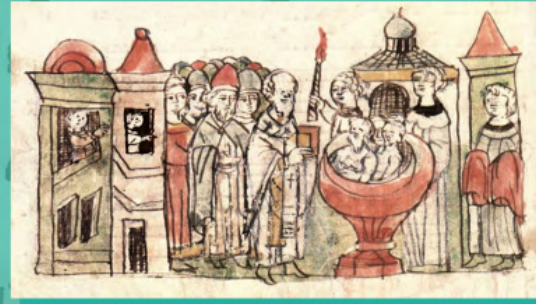
Хрещення дружини Володимира. Мініатюра з Радзивілівського літопису