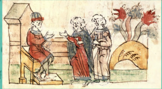
Прийом Володимиром послів, які повернулися від болгарів. Мініатюра з Радзивілівського літопису

Ніби у підтвердження цього судження пролунав « вирок» боярів: « Якби був поганим закон грецький, то не прийняла би його бабка твоя Ольга, а була вона наймудрішою за всіх людей».