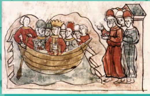
Прибуття царівни Анни до Корсуні і привітання її Володимиром і населенням міста. Мініатюра з Радзивілівського літопису