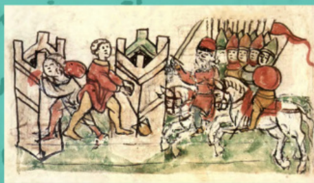
Оточення Корсуні військом Володимира. Мініатюра з Радзивілівського літопису