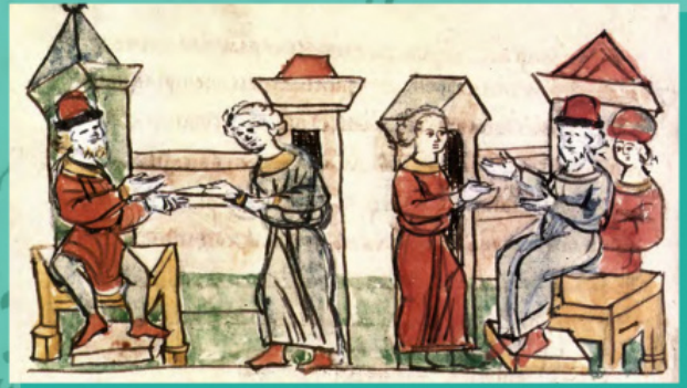
Відправлення Володимиром гінця до візантійських імператорів Василія II і Костянтина VIII з пропозицією віддати йому за дружину їх сестру Анну; передача гінцем згоди візантійських імператорів Василія II і Костянтина VIII щодо шлюбу Анни і Володимира за умовою його хрещення. Мініатюра з Радзивиллівського літопису

Відповіли вони цілком по-візантійськи, заклавши до тактичної уступки стратегічний вигравш :