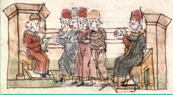
Відправлення Володимиром послів до болгарів. Мініатюра з Радзивілівського літопису