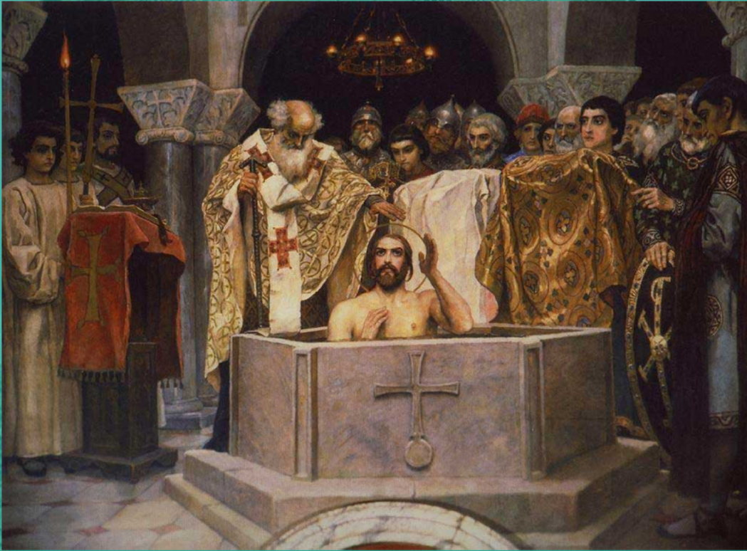
Хрещення князя Володимира. Фреска В. Васнецова. Фрагмент розпису Володимирського собору у Києві, 1885-1893 р.

Про що же благає Бога новохрещений руський князь?