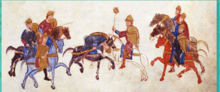
Дуель між Вардою Скліром і Вардою Фокою у 978 / 979 роках. Мініатюра з хроніки Іоанна Скіліці

Надану послідовність подій – війну з Руссю, договір, шлюб і військову допомогу – підтверджує вірменський історик Степанос Тронеці на прізвисько Асохік.