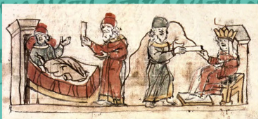
Передача царівною Анною послання з порадою скоріше хреститися, щоби позбутися хвороби очей; отримання Володимиром послання від царівни Анни. Мініатюра з Радзивілівського літопису

Церемонію оглашення і хрещення руського князя, згідно літопису, проводив місцевий архієрей – архієпископ Херсонський – у співслужінні з прибувшим з Константинополю духовенством.