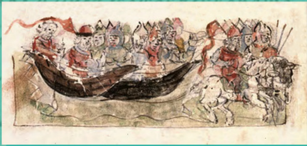
Похід князя Володимира на болгар мініатюра з Радзивілівського летопису