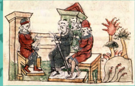
Рада Володимира з боярами і городянами. Мініатюра з Радзивілівського літопису

Далі літопис оповідає про так зване випробування вір. Це оповідання також, у легендарній формі має багато історичних вірних деталей.