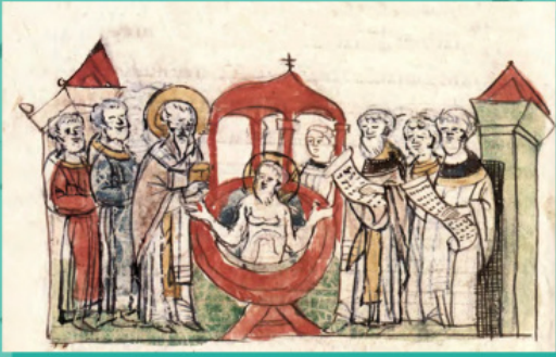
Хрещення Володимира. Мініатюра з Радзивілівського літопису