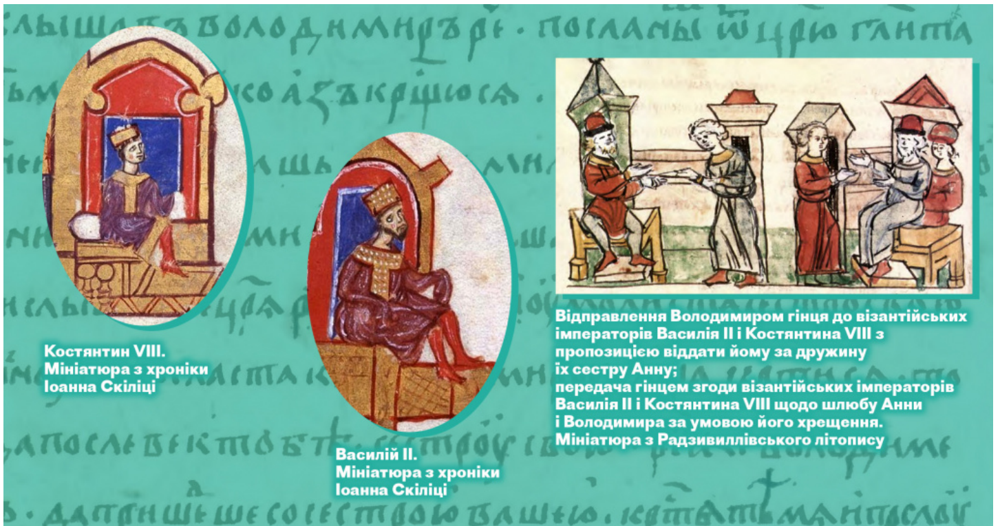
Костянтин VIII. Мініатюра з хроніки Іоанна Скіліці