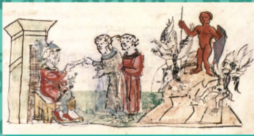
Княження Володимира у Києві; Воздвиження за його велінням на пагорбі дерев'яних зображень Перуну та іншим язицьким божествам. Мініатюра з Радзивілівського о літопису

Після хрещення Володимир, згідно літопису, поставив у Херсоні – Корсуні церкву Іоанна Предтечі на горі, яку було насипано посеред Граду під час облоги із землі, яку мешканці вибирали із руської насипі.