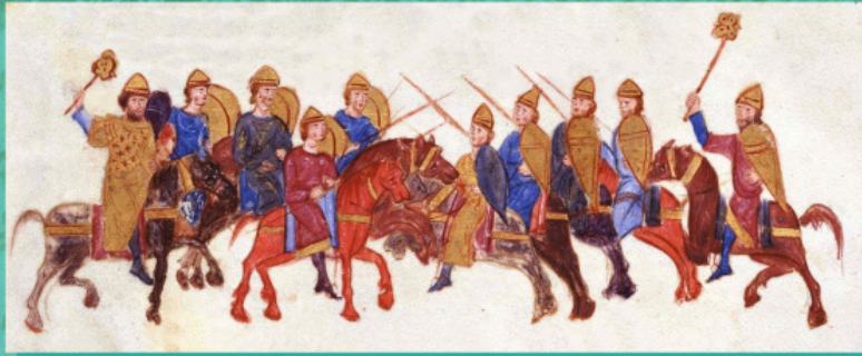
Битва Варди Скліра і Варди Фоки у 978/ 979 роках. Мініатюра з хроніки Іоанна Скіліці