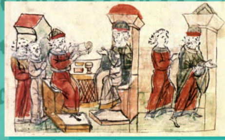
Піднесення дарів грецькому філософу; Відхід грецького філософа з Києва. Мініатюра з Радзивілівського літопису