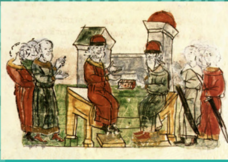
Бесіда Володимира з грецьким філософом. Мініатюра з Радзивілівського літопису