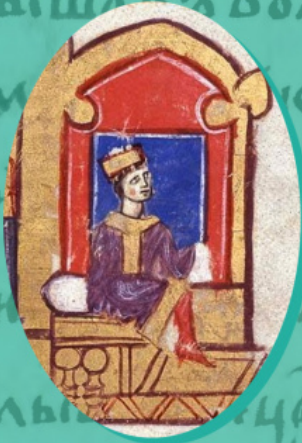
Костянтин VIII. Мініатюра з хроніки Іоанна Скіліці