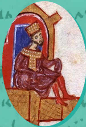
Василій II. Мініатюра з хроніки Іоанна Скіліці