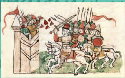
Облога Корсуні військом Володимира. Мініатюра з Радзивілівського літопису