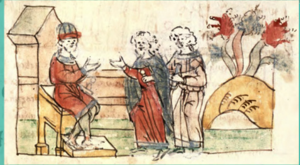
Приєм Володимиром послів, які повернулися від болгарів. Мініатюра з Радзивілівського літопису

Ніби у підтвердження цього судження пролунав « вирок» боярів: « Якби був поганим закон грецький, то не прийняла би його бабка твоя Ольга, а була вона наймудрішою за всіх людей".