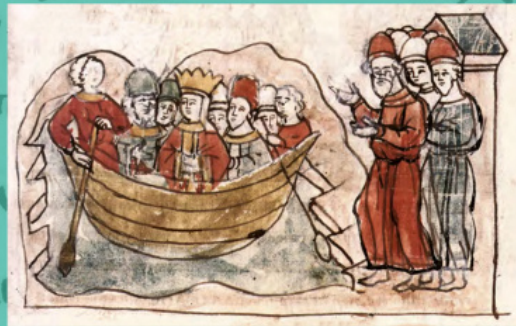
Прибуття царівни Анни до Корсуні і привітання її Володимиром і населенням міста. Мініатюра з Радзивілівського літопису