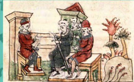
Рада Володимира з боярами і городянами. Мініатюра з Радзивілівського літопису

Далі літопис оповідає про так зване випробування вір. Це оповідання також, у легендарній формі має багато історичних вірних деталей.