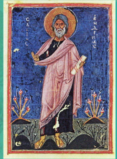
Свети апостол Андреј Првозвани. Минијатура из књиге, Византија, XII век