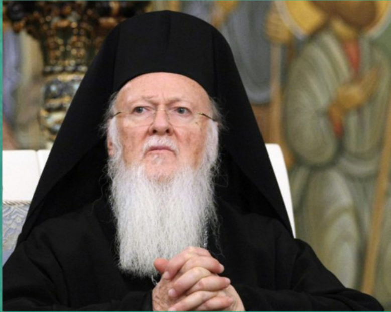
Патријарх Вартоломеј I