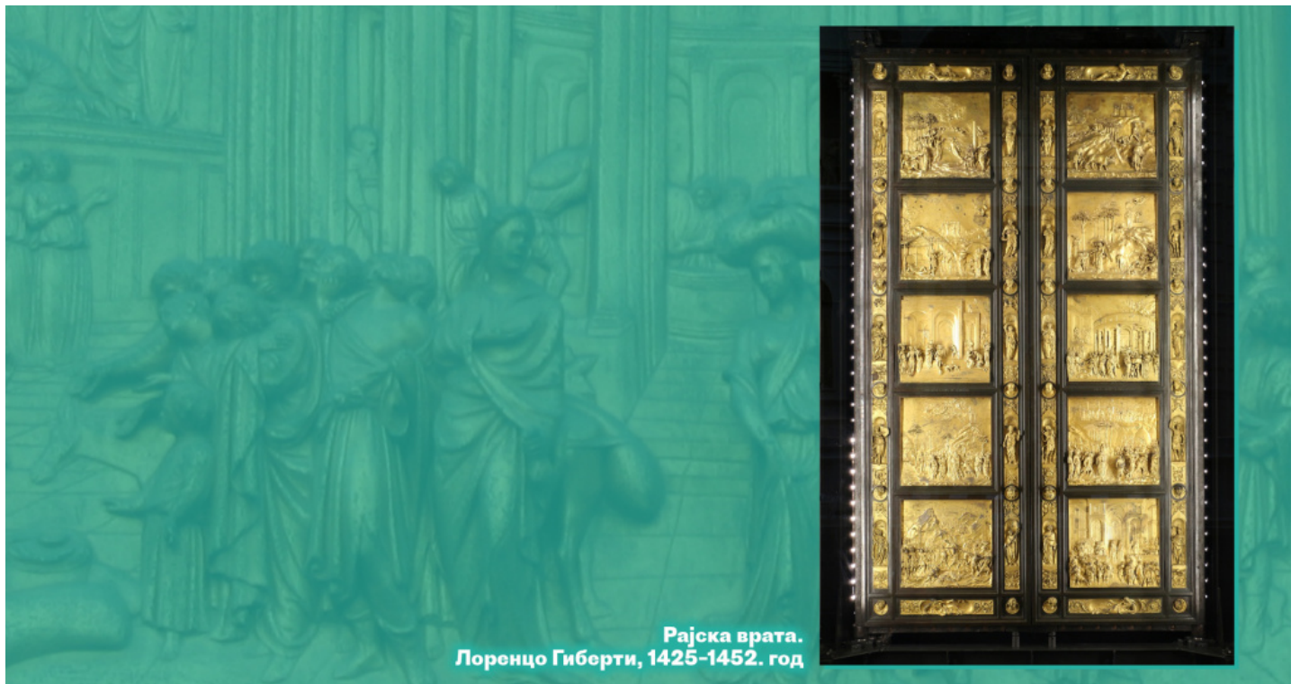
Рајска врата. Лоренцо Гиберти, 1425-1452. год

Ко се потчињава телесним слабостима временом бива отуђен од ма каквих врлина, јер су оне дате онима који се истински подвизавају. Онај који сумња у васкрсење [свеопште] није способен да прими небеске дарове, нема ничег у себи осим туге и бескрајног мрака.