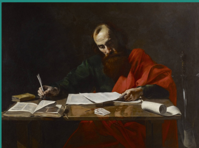
Свети Павле пише посланице. Валентин де Булоњ, 1618-1620. године

Склоните са лица вео таме који вас спречава да видите слаткоћу [живота са Христом]. Имајте љубави према ближњем и спознајте заслуге ове врлине. Послушајте апостола Павла који каже да сте „ви црква Бога живог“ (2 Кор. 6, 16). Чувајте то у срцима вашим и не осуђујте ближњег, не растужујте га, да не наљутите Бога који живи у њему. Јер је свака част коју неко указује брату својој иста она част коју доноси пред Христа, слава Му!