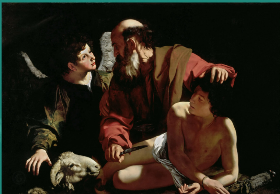
Жртвовање Исака. Микеланђело Мерици да Каравађо, 1598. год

Ми не поседујемо тако савршену и потпуну љубав према Богу, какву су имали наши свети оци. Оне који искрено воле Бога чистом љубављу, без лажи или лицемерја, ништа не одваја од љубави Божије – ни деца, ни жена, ни брат, ни породица, ни злато, ни власт. Као Аврам који искрено воли Бога, али који није поштедео свог сина Исака, када му је Он заповедио да га жртвује, него Га је послушао и учинио заповеђено. И као свети мученици који су више волели љубав према Богу од пролазног живота и стрпљиво подносили страдања, проливајући сопствену крв. Због љубави коју су гајили према Богу испунили су речи апостола Павла: „Ко ће нас раставити од љубави Христове? Жалост или тескоба, или гоњење, или глад, или голотиња, или опасност, или мач?... Јер сам уверен да ни смрт, ни живот, ни анђели, ни поглаварства, ни силе, ни садашњост, ни будућност, ни висина, ни дубина, нити икаква друга твар неће моћи одвојити нас од љубави Божије, која је у Христу Исусу, Господу нашем“. (Рим. 8, 35, 38–39).