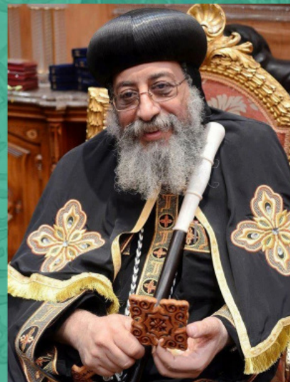
Патријарх коптски Тавадрос II

Објављено дело представља краће излагање темеља благочестивог живота хришћанина; поражава једноставним, а истовремено дубоким мислима; садржи увек актуелне духовне савете и несумњиво је интересно широким кругом читалаца.