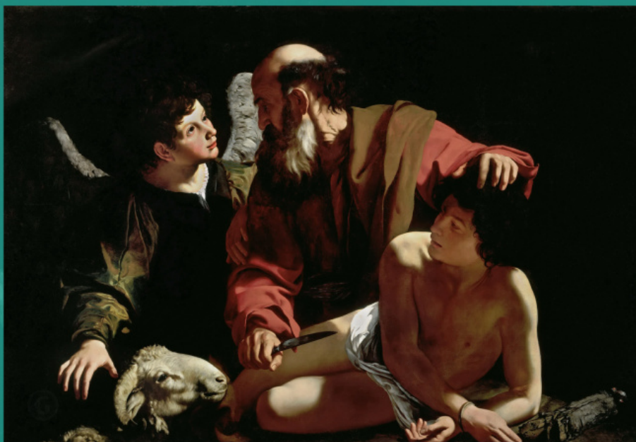
Жртвовање Исака. Микеланђело Мериџи да Каравађо, 1598. год

Ми не поседујемо тако савршену и потпуну љубав према Богу, какву су имали наши свети оци. Оне који искрено воле Бога чистом љубављу, без лажи или лицемерја, ништа не одваја од љубави Божије – ни деца, ни жена, ни брат, ни породица, ни злато, ни власт. Као Аврам који искрено воли Бога, али који није поштедео свог сина Исака, када му је Он заповедио да га жртвује, него Га је послушао и учинио заповеђено. И као свети мученици који су више волели љубав према Богу од пролазног живота и стрпљиво подносили страдања, проливајући сопствену крв. Због љубави коју су гајили према Богу испунили су речи апостола Павла: „Ко ће нас раставити од љубави Христове? Жалост или тескоба, или гоњење, или глад, или голотиња, или опасност, или мач?... Јер сам уверен да ни смрт, ни живот, ни анђели, ни поглаварства, ни силе, ни садашњост, ни будућност, ни висина, ни дубина, нити икаква друга твар неће моћи одвојити нас од љубави Божије, која је у Христу Исусу, Господу нашем“. (Рим. 8, 35, 38–39).