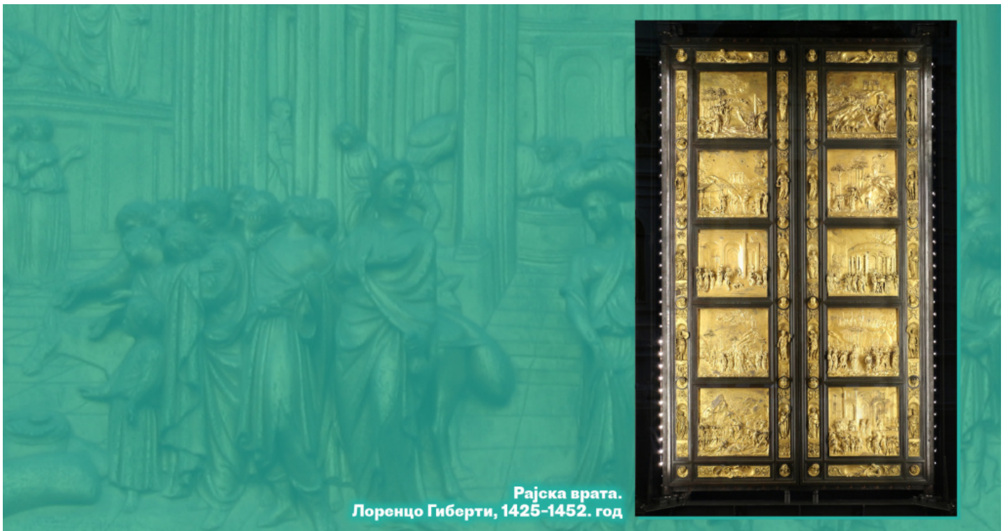
Рајска врата. Лоренцо Гиберти, 1425-1452. год

Ко се потчињава телесним слабостима временом бива отуђен од ма каквих врлина, јер су оне дате онима који се истински подвизавају. Онај који сумња у васкрсење [свеопште] није способен да прими небеске дарове, нема ничег у себи осим туге и бескрајног мрака.