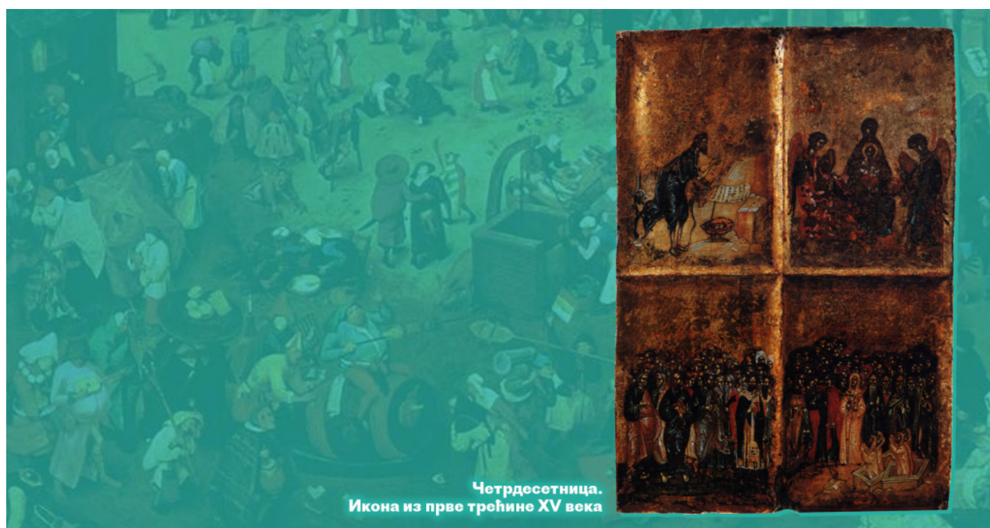
Четрдесетница. Икона из прве трећине XV века

Знајте да Света Четрдесетница представља целогодишњи квасац, зато морамо пажљиво постити. Јер ако квасац изгуби своју моћ, цело тесто ће се покварити.