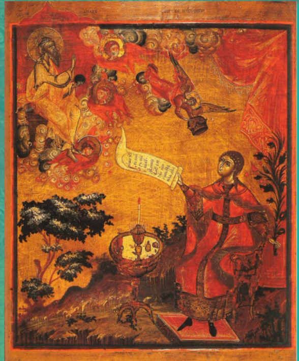
Икона «Царство Небеско». Прва половина XIX века

Пред Спаситељем нашим увек будите у молитви и плачу да би свако био достојан да чује глас „праштају ти се греси твоји“ (Мк. 2, 5). Спаситељ наш Благи и Човекољубиви радује се вашем покајању и моли Свога Небеског Оца за вас. Али не искушавајте доброту Његовог срца падајући у сагрешења, јер ће тада молитва бити бескорисна.