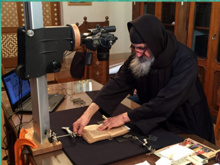
Монах манастира преподобног Макарија Великог дигитализује рукописе

Уз благослов коптског Патријарха Тавадроса II, у оквиру активности Комисије за дијалог између Руске Православне Цркве и Коптске Цркве, нађени споменик је преведен на руски језик и садржи накнадне књижевне напомене. Ово је прво издање датог дела. Делегација игумана и становника манастира Коптске Цркве током ходочасничке посете Русији од 23. августа до 1. септембра 2021. године испоручила јој је примерке оригиналног и тренутно ограниченог издања књиге.