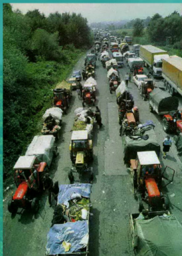
Колона српских избеглица 1995. год.

Положај српског становништва у Хрватској је постепено почео да се побољшава тек почетком XXI века. Велику улогу у том процесу игра Српска Православна Црква. Влада Хрватске и СПЦ 2002. године потписују споразум према коме су православни свештеници добили право да предају религиозне дисциплине у школи. Постепено се враћа свештенство, обнављају се порушене цркве. Према последњим подацима са пописа, на територији Хрватске је остало 186,633 Срба. Када је Хрватска ступила у Европску Унију 1. јула 2013. године, добила је низ обавеза које се односе на заштиту права националних мањина. Упркос свему, и даље се настављају напади на свештенике и објекте Српске Православне Цркве.