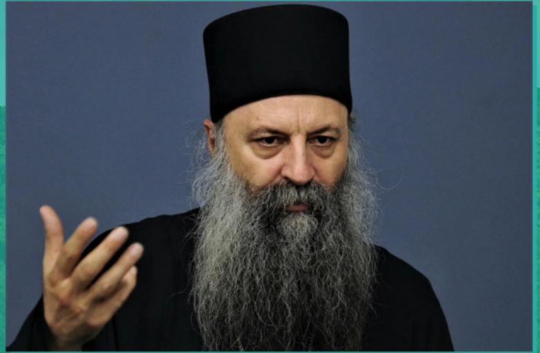
Патријарх српски Порфирије

Архијерејски Сабор Српске Православне Цркве 2014. године изабрао је викарног епископа Епархије бачке Порфирија за митрополита загребачко-љубљанског. Патријарх српски Иринеј обавио је устоличење митрополита у присуству многих архијереја СПЦ-а 13. јуна 2014. године у сабору Преображења Господњег у Загребу. Митрополит Порфирије се прославио на тој функцији захваљујући својој друштвеној и мировној делатности усмереној на јачање Православља у области. За време његовог столовања завршена је обнова манастира Лепавина, најстаријег духовног центра православних Срба у Хрватској.