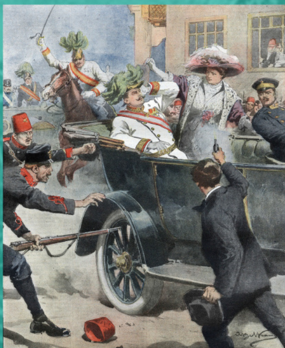
Убиство надвојводе Франца Фердинанда и његове жене. Илустрација Ахила Белтрама, 1914. год.

Односи између Срба и Хрвата су остали крајње напети и током Краљевине Срба, Хрвата и Словенаца, а затим у Југославији (од 1929. године), јер је нова држава била унитарна, што није одговарало хрватском становништву. Такође, активну улогу у међунационалном непријатељству играо је Ватикан, који је спроводио тзв. „Католичку акцију“, чији је циљ био увлачење омладине у различите верске организације („Орлови“, „Крстоноше“), као и наставак политике