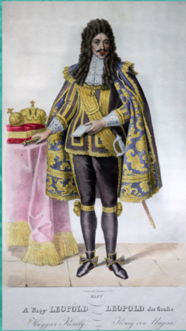
Леополд I. Жозеф Крихубер, 1828. год.