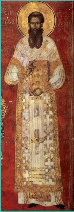
Сава српски. Фрагмент фреске. Црква Св. Димитрија. Србија, XIII век