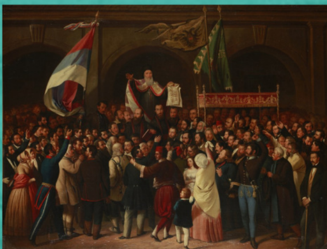
Проглашење Српске Војводине 1848. године. Павле Симић, 1848-1849. год.

Према попису становништва из 1910. године, на територији Хрватске било је око 650 хиљада православних Срба, а на територији Далмације живело је око 105 хиљада. Након атентата Србина Гаврила Принципа на престолонаследника Франца Фердинанда 1914. године у Сарајеву по читавом царству покренут је талас демонстрација и антисрпских прогона праћених скрнављењем цркава и гробља. Током Првог светског рата Аустроугарска је наставила да води репресивну политику против Срба – оснивани су концентрациони логори. Након пораза Беча и победе српске војске, 1. децембра 1918. године проглашено је стварање Краљевине Срба, Хрвата и Словенаца. У Сремским Карловцима, духовном центру православних Срба у време Аустроугарске, 2. септембра 1920. године свечано је проглашено уједињење Српске Православне Цркве и обнова Патријаршије.