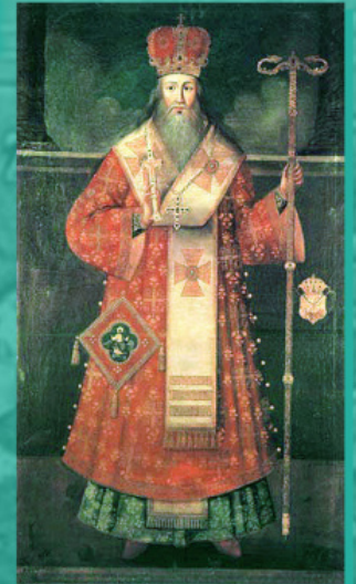
Арсеније III Чарнојевић