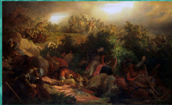
Мохачка битка. Сликар Берталан Шекели