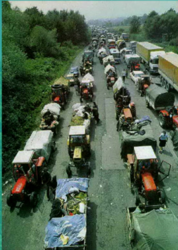
Колона српских избеглица 1995. год.

Положај српског становништва у Хрватској је постепено почео да се побољшава тек почетком XXI века. Велику улогу у том процесу игра Српска Православна Црква. Влада Хрватске и СПЦ 2002. године потписују споразум према коме су православни свештеници добили право да предају религиозне дисциплине у школи. Постепено се враћа свештенство, обнављају се порушене цркве. Према последњим подацима са пописа, на територији Хрватске је остало 186,633 Срба. Када је Хрватска ступила у Европску Унију 1. јула 2013. године, добила је низ обавеза које се односе на заштиту права националних мањина. Упркос свему, и даље се настављају напади на свештенике и објекте Српске Православне Цркве.