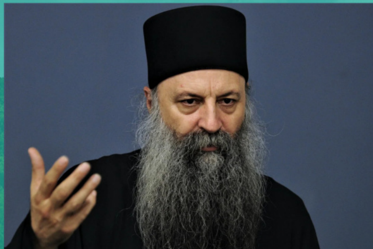
Патријарх српски Порфирије

Архијерејски Сабор Српске Православне Цркве 2014. године изабрао је викарног епископа Епархије бачке Порфирија за митрополита загребачко-љубљанског. Патријарх српски Иринеј обавио је устоличење митрополита у присуству многих архијереја СПЦ-а 13. јуна 2014. године у сабору Преображења Господњег у Загребу. Митрополит Порфирије се прославио на тој функцији захваљујући својој друштвеној и мировној делатности усмереној на јачање Православља у области. За време његовог столовања завршена је обнова манастира Лепавина, најстаријег духовног центра православних Срба у Хрватској.