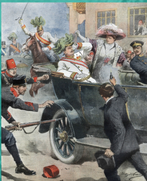
Убиство надвојводе Франца Фердинанда и његове жене. Илустрација Ахила Белтрама, 1914. год.

Односи између Срба и Хрвата су остали крајње напети и током Краљевине Срба, Хрвата и Словенаца, а затим у Југославији (од 1929. године), јер је нова држава била унитарна, што није одговарало хрватском становништву. Такође, активну улогу у међунационалном непријатељству играо је Ватикан, који је спроводио тзв. „Католичку акцију“, чији је циљ био увлачење омладине у различите верске организације („Орлови“, „Крстоноше“), као и наставак политике