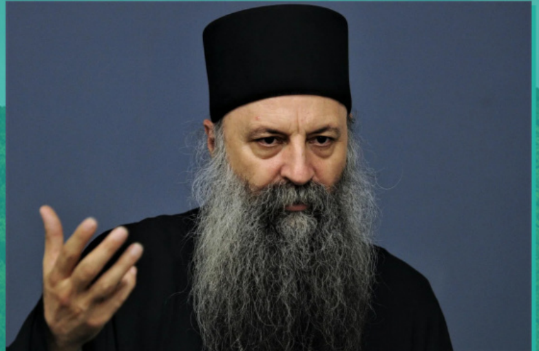
Патријарх српски Порфирије

Архијерејски Сабор Српске Православне Цркве 2014. године изабрао је викарног епископа Епархије бачке Порфирија за митрополита загребачко-љубљанског. Патријарх српски Иринеј обавио је устоличење митрополита у присуству многих архијереја СПЦ-а 13. јуна 2014. године у сабору Преображења Господњег у Загребу. Митрополит Порфирије се прославио на тој функцији захваљујући својој друштвеној и мировној делатности усмереној на јачање Православља у области. За време његовог столовања завршена је обнова манастира Лепавина, најстаријег духовног центра православних Срба у Хрватској.