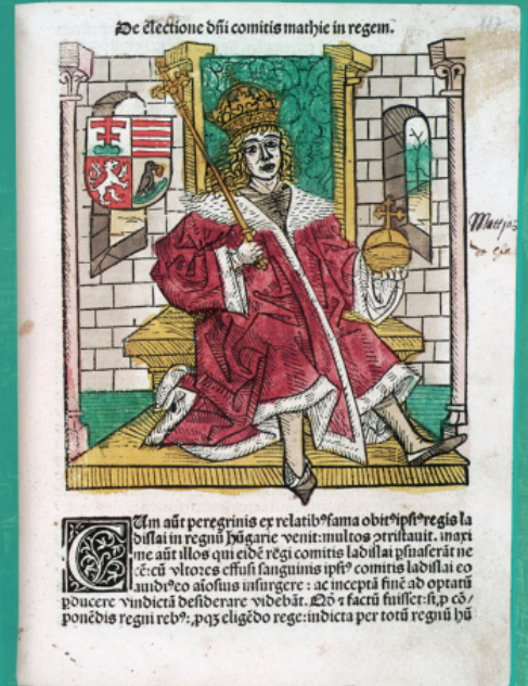
Матијаш Хуњади (Корвин). Ксилографија из издања «Хронике Мађара», XVI век