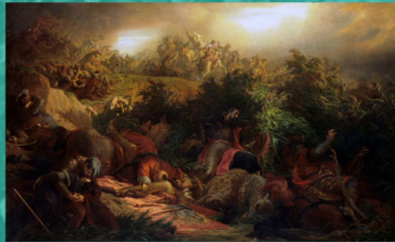
Мохачка битка. Сликар Берталан Шекели

Према Карловачком договору потписаном 26. јануара 1699. године којим је рат завршен, Порта је изгубила своју територију у Славонији, Срему, Бачкој и делимично Далмацији. Оснива се Придворна комисија ради управе над припојеним земљама, која је напослетку почела да преузима власт у своје руке. Дакле, одмах после смрти Арсенија III Чарнојевића 1706. године Беч је запретио Србима да бирају новог патријарха, а за предводника православне цркве у Аустрији почиње да се именује митрополит и архиепископ. Поред тога, Срби крећу да трпе и различите верске притиске, активно се спроводила политика унијаћења. У аустријском затвору 1744. године мучен је преподобни Висарион Сарај, православни мисионар, који се борио против ширења унијаћења на територији Баната и Трансилваније, а који се чак ни током мучења није одрекао истинске вере.