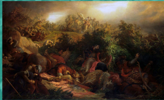
Мохачка битка. Сликар Берталан Шекели