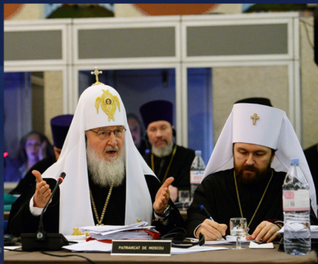
Најсветији Патријарх московски и целе Русије Кирил и митрополит Иларион на заседању Предстојатеља Помесних Православних Цркава. Шамбези, Швајцарска, 22-27. јануар 2016. год.

На Синаксији Поглавара 2014. године одлучено је да се тема аутокефалности поново разматра у оквиру припремне комисије ради подношења Свеpravославном Сабору. Но, до разматрања ипак није дошло, а формални изговор је био наводни недостатак времена. Ипак, 2015. године Поглавари Грузијске, Српске и Бугарске Православне Цркве у преписци са Патријархом Вартоломејем залагали су се за увођење теме аутокефалности у Свети и Велики Сабор.