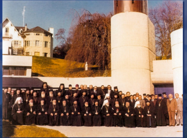
Прво свеправославно предсаборно саветовање. Шамбези, Швајцарска, 1976. год.

Неопходни услови за давање аутокефалности према тачки 3 датог документа били су: „сагласност Цркве-Мајке и загарантован свеправославни консензус“. Након испуњавања поменутих услова процесу се прикључивао Васељенски Патријарх. „После добијања молбе од потчињене црквене области, Црква-Мајка оцењује постојеће еклесиолошке, канонске и пастирске предуслове за давање аутокефалности. У случају ако Помесни Сабор, као највиши црквени орган, да сагласност, он подноси одговарајући предлог Васељенској Патријаршији тражећи свеправославни консензус, информишући остале Помесне Аутокефалне Цркве“. Даље у тачки б) стоји: „Свеправославни консензус изражава се једногласно на Сабору Аутокефалних Цркава“.