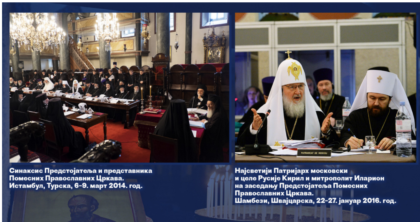
Синаксис Предстојатеља и представника Помесних Православних Цркава. Истамбул, Турска, 6-9. март 2014. год.

Ипак, у априлу 2011. године питање аутокефалности привремено је изузето из дискусије на иницијативу Цариградског Патријарха Вартоломеја, који је упутио писма Помесним Православним Црквама са предлогом да се одржи Свеправославни Сабор, а да се дискусија око спорног питања одложи за боља времена.