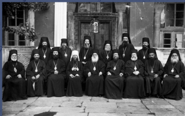
Међуправославна припремна комисија. Ватопедски манастир, 8-23. јун 1930. год.

Идеја решавања нагомиланих проблема у православном свету појавила се на новом Свеpravославном сабору почетком XX века. Тада су се поглавари Помесних Цркава активно дописивали и усагласили оквир тема које ће бити изнете на свеpravославној дискусији.