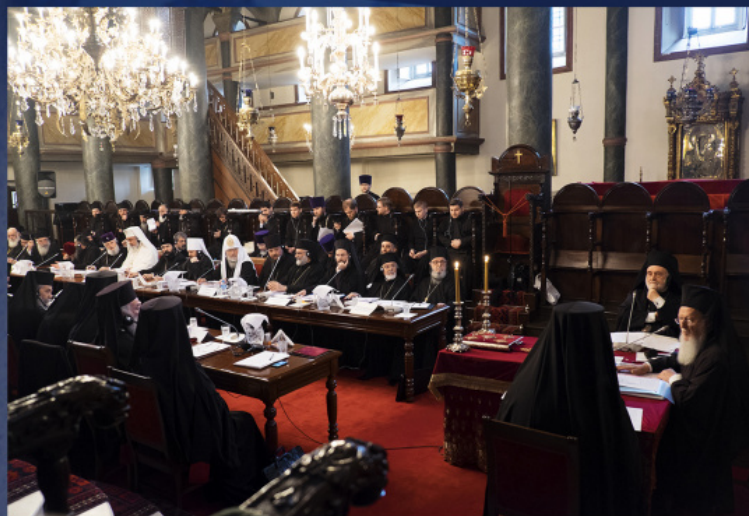
Синаксис Предстојатеља и представника Помесних Православних Цркава. Истамбул, Турска, 6-9. март 2014. год.

Ипак, у априлу 2011. године питање аутокефалности привремено је изузето из дискусије на иницијативу Цариградског Патријарха Вартоломеја, који је упутио писма Помесним Православним Црквама са предлогом да се одржи Свеpravославни Сабор, а да се дискусија око спорног питања одложи за боља времена.