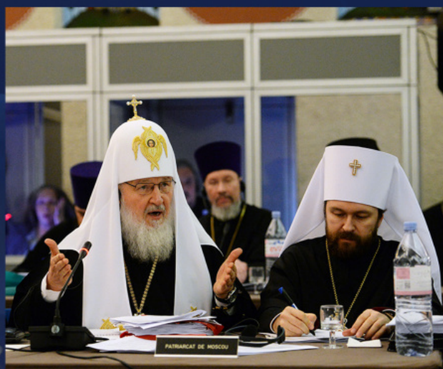
Најсветији Патријарх московски и целе Русије Кирил и митрополит Иларион на заседању Предстојатеља Помесних Православних Цркава. Шамбези, Швајцарска, 22-27. јануар 2016. год.

На Синаксији Поглавара 2014. године одлучено је да се тема аутокефалности поново разматра у оквиру припремне комисије ради подношења Свеправославном Сабору. Но, до разматрања ипак није дошло, а формални изговор је био наводни недостатак времена. Ипак, 2015. године Поглавари Грузијске, Српске и Бугарске Православне Цркве у преписци са Патријархом Вартоломејем залагали су се за увођење теме аутокефалности у Свети и Велики Сабор.