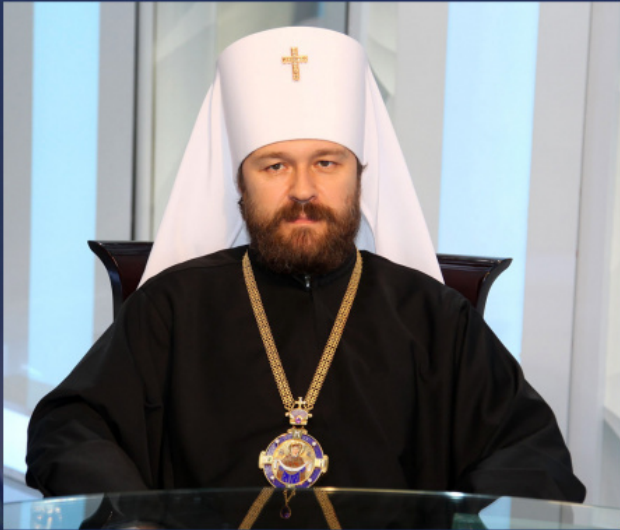
Митрополит Иларион, учесник заседања Међуправославне комисије за припрему Светог и Великог Сабора 10-16. децембар 2009. год. и 22-26. фебруар 2011. год. у Шамбезију.