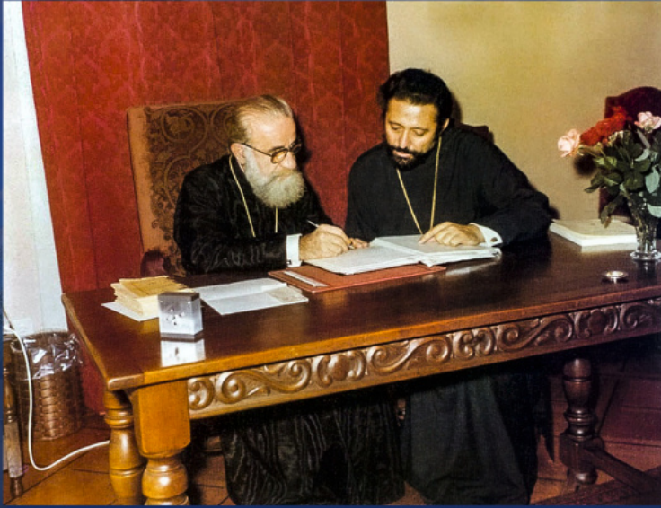
Митрополит халкидонски Мелитон и митрополит швајцарски Дамаскин на предсаборном саветовању у Шамбезију, 1976. год.