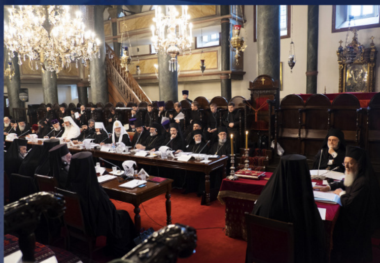
Синаксис Предстојатеља и представника Помесних Православних Цркава. Истамбул, Турска, 6-9. март 2014. год.

Ипак, у априлу 2011. године питање аутокефалности привремено је изузето из дискусије на иницијативу Цариградског Патријарха Вартоломеја, који је упутио писма Помесним Православним Црквама са предлогом да се одржи Свеправославни Сабор, а да се дискусија око спорног питања одложи за боља времена.