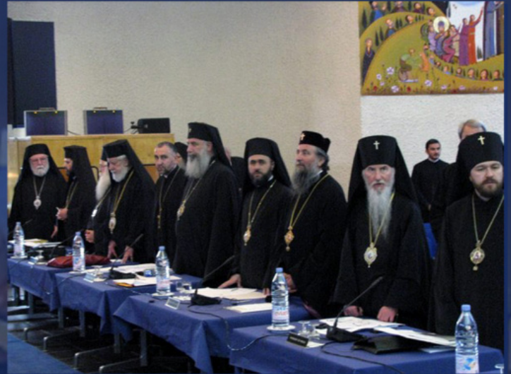
Митрополит Иларион (први здесна) на IV свеpravославном предсаборном заседању. Шамбези, Швајцарска, 6-13. јун 2009. год.

Цариградска Патријаршија се 2008. године одриче претходних потраживања и поново отвара пут ка обнови преговора. Разматрање аутокефалности настављено је на Међуправославној припремној комисији у децембру 2009. године. На овом заседању део Помесних Цркава заступао је став да Томос о аутокефалности потписује „Васељенски Патријарх као гласговорник свеpravославног консензуса“. Истовремено, делегације Руске, Српске, Румунске, Бугарске, Пољске цркве и Цркве чешких земаља и Словачке сматрале су да Томос морају да потпишу представници свих Помесних Цркава. У тачки 3в. документа из 2009. године стајало је: „Изражавајући сагласност Мајке-Цркве и свеpravославног консензуса, Васељенски Патријарх званично даје аутокефалност Цркви која је поднела захтев објављујући Томос о аутокефалности. Тај Томос потписује Васељенски Патријарх, а својим потписима у њему сведоче Његова Блаженства Предстојатељи Пресветих Православних Цркава, које је Васељенски Патријарх позвао ради потписивања.“ Ипак, питање садржаја Томоса и начина потписивања било је пренето за следеће заседање Међуправославне припремне комисије (2011. године).