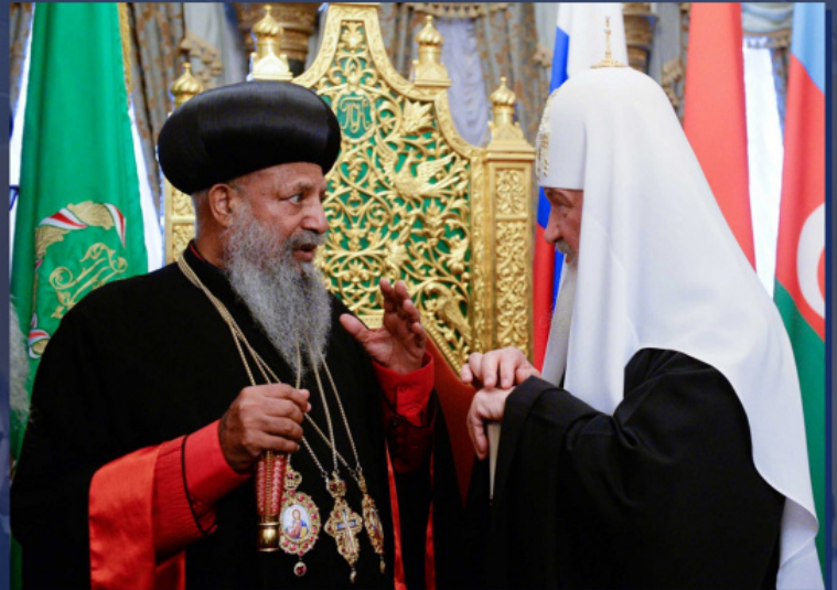
Патријарх етиопијски Абуна Матфиј и Најсветији Патријарх Кирил

У децембру 2019. године Најсветији Патријарх Кирил послао је писма етиопијском Патријарху Абунеу Матфију и премијеру Федеративне Демократске Републике Етиопије А. Алију у којима је изразио забринутост због алармантног развоја ситуације и пружио им подршку. У писму Његове Светости стоји да су догађаји у Етиопији у истом рангу са прогонима хришћанских Цркава у великом броју региона света, где постоје покушаји да се верски фактор искористи за постизање политичких циљева, истовремено слабећи и плашећи традиционалне хришћане.