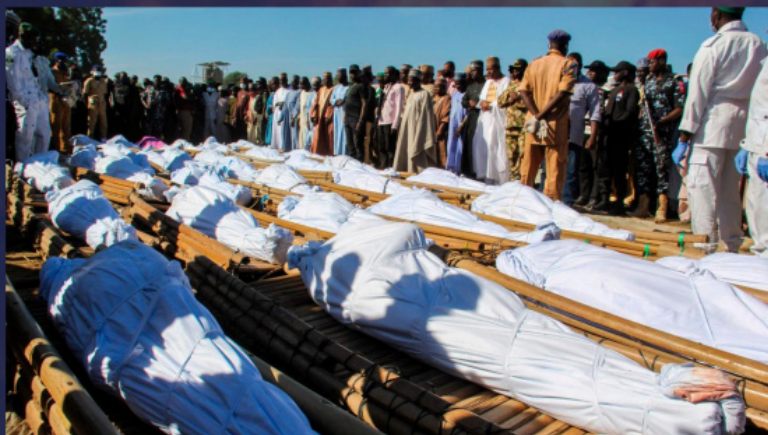
Сахране убијених сељака у Нигерији

На Истоку Африке: у Сомалији, Кенији и суседним државама хришћане прогони терористичка група „Ел-Шабаб“. Главну тактику терориста представља хајка на међуградске аутобусе у којима муслимане раздвајају од хришћана након чега друге убијају. У Кенији је почетком 2021. године запаљено мноштво цркава.