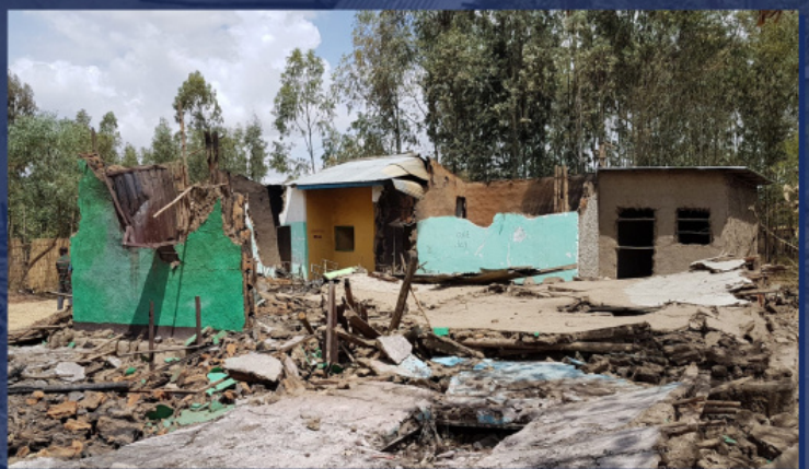
Остаци цркве након напада у Етиопији