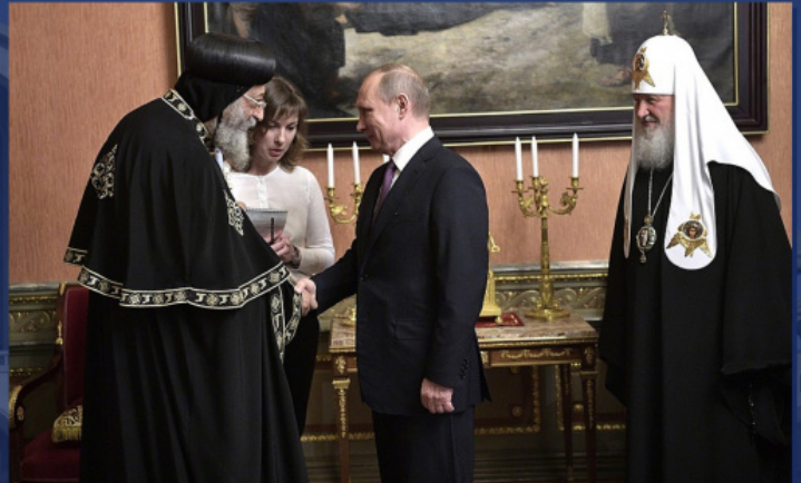
Сусрет В. В. Путина са поглаваром Коптске цркве Патријархом Тавадросом II и Патријархом московским и целе Русије Кирилом

Коптска Црква и Московска Патријаршија имају блиске односе, нарочито током последњих седам година. Коптска Црква је била прва од Древних источних Цркава са којом је Руска Православна Црква оформила Комисију за дијалог (2016. године). Комисија је активна и данас. Патријарх Тавадрос је двапут боравио у посети Русији (2014. и 2017. године), када се сусретао са В. В. Путином, председником Руске Федерације, и Најсветијем Патријархом московским и целе Русије Кирилом. Коптска Црква и Московска Патријаршија су вишеструко учествовале у размени посета делегација, представника медија, синодских одељења и монашких делегација.