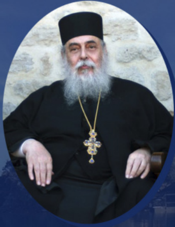
Архимандрит Георгије Капсанис