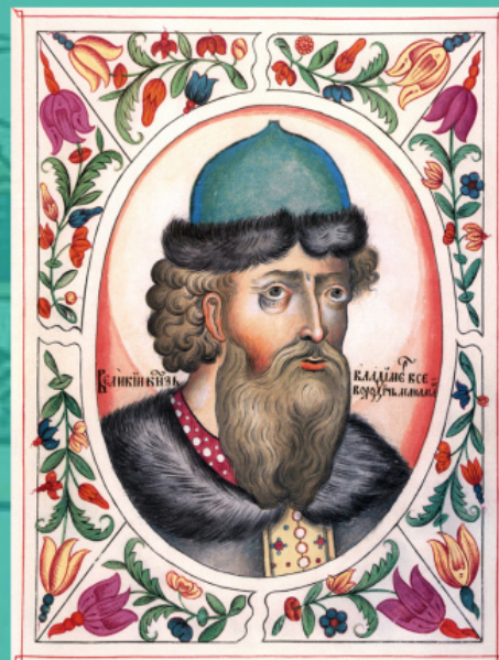
Владимир Всеволодович Мономах. Портрет из «Царског титуларника», XVII век

Карактеристично је да овде цар уопште не уступа своју титулу и централно место заштитника читавог православног света, већ обједињује своју службу руског кнеза који је признат за „слободног самодршца“ и цара Велике Русије. Ову титулу ће „увести“ Иван Васиљевич Грозни 1547. године приликом његовог чувеног крунисања.