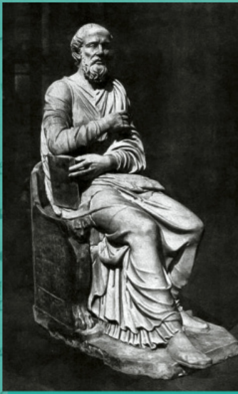
Древна римска скулптура. Вероватно приказан Свети Иполит Римски (III в.). Нађена је 1551. године у Виа Тибуртини у Риму, Ватиканска библиотека, IV-V век

време Христовог доласка (Дан. 9:25–26). Четири царства која је описао уклапала су се у светску историју: Нововавилонско (златни лав) је сменила Персија (сребрни медвед), коју је појела Александрова Македонска држава, која се поделила након његове смрти (бакарни леопард са четири главе). Потом је моћно Римско царство скоро читаву васељену привило у своје гвоздено наручје. У односу на његове претходнике, одликовало га је одсуство јединственог владајућег етноса (што се објаснило тиме да персонификовано чудовиште које представља ово царство не личи ни на једну звер), а примесе глине у гвожђу лако су се објашњавале постепеним мешањем ратоборних Римљана са потчињеним народима. Рогови су могли бити у вези са императорима који су се борили за власт, а „надмена уста“ која угњетавају „народ светих“ природно су се поистоветили са доласком Антихриста након чега је наступило Царство Божије.