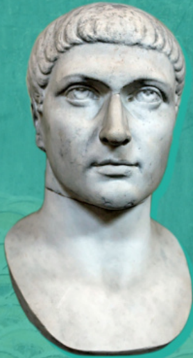
Константин I Велики (274–337. год.)