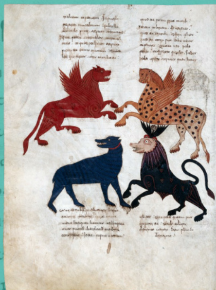
Звери из виђења пророка Данила. Беат либански. Кодекс Фернандо I и Доњи Санчи, 1047. год.

Данилова пророчанства су изазвала велико интересовање, јер је овај пророк прецизно назначио