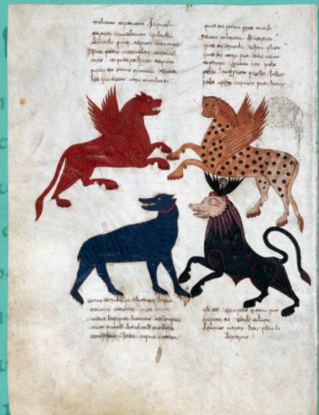
Звери из виђења пророка Данила. Беат либански. Кодекс Фернандо I и Доњи Санчи, 1047. год.

Данилова пророчанства су изазвала велико интересовање, јер је овај пророк прецизно назначио