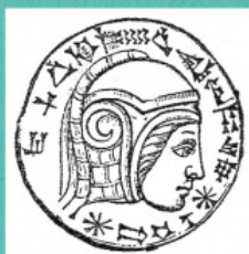
Представа Набукодonosора II, Вавилонска камеја