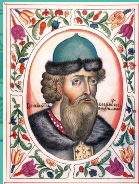
Владимир Всеволодович Мономах. Портрет из «Царског титуларника», XVII век

Карактеристично је да овде цар уопште не уступа своју титулу и централно место заштитника читавог православног света, већ обједињује своју службу руског кнеза који је признат за „слободног самодршца“ и цара Велике Русије. Ову титулу ће „увести“ Иван Васиљевич Грозни 1547. године приликом његовог чувеног крунисања.