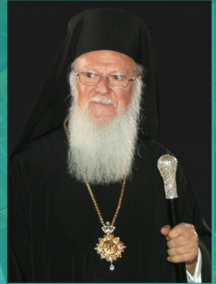
Патријарх Вартоломеј I

Фатаморгана „словенске претње“ била је толико јака да је утицала на то да грчки научници одбију да користе историјски назив „Русик“ (Ρωσικόν) за атонски манастир Светог Пантелејмона. А у свом садашњем деструктивном обрачуну са Московском Патријаршијом око Украјине, Цариградски патријарх Вартоломеј и његови истомишљеници покушавају да играју на карту „грчке солидарности“, упорно позивајући грчке архијереје осталих Помесних Цркава да заузму јасно неканонску страну.