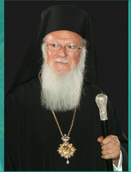
Патријарх Вартоломеј I

Фатаморгана „словенске претње“ била је толико јака да је утицала на то да грчки научници одбију да користе историјски назив „Русик“ (Ρωσικόν) за атонски манастир Светог Пантелејмона. А у свом садашњем деструктивном обрачуну са Московском Патријаршијом око Украјине, Цариградски патријарх Вартоломеј и његови истомишљеници покушавају да играју на карту „грчке солидарности“, упорно позивајући грчке архијереје осталих Помесних Цркава да заузму јасно неканонску страну.