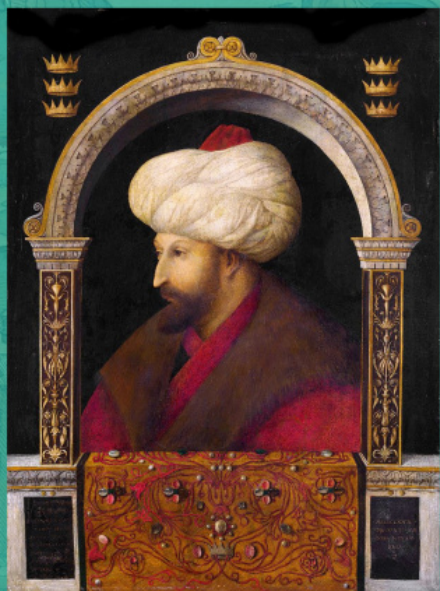
Ђентиле Белини. Портрет Султана Мехмеда II, 1480. год, Национална галерија, Лондон