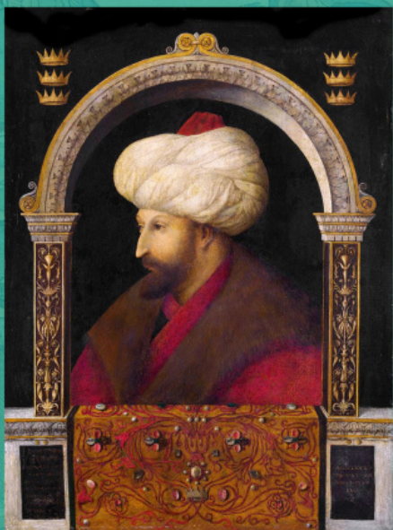
Ђентиле Белини. Портрет Султана Мехмеда II, 1480. год, Национална галерија, Лондон