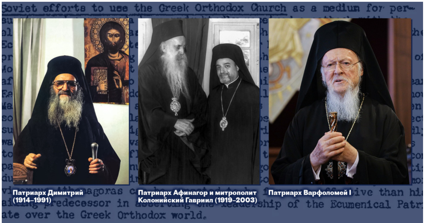
Патриарх Димитрий (1914–1991)