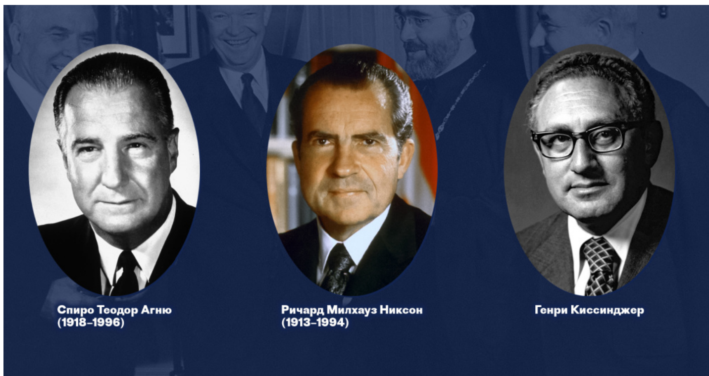
Спиро Теодор Агню (1918–1996)

В день смерти Афинагора, 7 июля 1972 года, вице-президент США Спиро Агню (который сам был американцем греческого происхождения, хотя и не православным) находился в Хьюстоне (штат Техас), где в то время проходил Съезд духовенства и мирян Греческой архиепископии Северной и Южной Америки. Уже утром он встретился с архиепископом Иаковом, главой архиепископии, который очень хотел стать следующим Вселенским Патриархом, однако был не в ладах с турецким правительством и формально не имел права быть избранным, так как не имел турецкого гражданства. Иаков умолял вице-президента присутствовать на похоронах Афинагора в Стамбуле. Агню отказался, но допустил возможность того, что президент Никсон направит на похороны самого Иакова во главе экуменической делегации.