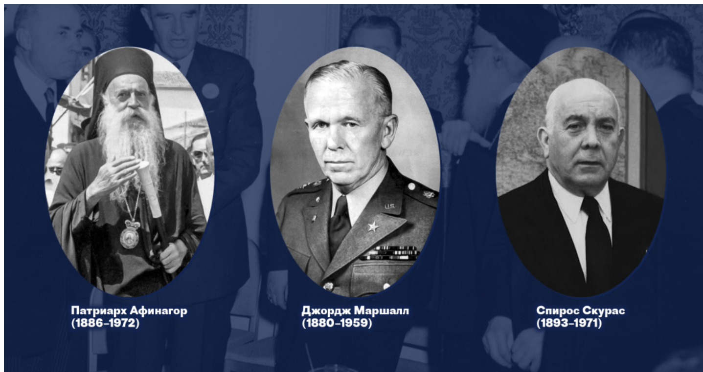
Патриарх Афинагор (1886–1972)