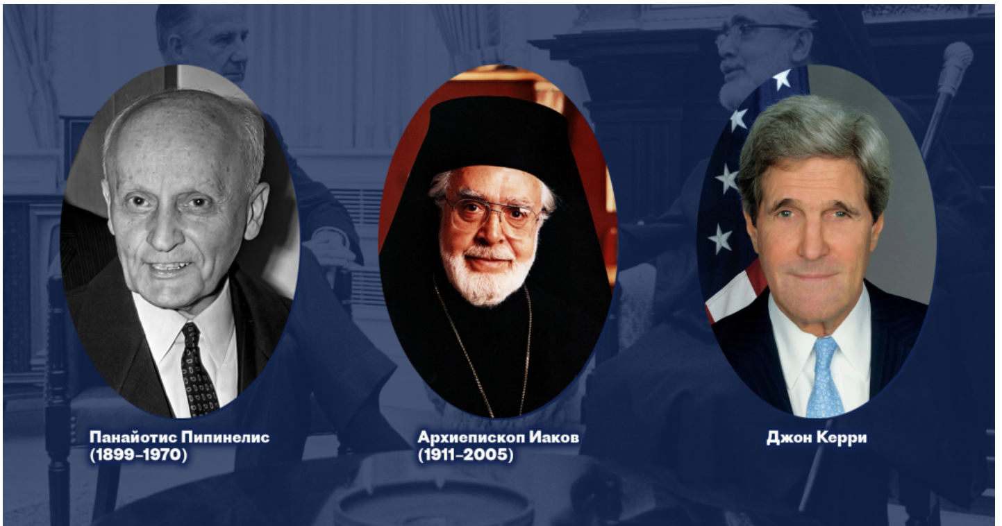
Панайотис Пипинелис (1899–1970)

Священный Синод Константинополя должен был в течение определенного периода времени составить список кандидатов и передать его на рассмотрение губернатору (вали) Стамбула. Удалив из списка все имена, вызвавшие возражение турецких властей, губернатор должен был вернуть исправленный вариант Священному Синоду, который уже избирал Патриарха из числа одобренных заранее кандидатов (согласно показаниям госсекретаря США Джона Керри, «в постановлениях также говорилось о том, что, если патриарх не будет избран в течение восьми дней, губернатор Стамбула может назначить патриарха – хотя этот аспект постановления никогда не применялся на практике». См. стр. 132-133 этого документа ).