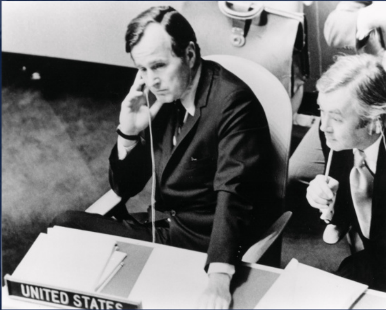
Джордж Герберт Уокер Буш (1924–2018) в 70-е годы был Постоянным представителем США при ООН