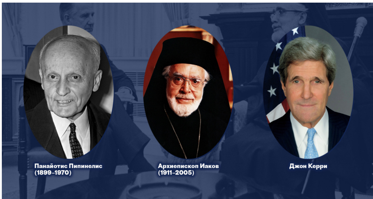
Панайотис Пипинелис (1899–1970)

Священный Синод Константинополя должен был в течение определенного периода времени составить список кандидатов и передать его на рассмотрение губернатору (вали) Стамбула. Удалив из списка все имена, вызвавшие возражение турецких властей, губернатор должен был вернуть исправленный вариант Священному Синоду, который уже избирал Патриарха из числа одобренных заранее кандидатов (согласно показаниям госсекретаря США Джона Керри, «в постановлениях также говорилось о том, что, если патриарх не будет избран в течение восьми дней, губернатор Стамбула может назначить патриарха – хотя этот аспект постановления никогда не применялся на практике». См. стр. 132-133 этого документа ).