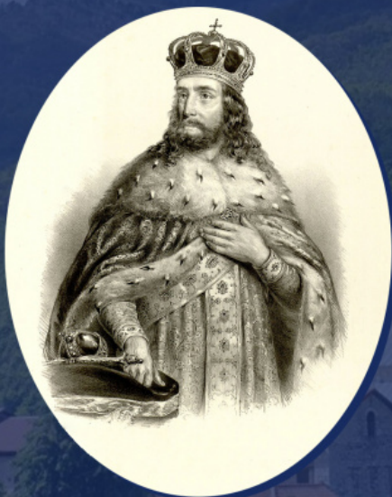
Стефан Урош III Дечанский. Литография Анастаса Йовановича