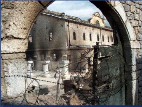
Собор Святого Георгия в Призрене после погрома, март 2004 г.