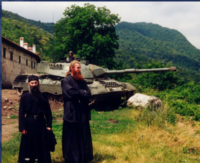
Под охраной международного контингента КФОР

17 марта 2004 г. по всей территории Косово и Метохии прошли многочисленные и хорошо организованные нападения на сербов. В результате погрома 19 человек погибло, более 140 получили ранение, несколько тысяч сербов бежали из своих разрушенных домов. Также были осквернены, уничтожены или сожжены 35 храмов и монастырей. И все это происходило подчас при безучастных взглядах военнослужащих КФОР, призванных в край для обеспечения безопасности и сохранения мира на многострадальной земле.