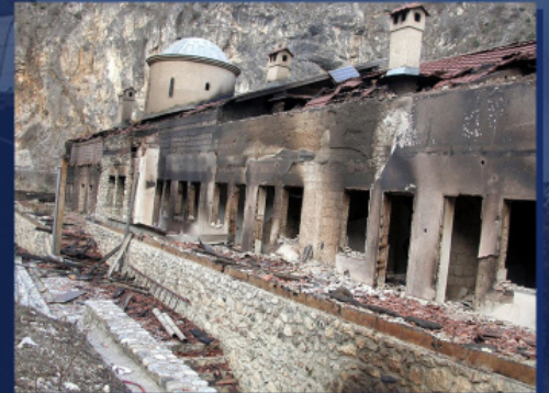
Монастырь Святых Архангелов около Призрена после погрома, март 2004 г.

В 2008 г. албанцы провозгласили независимость Косово, которую до сих пор не признали Россия, Китай и многие другие страны. Вот какими словами на это решение ответил Сербский Патриарх Павел в своем Пасхальном послании 2008 г.: «Сильные мира сего <...> хотят коллективно казнить православный сербский народ, хотят его сломить и стереть, чтобы сделать из него безликую массу, чтобы вырвать из недр его сердце... Покоряясь Христовой воле, мы свидетельствуем об их беззаконии, их лицемерии, напоминающих нам о том, как Пилат умыл руки, бывшие в крови Праведника».