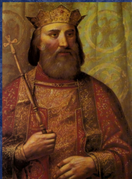
Лазарь Хребелянович (1329-1389)