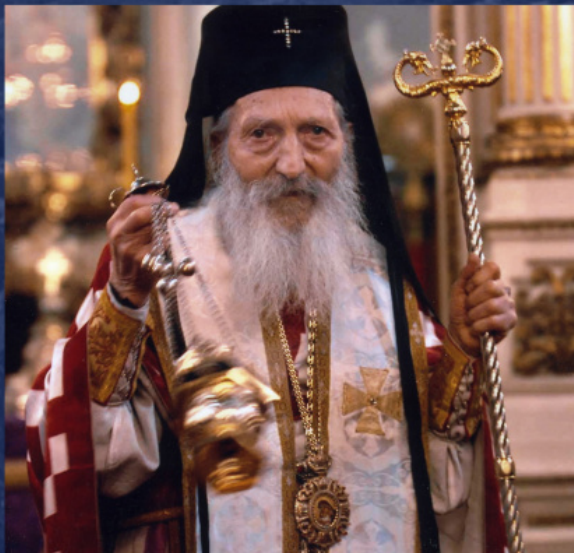
Патриарх Сербский Павел (Стойчевич) (1914–2009)

всячески помочь и сберечь свою паству, так сербы стали селиться близ Дечан. После бомбардировок Югославии в 1999 г., Дечаны вновь стали охранять итальянцы из сил КФОР (во время Второй мировой войны монастырь входил в итальянскую зону оккупации). Однако даже это не останавливало албанцев: в 2002, 2004 и 2007 гг. монастырь обстреливался из гранатомета.