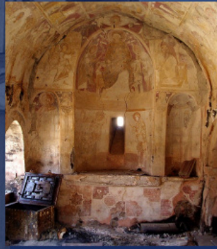
Храм Богородицы Левишской в Призрене после погрома, март 2004 г.