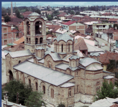
Церковь Богородицы Левишки