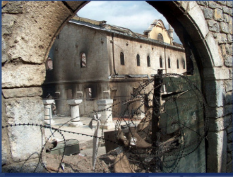
Собор Святого Георгия в Призрене после погрома, март 2004 г.