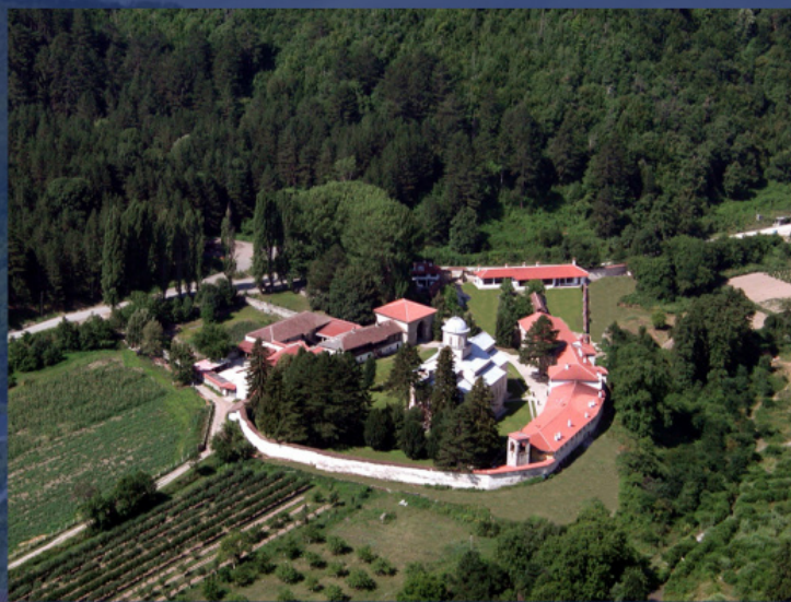
Монастырь Высокие Дечаны