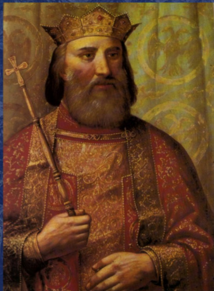
Лазарь Хребелянович (1329-1389)