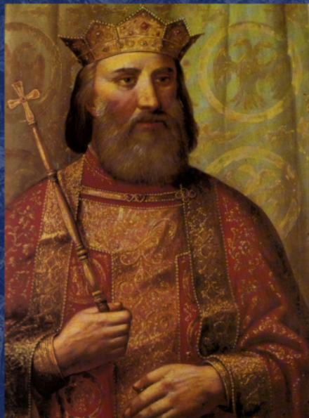
Лазарь Хребелянович (1329-1389)