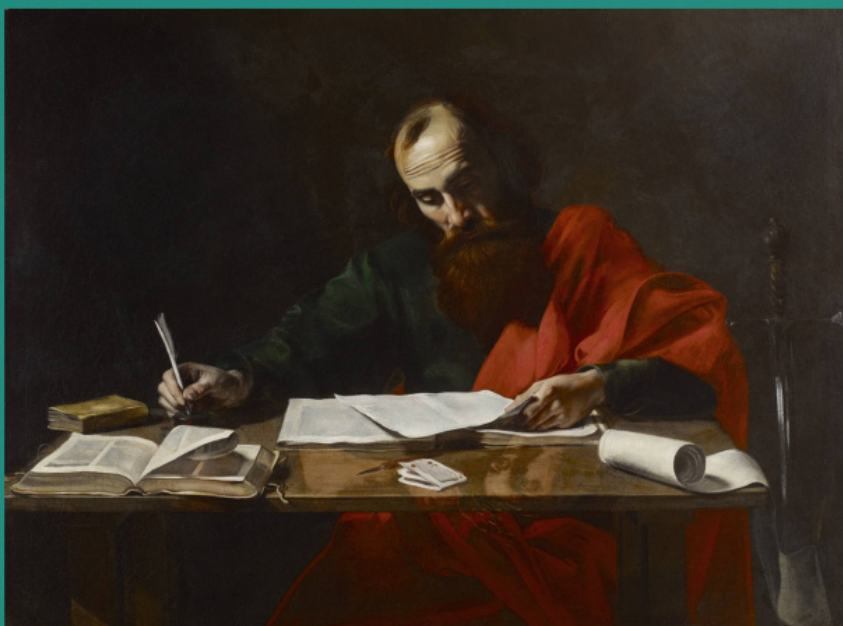
Святой Павел пишет свои послания. Валантен де Булонь, 1618–1620 гг.

Удалите с лица своего пелену тьмы, которая мешает вам узреть сладость [жизни со Христом]. Имейте любовь к ближнему и познайте достоинство этой добродетели. Послушайте апостола Павла, как он говорит вам, что «вы – храм Бога живого» (2 Кор. 6, 16). Да храните это в сердцах ваших и не осуждайте ближнего, не огорчайте его, дабы не прогневать живущего в нем Бога. Потому что всякая честь, которой человек почитает брата своего, – это честь, которую он приносит Христу, и да будет слава Ему!