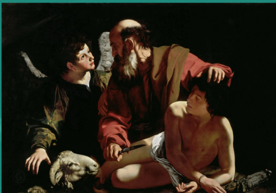
Принесение Исаака в жертву. Микеланджело Меризи да Караваджо, 1598 г.

Мы не имеем такой совершенной и полной любви к Богу, как у наших святых отцов. Тех, кто искренне любит Бога чистой любовью, не содержащей обмана или лицемерия, ничто не отделяет от любви Божией – ни дети, ни жена, ни брат, ни семья, ни золото, ни власть. Как Авраам, искренне любивший Бога, не пощадил сына своего Исаака, когда Он повелел ему принести того в жертву, но послушал Его и сделал то, что было ему повелено. И как святые мученики, которые предпочли любовь к Богу временной жизни и терпеливо переносили страдания, проливая свою кровь. Из-за любви к Богу, которую они имели, исполнили они слова апостола Павла: «Кто отлучит нас от любви Божией: скорбь, или теснота, или гонение, или голод, или нагота, или опасность, или меч?.. Ибо я уверен, что ни смерть, ни жизнь, ни Ангелы, ни Начала, ни Силы, ни настоящее, ни будущее, ни высота, ни глубина, ни другая какая тварь не может отлучить нас от любви Божией во Христе Иисусе, Господе нашем» (Рим. 8, 35, 38 – 39).