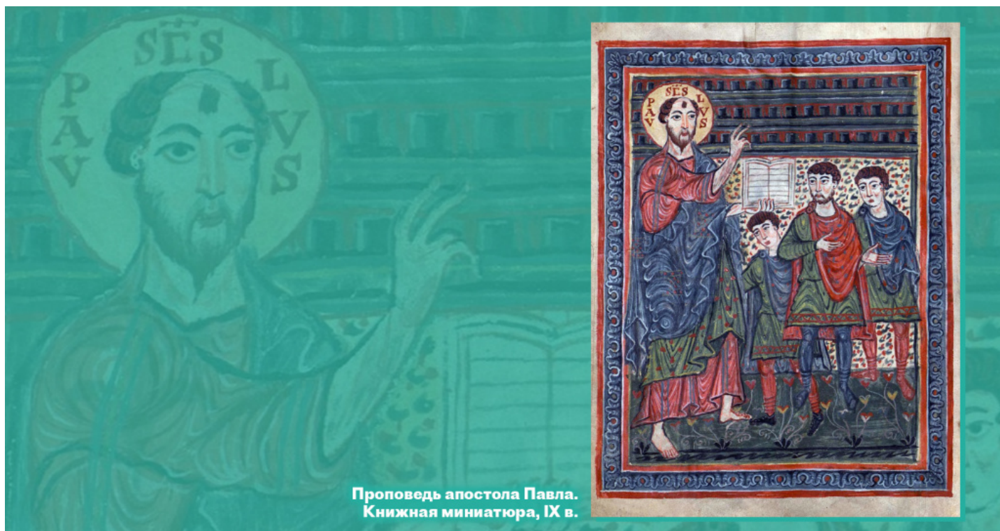
Проповедь апостола Павла. Книжная миниатюра, IX в.

Дети мои, трудитесь теперь изо всех сил, помышляя о той славе, что увенчает ваши труды. Заботьтесь о том, чтобы не лишиться благодати. В Послании святого апостола Павла говорится: «Помышления плотские суть смерть, а помышления духовные – жизнь» (Рим. 8, 6). Да будут же ныне помышления наши духовны, дабы могли мы жить вечно, унаследовав блаженство.