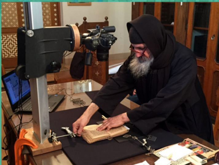
Монах монастыря Преподобного Макария Великого оцифровывает рукописи

Экземпляры первоначального и ограниченного на сегодня тиража книги были доставлены в Россию делегацией игуменов и насельников монастырей Коптской Церкви 23 августа – 1 сентября 2021 года.