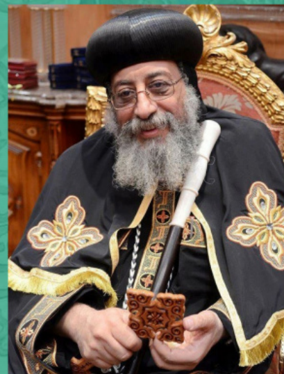
Патриарх Коптский Тавадрос II

Публикуемое ниже произведение, являющееся по сути кратким изложением основ благочестивой жизни христианина, поражает простотой и одновременно глубиной мысли, содержит никогда не утрачивающие своей актуальности духовные советы и, несомненно, представляет живой интерес для широкого круга читателей.