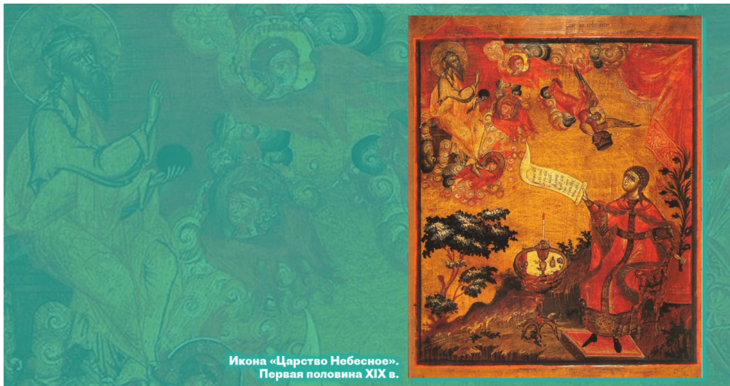
Икона «Царство Небесное». Первая половина XIX в.

Помните, что всякий, отказывающийся от покаяния и милосердия, удаляет от себя и Царство Небесное.