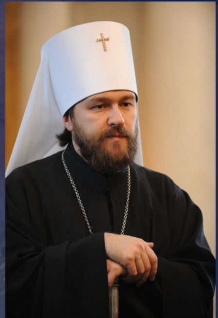
Митрополит Иларион (Алфеев)

К обсуждению этого вопроса должны были вернуться в 2007 году на заседании в Равенне. Однако, из-за провокации Константинопольского Патриархата, включившего в свою делегацию представителей неканонической «Эстонской Апостольской Церкви», созданной Фанаром на канонической территории Московского Патриархата, Русская Православная Церковь была вынуждена покинуть заседание и не принимала участия в его работе. Вышедший по его окончании «Равеннский документ», содержащий данную спорную формулировку, вызвал несогласие Русской Церкви, которая к 2013 году подготовила свой собственный документ «Позиция Московского Патриархата по вопросу о первенстве во Вселенской Церкви». В нем за Константинопольской Церковью признавалось «первенство чести», содержательное наполнение которого, однако, определялось «консенсусом Православных Церквей» [8]. Таким образом, если Фанар (а за ним и косвенно Рим) настаивал на том, что он обладает некоторыми властными полномочиями на Вселенском или общеправославном уровне сам по себе, то Русская Церковь, утверждала, что источником возможных полномочий какой-либо председательствующей Церкви может быть только согласие в каждом конкретном случае всех прочих Поместных Церквей.