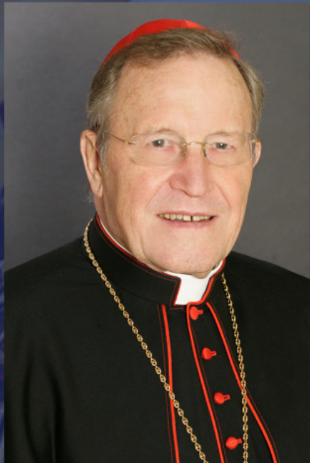
Кардинал Вальтер Каспер