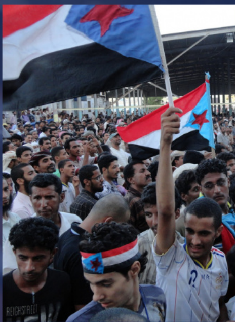
Арабская весна, 2011 г.

Во-вторых, обе Церкви столкнулись с новыми вызовами, которые подталкивали их к сотрудничеству. Прежде всего это было развертывание гонений на христиан на Ближнем Востоке и в Африке. После вторжения США в Ирак в 2003 году и особенно после начала Арабской весны в 2011 году исконное христианское население Леванта столкнулось с преследованиями на религиозной почве. Они нуждались в массовой скоординированной помощи. В этих условиях началось сближение Русской Церкви и Ватикана. Доказательством этому служит и то, что значительная часть совместной декларации Папы Франциска и Патриарха Кирилла 2016 года как раз и посвящена защите христиан от новых гонений.