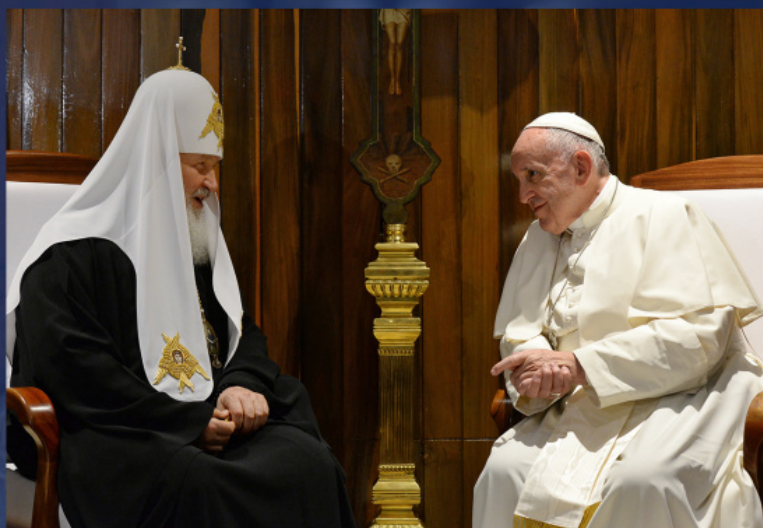
Встреча Святейшего Патриарха Московского и всея Руси Кирилла со Святейшим Папой Римским Франциском, 12 февраля 2016 г.

Другим вызовом, с которым столкнулся христианский мир, стало наступление агрессивного секуляризма. Тогда как многие западные конфессии предпочли путь приспособления своего наследия к изменяющейся действительности, православные, католики и консервативные протестанты принялись отстаивать традиционные христианские ценности. Хотя оценить эффективность работы на этом направлении представляется достаточно сложным, само совпадение взглядов православных и католиков по этому вопросу побуждает их искать новые формы взаимодействия и помогает договариваться друг с другом.