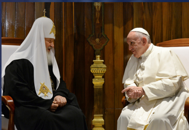
Встреча Святейшего Патриарха Московского и всея Руси Кирилла со Святейшим Папой Римским Франциском, 12 февраля 2016 г.

Другим вызовом, с которым столкнулся христианский мир, стало наступление агрессивного секуляризма. Тогда как многие западные конфессии предпочли путь приспособления своего наследия к изменяющейся действительности, православные, католики и консервативные протестанты принялись отстаивать традиционные христианские ценности. Хотя оценить эффективность работы на этом направлении представляется достаточно сложным, само совпадение взглядов православных и католиков по этому вопросу побуждает их искать новые формы взаимодействия и помогает договариваться друг с другом.