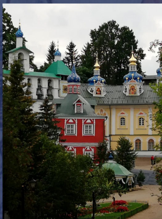
Свято-Успенский Псково-Печерский монастырь

Значение Киева для религиозной истории восточных славян не просто велико, оно огромно. Киеву, стольному городу Рюриковичей, предстояло стать и главным городом русского православия, древнерусским Иерусалимом и Константинополем. Вероятно, именно здесь, а не в Корсуни (Херсонесе), крестился князь Владимир. Отсюда началась христианизация, сопровождавшаяся низвержением идолов языческих богов и массовым крещением населения. Здесь утвердилась кафедра Русской митрополии, предстоятели которой на протяжении столетий, даже после перенесения кафедры, продолжали именоваться Киевскими. На киевских холмах возник Печерский монастырь — корень древнерусской иноческой традиции, важнейший центр славянской книжности, «кузница кадров» Русской Православной Церкви.