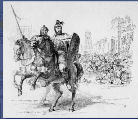
Великий князь Мстислав Изяславич. Рисунок В. П. Верещагина