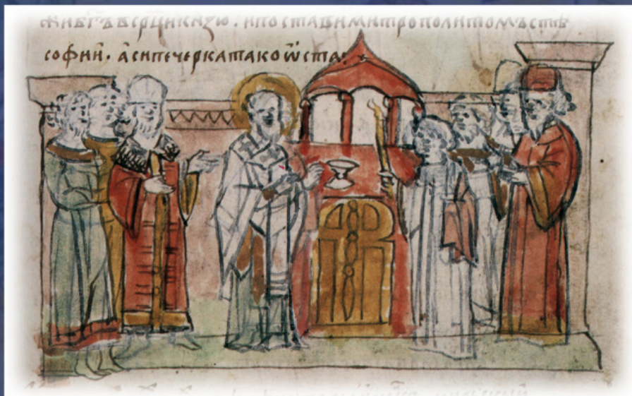
Настольное митрополита Илариона. Миниатюра из Радзивилловской летописи, XV в.

появляется и включается в «Повесть временных лет» показательное предание — «Слово о проявлении Крещения Рускыя земля святого апостола Андрея, како приходил в Русь». Согласно Слову, путешествовавший из Корсунки в Рим апостол Андрей остановился на днепровских холмах, где изрек ученикам пророчество: «Видите ли горы эти? Так на этих горах воссияет благодать Божия, будет город великий, и воздвигнет Бог много церквей». И взойдя на горы эти, благословил их и поставил крест, и помолился Богу, и сошел с горы этой, где впоследствии будет Киев». Автор «Повести временных лет» вложил в уста князя Олега и ставшую крылатой фразу, произнесенную князем, когда тот утвердился на киевском столе: «Да будет это мать городам русским».