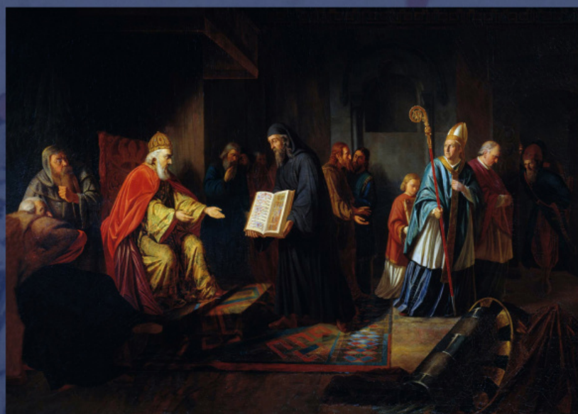
Великий князь Владимир избирает религию. И. Эггинк, 1822 г.

В то же время несомненно, что краеугольной для русской христианизации стала деятельность киевского князя Владимира Святославича, прославленного в чине равноапостольных и в былинах обретшего имя «Красно Солнышко». Принятие князем Владимиром и его дружиной восточного христианства в конце 980-х годов вылилось в мероприятия по христианизации древнерусского государства и привело к созданию новой церковной организации — митрополии всея Руси, подчинявшейся Константинопольскому патриарху.