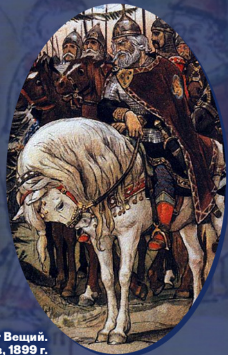
Киевский князь Олег Вещий. В. Васнецов, 1899 г.

Киев становится для Руси законодателем моды в области высокого искусства, которое в пору Средневековья было исключительно религиозным. В свою очередь киевская традиция питается соками византийской культуры, в то время достигшей своего зенита. «Великой преемственностью» называл развитие Руси после принятия христианства историк искусства Л. Д. Любимов. Академик Д. С. Лихачев вовсе считал слово «влияние» слабо отражающим действительное значение Византии в русской истории: «Во многих случаях поэтому правильнее говорить не о «влиянии» отдельных культурных явлений Византии, а о переносе этих явлений». Лучшие византийские зодчие трудятся над храмами Киева, талантливые живописцы создают для них сверкающие мозаики, яркие фрески и величественные иконы, утонченные ценители слова работают над книгами — «реками, наполняющими Вселенную» и киевские книгохранилища.