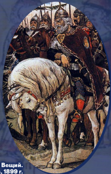
Киевский князь Олег Вещий. В. Васнецов, 1899 г.

Киев становится для Руси законодателем моды в области высокого искусства, которое в пору Средневековья было исключительно религиозным. В свою очередь киевская традиция питается соками византийской культуры, в то время достигшей своего зенита. «Великой преемственностью» называл развитие Руси после принятия христианства историк искусства Л. Д. Любимов. Академик Д. С. Лихачев вовсе считал слово «влияние» слабо отражающим действительное значение Византии в русской истории: «Во многих случаях поэтому правильнее говорить не о «влиянии» отдельных культурных явлений Византии, а о переносе этих явлений». Лучшие византийские зодчие трудятся над храмами Киева, талантливые живописцы создают для них сверкающие мозаики, яркие фрески и величественные иконы, утонченные ценители слова работают над книгами — «реками, наполняющими Вселенную» и киевские книгохранилища.