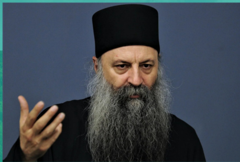
Патриарх Сербский Порфирий

В 2014 г. Архиерейский Собор СПЦ избрал викария Бачской епархии Порфирия митрополитом Загребско-Люблянским. Настолование, которое совершил Патриарх Сербский Ириней в присутствии многих архиереев СПЦ, состоялось 13 июня 2014 г. в кафедральном соборе Преображения Господня в Загребе. На этом посту митрополит Порфирий снискал широкую известность благодаря своей общественной и миротворческой деятельности, направленной на укрепление Православия в регионе. При нем также было завершено обновление монастыря Лепавина, старейшего духовного центра православных сербов в Хорватии.