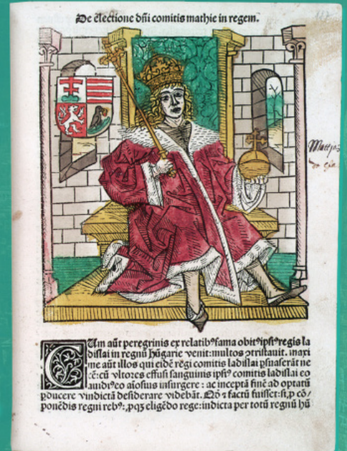
Матьяш Хуньяди (Корвин). Ксилография из издания «Хроники венгров», XVI в.

Венгрия потерпела сокрушительное поражение против турок в битве при Мохаче в 1526 г., большая часть территории вошла в пределы Османской империи. Генуэзец Мернавино писал в 1573 г., что христиане не имели права участвовать в государственном управлении, носить оружие, не могли свободно веселиться и танцевать, должны были покорно сносить любое оскорбление турка, а за «проявленное неуважение к мусульманской религии насильственно обращались в ислам, или казнились». Другая часть земель Западной Венгрии и Хорватии оказались под властью Габсбургов. Именно на землях, где проживали сербы и хорваты, в 1578 г. была устроена Военная граница (или Военная Крайна) для борьбы против осман.