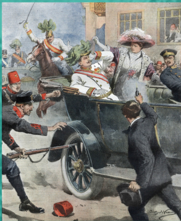
Убийство эрцгерцога Франца Фердинанда и его жены. Иллюстрация Ахилле Бельтраме, 1914 г.

Отношения между сербами и хорватами оставались крайне напряженными в период существования Королевства сербов, хорватов и словенцев, а затем Югославии (с 1929 г.), поскольку новое государство носило унитарный характер, что не устраивало хорватское население. Также активную роль в межнациональной вражде играл Ватикан, проводивший т.н. «Католическую акцию», целью которой стало привлечение молодежи в различные религиозные организации («Орлы», «Крестоносцы»), а также продолжение политики окатоличивания сербов и боснийцев.