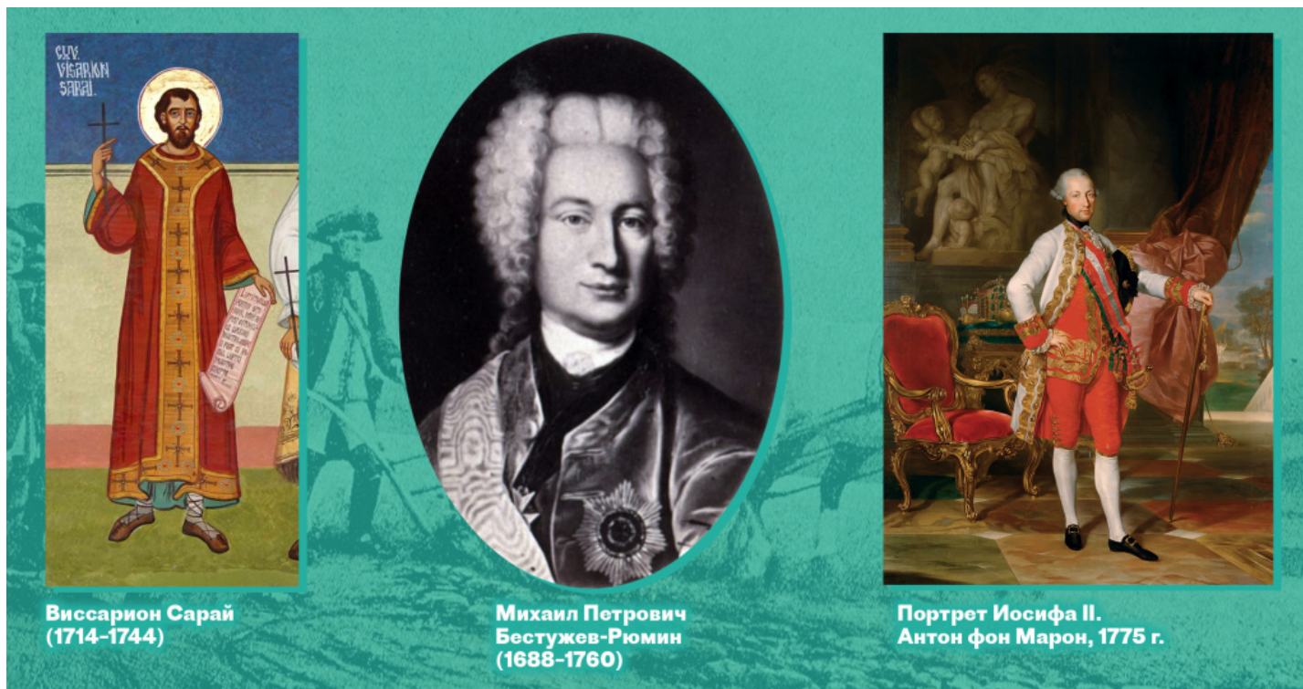
Виссарион Сарай (1714–1744)

В середине XVIII в. значительное число сербов переселилось в Россию, в так называемую Новую Сербию (Екатеринославскую губернию), из-за религиозных гонений и других притеснений. В этих обстоятельствах Вена была вынуждена пойти на некоторые уступки. Так в 1781 г. Иосиф II издал Патент о веротерпимости, уравнивший все религии на территории империи, но не снявший ряда ограничений времен Марии Терезии, касавшихся духовной деятельности. В конце XVIII в. в хорватских землях появилась первая сербская школа. В это время было построено и большинство православных церквей и семинарий на территории Хорватии. Стал издаваться сербский журнал «Добрый пастырь».