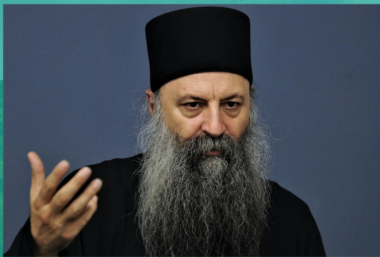
Патриарх Сербский Порфирий

В 2014 г. Архиерейский Собор СПЦ избрал викария Бачской епархии Порфирия митрополитом Загребско-Люблянским. Настолование, которое совершил Патриарх Сербский Ириней в присутствии многих архиереев СПЦ, состоялось 13 июня 2014 г. в кафедральном соборе Преображения Господня в Загребе. На этом посту митрополит Порфирий снискал широкую известность благодаря своей общественной и миротворческой деятельности, направленной на укрепление Православия в регионе. При нем также было завершено обновление монастыря Лепавина, старейшего духовного центра православных сербов в Хорватии.