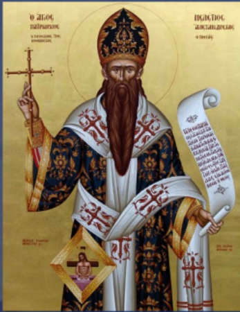
Патриарх Александрийский Мелетий I (1549-1601)