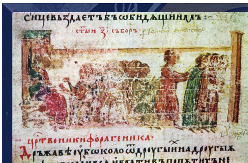
Седьмой Вселенский Собор. Книжная миниатюра. Манасиева летопись, XIV в.

Характерно, что в IX в. на прямой вопрос о значении титула «Вселенский», который задал в Константинополе папский посланец Анастасий Библиотекарь, ему ответили, что не потому называют патриарха вселенским (oecumenicus, universalis), что он будто бы епископ над всем миром, но потому, что он имеет начальническую власть над одной из частей населённого христианами мира [10].