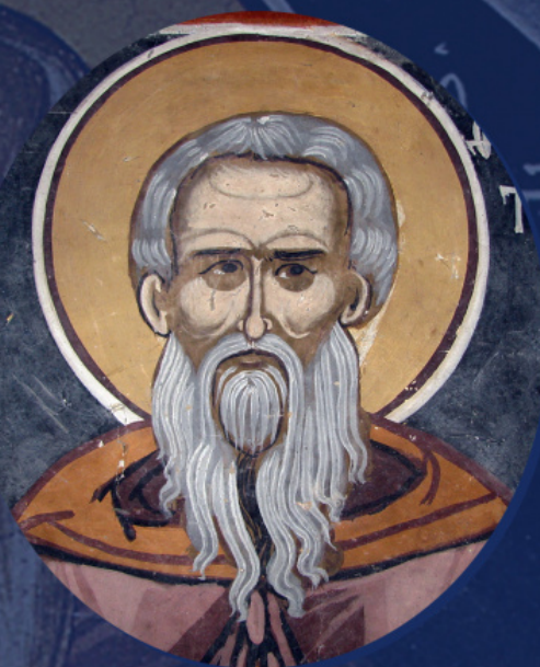
Преподобный Феофан исповедник. Фрагмент фрески, Македония, XVII в.

Впоследствии византийские канонисты Феодор Вальсамон (XI в.) и Матфей Властарь (XIV в.)