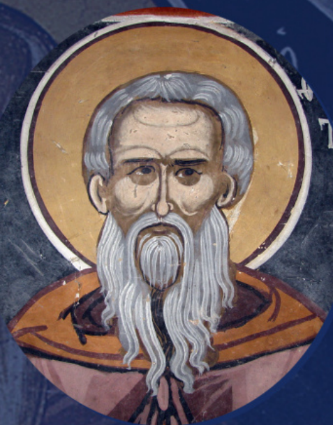
Преподобный Феофан исповедник. Фрагмент фрески, Македония, XVII в.

Впоследствии византийские канонисты Феодор Вальсамон (XI в.) и Матфей Властарь (XIV в.)