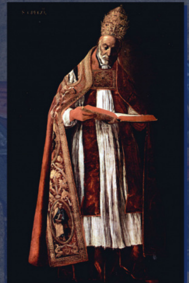
Папа Григорий I. Ф. Сурбаран, 1626–1627 гг.

Но только в законах Юстиниана (с 530 г.) формула «Вселенский Патриарх» начинает официально применяться в отношении архиепископов Константинополя — Нового Рима [6]. Это новшество было не сразу замечено за пределами Византии, а когда было замечено — немедленно вызвало