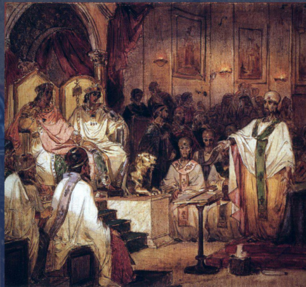
Четвертый Вселенский Халкидонский Собор. В. И. Суриков, 1876 г.