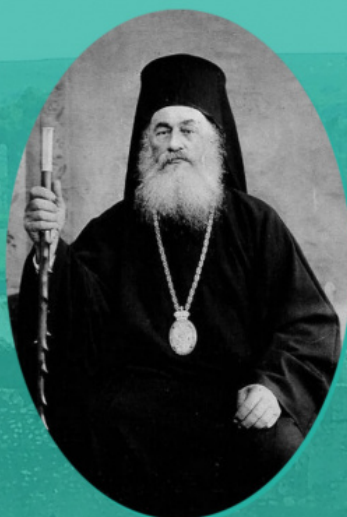
Патриарх Иоаким III (1834-1912)