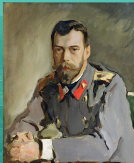
Портрет Николая II. В. А. Серов, ок. 1900 г.