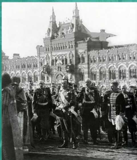
300-летие дома Романовых. Николай II принимает участие в торжественном молебне на Красной площади