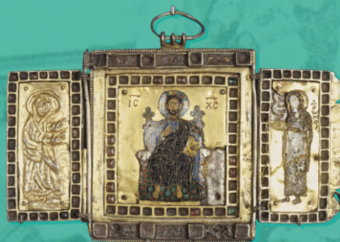
Деисус. Триптих-ставроетка (Сайданайский триптих). Византия, Константинополь, XI в.