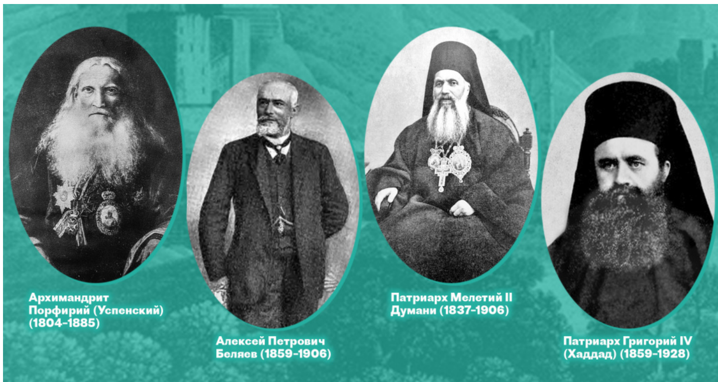
Архимандрит Порфирий (Успенский) (1804–1885)