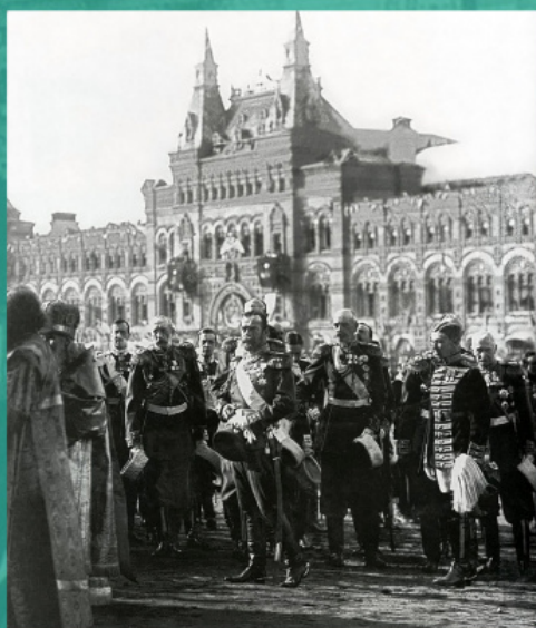
300-летие дома Романовых. Николай II принимает участие в торжественном молебне на Красной площади