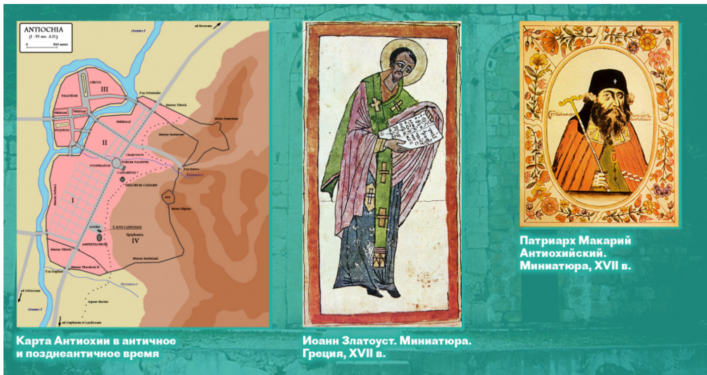
Карта Антиохии в античное и позднеантичное время