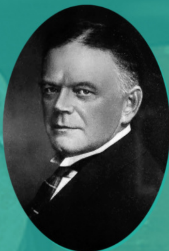
Борис Владимирович Фармаковский (1870-1928)