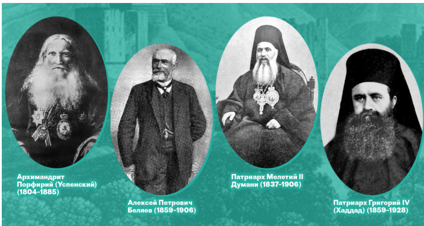
Архимандрит Порфирий (Успенский) (1804–1885)