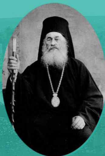
Патриарх Иоаким III (1834-1912)