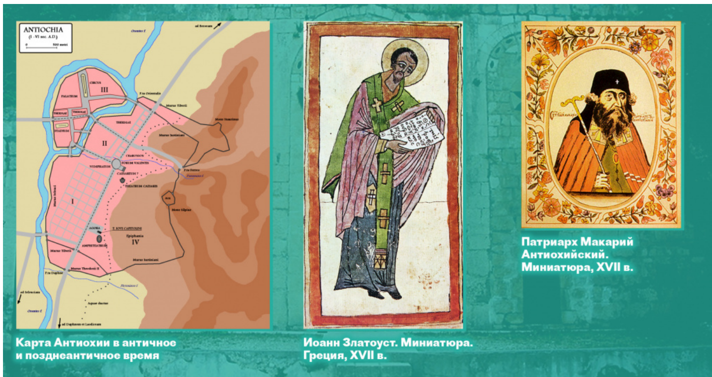
Карта Антиохии в античное и позднеантичное время