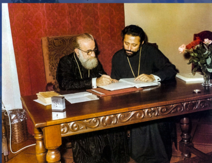
Митрополит Халкидонский Мелитон и митрополит Швейцарский Дамаскин на предсоборном совещании в Шамбези, 1976 г.

В ноябре 1993 года на Межправославной подготовительной комиссии в швейцарском Шамбези тема автокефалии наконец начала обсуждаться по существу.