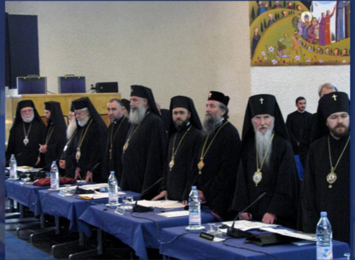
Митрополит Иларион (крайний справа) на IV всеправославном предсоборном совещании. Шамбези, Швейцария, 6-13 июня 2009 г.

В 2008 году Константинопольский Патриархат отказался от прежних требований и вновь открыл путь к возобновлению переговоров. Обсуждение проблемы автокефалии продолжилось на Межправославной подготовительной комиссии в декабре 2009 года. На этом заседании часть Поместных Церквей стояла на позиции, что Томос об автокефалии подписывает «Вселенский Патриарх, как выразитель всеправославного консенсуса». В свою очередь делегации Русской, Сербской, Румынской, Болгарской, Польской и Церкви Чешских земель и Словакии полагали, что Томос должен быть подписан представителями всех Поместных Церквей. Пункт 3в. в 2009 году звучал так «Выражая согласие Матери-Церкви и всеправославный консенсус, Вселенский Патриарх официально провозглашает автокефалию ходатайствующей об этом Церкви посредством издания Томоса об автокефалии. Этот Томос подписывается Вселенским Патриархом и свидетельствуется подписями в нем Блаженнейших Предстоятелей святейших Православных Церквей, приглашенных для этого Вселенским Патриархом». Но вопрос содержания Томоса и способа его подписания переносился на следующую Межправославную подготовительную комиссию (2011).