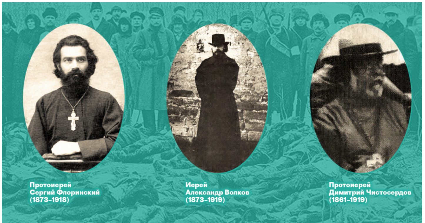
Протоиерей Сергий Флоринский (1873–1918)