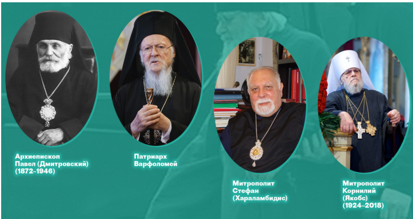
Архиепископ Павел (Дмитровский) (1872–1946)