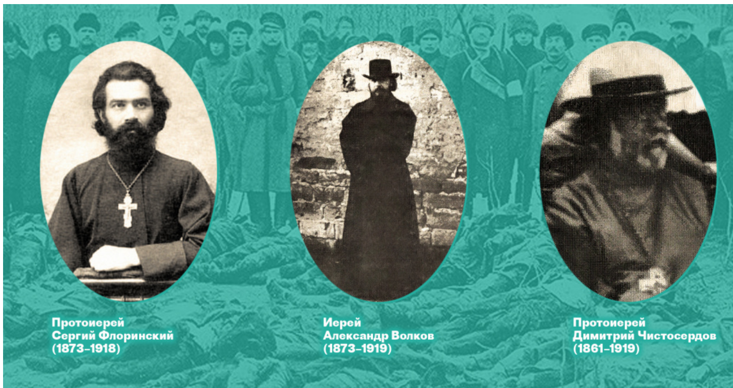
Протоиерей Сергий Флоринский (1873–1918)