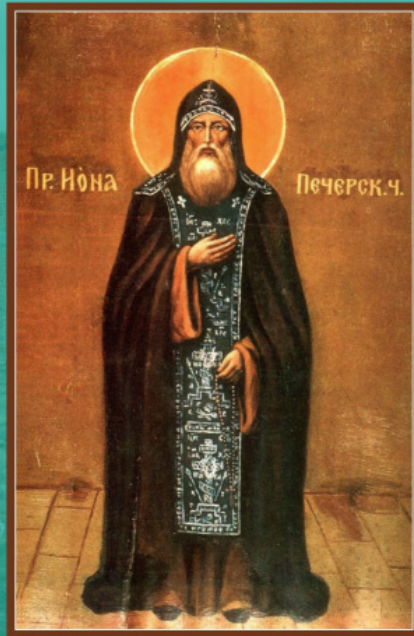
Преподобный Иона Псково-Печерский