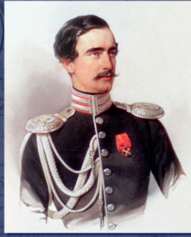
Граф Григорий Александрович Строганов. Акварель В. И. Гау, 1847 г.