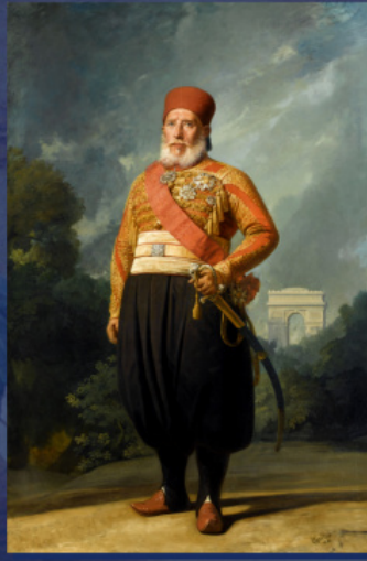
Ибрагим-паша. Шарль-Филипп Огюст Ларивьер, 1846 г.