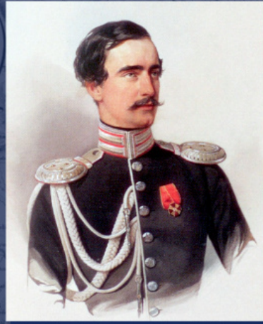
Граф Григорий Александрович Строганов. Акварель В. И. Гау, 1847 г.