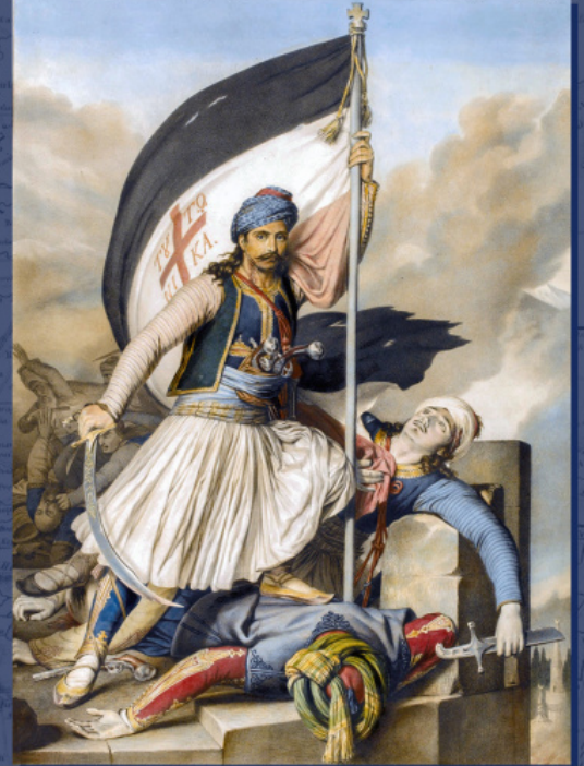
Взятие Салона (Амфисса). Луи Дюпре, 1821 г.

Это совершенно не так. Весной – летом 1821 года российский посланник при султанском дворе граф Г.А. Строганов бомбардировал Высокую Порту (султанское правительство) нотами протеста против репрессий и погромов в отношении греков. В конце концов российская миссия покинула османскую столицу и дипломатические отношения между двумя странами были разорваны.