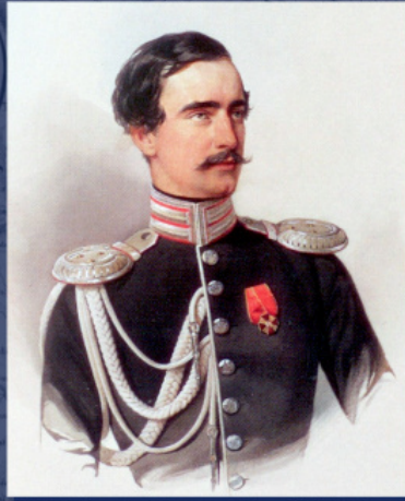
Граф Григорий Александрович Строганов. Акварель В. И. Гау, 1847 г.