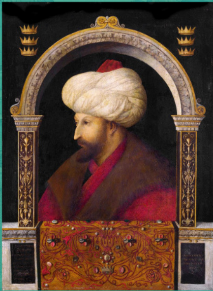
Джентиле Беллини. Портрет Султана Мехмеда II. 1480 г., Национальная Галерея, Лондон