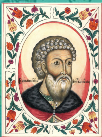
Иван III Васильевич. Портрет из «Царского титулярника», XVII в.

В 1472 году великий князь Московский Иван III Васильевич вступил в брак с Софией (Зоей), племянницей последнего византийского императора Константина Палеолога. А вскоре, в 1480 году, Московская Русь окончательно освободилась от ордынской дани, и с 1493 года Иван III стал титуловаться государем всея Руси. Страшивший многих 7000-й год благополучно миновал, и начало нового тысячелетия от сотворения мира стало эпохой бурного роста новой православной державы — Русского государства.