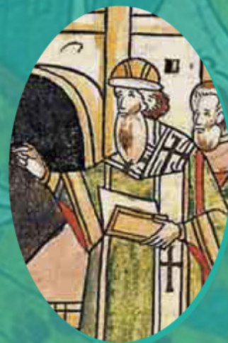
Митрополит Зосима. Фрагмент миниатюры. Лицевой летописный свод. Книга 17, стр. 140

Спиридон-Савва, автор «Послания о Мономаховых дарах» (ок. 1503 г.), вкладывает в уста