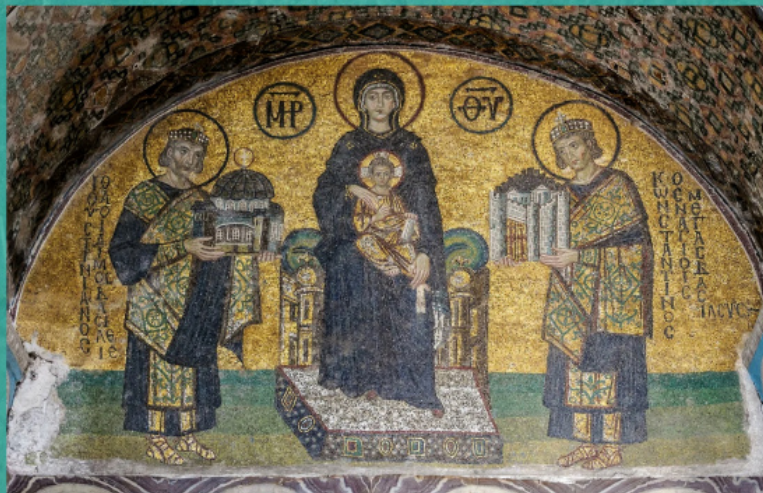
Императоры Константин (справа) и Юстиниан (слева) перед Богородицей. Мозаика, Собор Святой Софии (середина X в.)