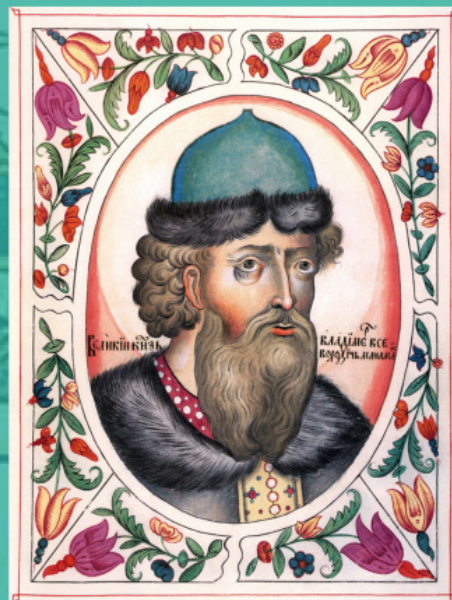
Владимир Всеволодович Мономах. Портрет из «Царского титулярника», XVII в.

Характерно, что император здесь вовсе не уступает своего титула и центрального места как покровителя всего православного мира, но как бы присоединяет к своему служению русского князя — признаваемого «вольным и самодержавным» царем Великой России. Именно этот титул и «восстановит» в 1547 году Иван Васильевич Грозный во время своего знаменитого венчания на царство.