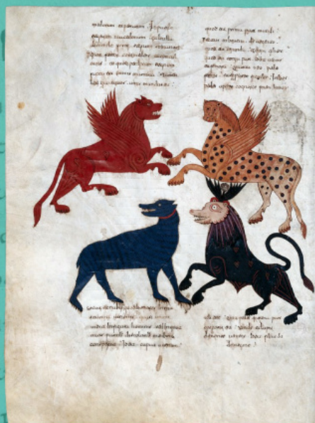
Звери из видения пророка Даниила. Беат Либанский. Кодекс Фернандо I и Доньи Санчи, 1047 г.