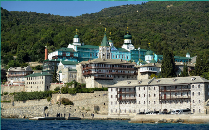
Монастырь Святого Пантелеимона на Афоне

Русской Православной Церкви, в которых был бы выражен хотя бы намек на желание подчинить себе другие братские автокефальные Церкви и возвыситься над ними. На этот факт, как и на неактуальность идеи «Москва — Третий Рим» для современной церковно-политической ситуации неоднократно указывали председатели Отдела внешних церковных связей Московского Патриархата — как митрополит Кирилл (ныне Патриарх Московский и всея Руси), так и митрополит Иларион. (см. письмо Мелитону, митр. Филадельфийскому, от 23.12.2004 г., интервью от 13.07.2019; интервью от 04.12.2020; интервью от 13.12.2020 ).