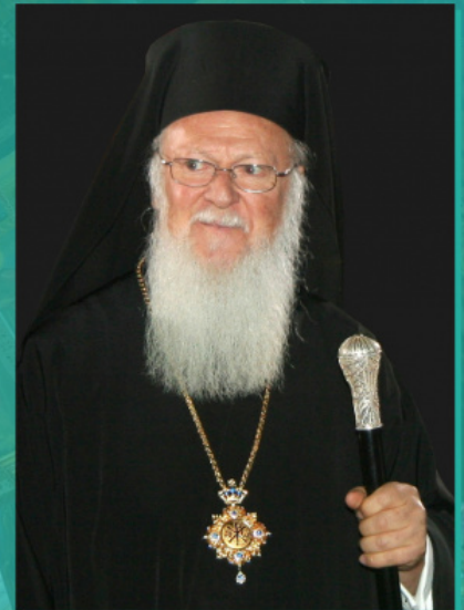
Патриарх Варфоломей I

Мираж «славянской угрозы» оказался настолько сильным, что даже повлиял на отказ греческих ученых использовать историческое название «Русик» (Ῥωσικόν) для афонского монастыря Св. Пантелеимона. А в своем нынешнем деструктивном противостоянии Московскому Патриархату из-за Украины Константинопольский патриарх Варфоломей и его единомышленники стремятся разыграть карту «эллинской солидарности», настойчиво призывая греческих иерархов других Поместных Церквей принять явно неканоничную сторону.