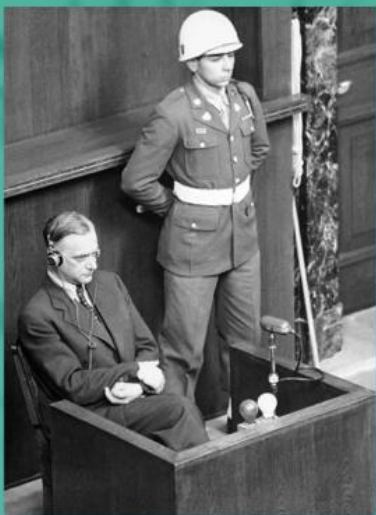
Альфред Розенберг на Нюрнбергском процессе