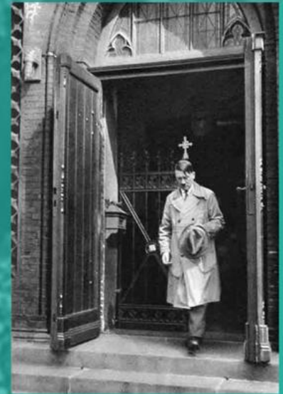
Гитлер выходит из церкви, 1931 г.

После начала весной 1941 года военной агрессии рейха на Балканах, а в июне – против СССР прежняя политика претерпела сильные изменения (первые признаки этих изменений были заметны уже в Польском генерал-губернаторстве в 1939-1940 годах). Возобладало враждебное отношение к Русской Православной Церкви. На нее были распространены и даже значительно усилены методы давления, уже опробованные по отношению к другим конфессиям на территории самой Германии, где направляющая линия в решении «религиозного вопроса» была ориентирована на разрушение (внутреннее и внешнее) сложившихся традиционных устойчивых структур, «атомизацию» Церквей. Русскую Церковь также пытались раздробить на несколько не сообщающихся между собой частей (главным образом по национальному признаку), эти части поставить под полный контроль и при этом стремились использовать церковные организации для помощи администрации на оккупированных территориях и в пропагандистских целях. С этим было связано и изменение отношения к русскому духовенству в эмиграции – его старались полностью изолировать от событий в России и от пленных или вывезенных в Германию на работы соотечественников.