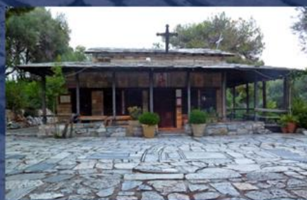
Церковь Святого Димитриса Лумбардиариса в Афинах, 1951 г.

Православие стало для Пикиониса главным источником вдохновения. Несмотря на то что семья и работа отнимали много времени, он посвящал Богу все свободное время. Ночи великий архитектор проводил в изучении «Добротолубия», писаний святых отцов и молитве. «Пикионис был новым Иоанном Лествичником, смиренным отшельником и мыслителем, воплощавшим свои духовные прозрения в архитектурные формы», – писал о нем один из современников.