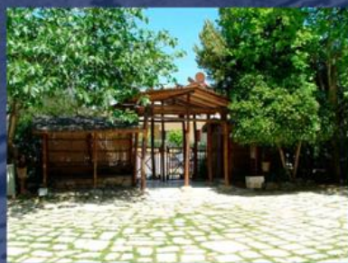
Детская площадка в Филофее — сочетание греческой и восточной традиции, 1961-1964 гг.