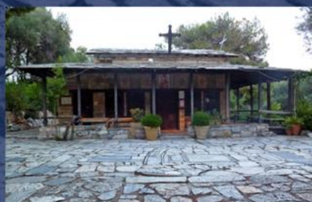
Церковь Святого Димитриса Лумбардиариса в Афинах, 1951 г.

Православие стало для Пикиониса главным источником вдохновения. Несмотря на то что семья и работа отнимали много времени, он посвящал Богу все свободное время. Ночи великий архитектор проводил в изучении «Добротолубия», писаний святых отцов и молитве. «Пикионис был новым Иоанном Лествичником, смиренным отшельником и мыслителем, воплощавшим свои духовные прозрения в архитектурные формы», – писал о нем один из современников.