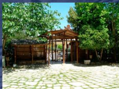
Детская площадка в Филофее — сочетание греческой и восточной традиции, 1961-1964 гг.