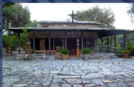
Церковь Святого Димитриса Лумбардиариса в Афинах, 1951 г.

Православие стало для Пикиониса главным источником вдохновения. Несмотря на то что семья и работа отнимали много времени, он посвящал Богу все свободное время. Ночи великий архитектор проводил в изучении «Добротолубия», писаний святых отцов и молитве. «Пикионис был новым Иоанном Лествичником, смиренным отшельником и мыслителем, воплощавшим свои духовные прозрения в архитектурные формы», – писал о нем один из современников.