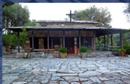
Церковь Святого Димитриса Лумбардиариса в Афинах, 1951 г.

Православие стало для Пикиониса главным источником вдохновения. Несмотря на то что семья и работа отнимали много времени, он посвящал Богу все свободное время. Ночи великий архитектор проводил в изучении «Добротолубия», писаний святых отцов и молитве. «Пикионис был новым Иоанном Лествичником, смиренным отшельником и мыслителем, воплощавшим свои духовные прозрения в архитектурные формы», – писал о нем один из современников.