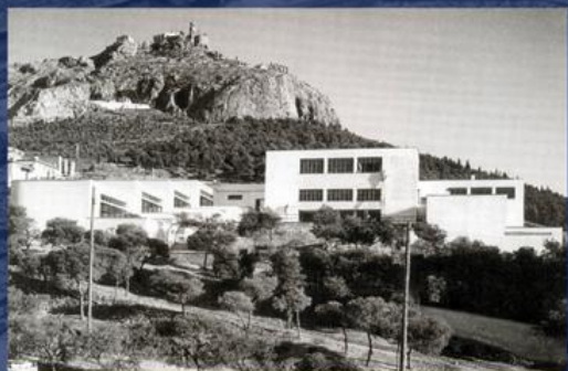
Начальная школа в Пейфаккии, Ликавит, 1932 г.

Искусство Пикиониса было самобытным и новаторским. Он вдохновлялся византийским и древнегреческим искусством, архитектурными школами народов мира. Но при этом избегал подражания, найдя собственный уникальный стиль.