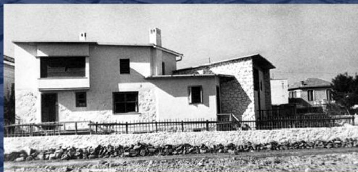
Дом-студия скульптора Фроссо Эфtimiади-Менегаки, Афины, 1949 г.