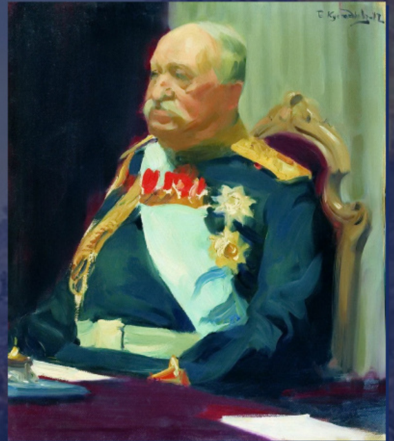
Contele N. P. Ignatiev. B. M. Kustodiev, 1902

În același timp, este caracteristic faptul că Patriarhii Constantinopolului au condamnat cu tărie și fără echivoc încercările Romei papale de a-și justifica supremația asupra celorlalte Biserici. Epistola Patriarhală și Sinodală din 1895 prevede în mod direct următoarele: „Fiecare dintre Bisericile Autocefale din Răsărit și de la Apus a fost pe deplin independentă și autonomă în perioada celor șapte Sinoade Ecumenice. Atât episcopii Bisericilor autocefale din Răsărit, cât și episcopii din Africa, Spania, Galia, Germania și Marea Britanie și-au condus Bisericile prin propriile sinoade locale; episcopul Romei, care era el însuși obligat să se supună deciziilor sinodale, nu avea niciun drept de intervenție. Iar atunci când au apărut probleme importante care necesitau soluționarea din partea întregii Biserici, se convoca un Sinod Ecumenic, care singur a fost întotdeauna și rămâne cea mai înaltă autoritate din Biserică. Aceasta este vechea organizare a Bisericii” [17].