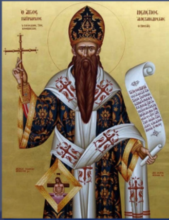
Patriarhul Meletie I al Alexandriei (1549-1601)