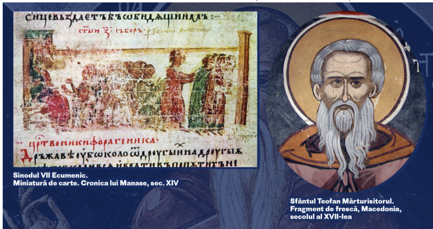
Sinodul VII Ecumenic. Miniatură de carte. Cronica lui Manase, sec. XIV

Este caracteristic faptul că în secolul al IX-lea, la întrebarea directă despre semnificația titlului „Ecumenic”, pusă de trimisul papal la Constantinopol Anastasie Bibliotecarul, i s-a răspuns că Patriarhul este numit ecumenic (oekumenicus, universalis) nu pentru că ar fi episcop peste toată lumea, ci pentru că are puterea de stăpânire asupra uneia dintre părțile lumii locuite de creștini [10].