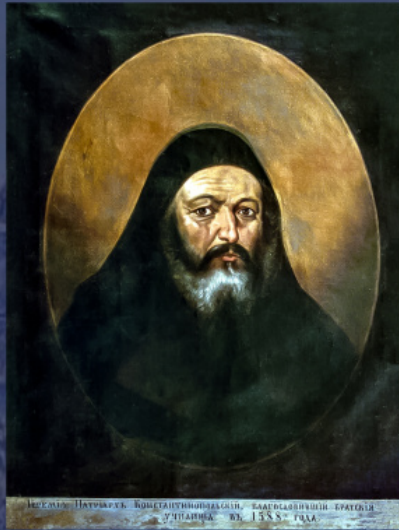
Patriarhul Ieremia al II-lea Tranos al Constantinopolului