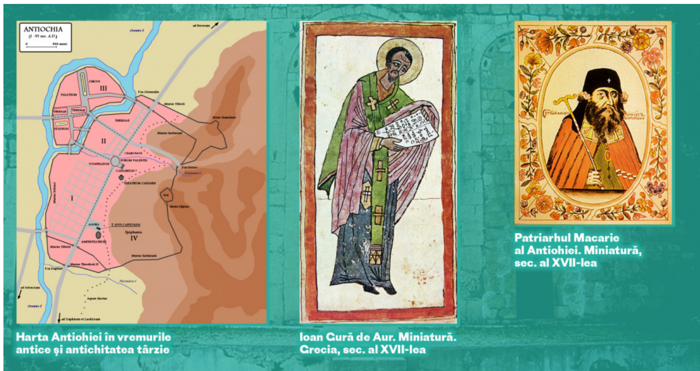
Harta Antiohiei în vremurile antice și antichitatea târzie