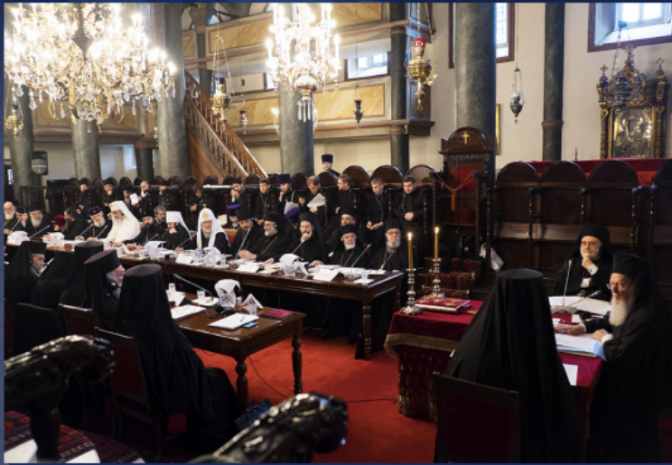
Sinaxa întâistătorilor și reprezentanților Bisericii Ortodoxe Locale. Istanbul, Turcia, 6-9 martie 2014