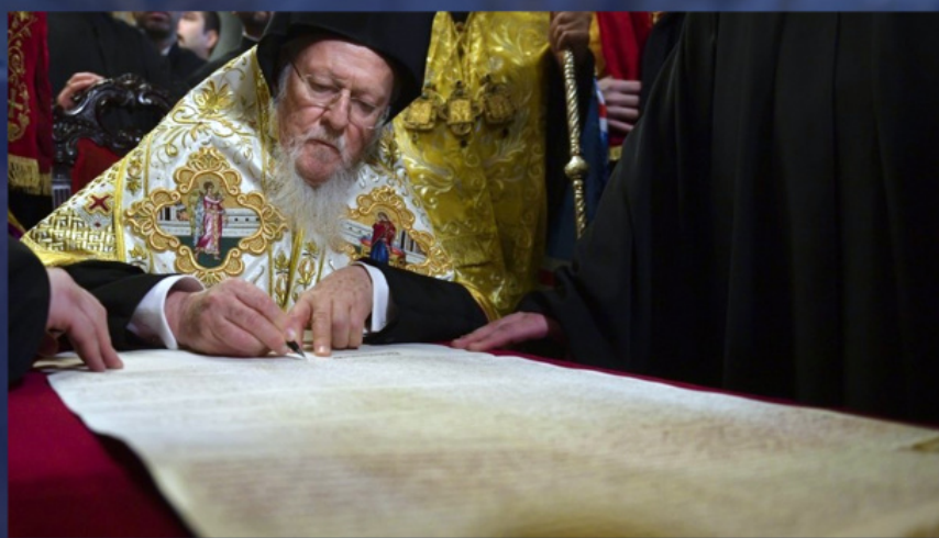
Patriarhul Bartolomeu semnează Tomosul de autocefalie a Bisericii Ortodoxe din Ucraina

De fapt, Constantinopolul se declară capul tuturor Bisericilor Locale, lucru care este afirmat direct în Tomosul așa-numitei „Biserici” din Ucraina: „Biserica Autocefală din Ucraina cunoaște drept cap al ei Preasfântul Tron Ecumenic Apostolic și Patriarhal, după cum fac și ceilalți Patriarhi și Întâistătători”.