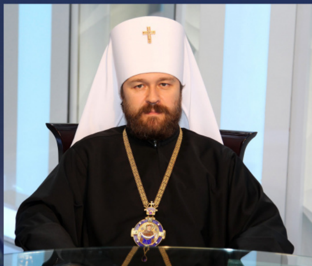
Mitropolitul Ilarion, participant la întrunirile Comisiei interortodoxe pentru pregătirea Sfântului și Marelui Sinod din 10-16 decembrie 2009 și 22-26 februarie 2011 la Chambesy

Însă dezvoltarea câștigului obținut nu a reușit. Timp de șase ani, Patriarhia Constantinopolului, care a prezidat Comisia pregătitoare interortodoxă, nu a convocat nicio ședință a acesteia din urmă. În 1999 a făcut o astfel de încercare, dar aceasta a eșuat din cauza crizei bisericești estone care a izbucnit cu trei ani mai devreme. Patriarhia Constantinopolului a solicitat ca așa-numita Biserică Apostolică Ortodoxă Estoniană, înființată pe teritoriul canonic al Bisericii Ortodoxe Ruse ca o structură autonomă a Patriarhiei Constantinopolului, să participe la ședințe pe picior de egalitate cu Bisericile Locale recunoscute de toți. Bineînțeles, Biserica Ortodoxă Rusă nu putea fi de acord cu o astfel de abordare.