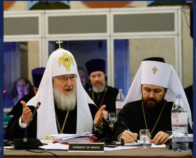
Sanctitatea Sa Chiril, Patriarhul Moscovei și al Întregii Rusii, și Mitropolitul Ilarion la Sinaxa Întâistătorilor Bisericii Ortodoxe Locale. Chambesey, Elveția, 22-27 ianuarie 2016

La Sinaxa Întâistătorilor din 2014 s-a decis ca subiectul autocefaliei să fie discutat din nou în cadrul Comisiei pregătitoare spre a fi prezentat la Sinodul Panortodox. Dar examinarea sa nu a avut loc sub pretextul formal al lipsei de timp. Cu toate acestea, în 2015, Întâistătorii Bisericii Ortodoxe Georgiană, Sârbă și Bulgară, în corespondența lor cu Patriarhul Bartolomeu, au susținut introducerea subiectului autocefaliei pe ordinea de zi a Sfântului și Marelui Sinod.