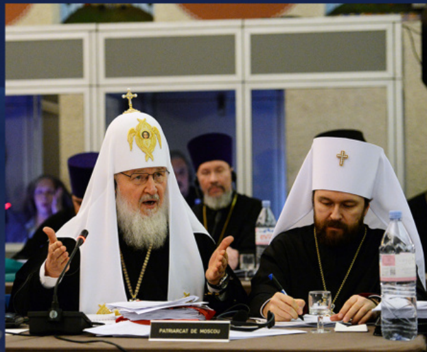
Sanctitatea Sa Chiril, Patriarhul Moscovei și al Întregii Rusii, și Mitropolitul Ilarion la Sinaxa Întâistătătorilor Bisericii Ortodoxe Locale. Chambesey, Elveția, 22-27 ianuarie 2016

La Sinaxa Întâistătătorilor din 2014 s-a decis ca subiectul autocefaliei să fie discutat din nou în cadrul Comisiei pregătitoare spre a fi prezentat la Sinodul Panortodox. Dar examinarea sa nu a avut loc sub pretextul formal al lipsei de timp. Cu toate acestea, în 2015, Întâistătătorii Bisericii Ortodoxe Georgiană, Sârbă și Bulgară, în corespondența lor cu Patriarhul Bartolomeu, au susținut introducerea subiectului autocefaliei pe ordinea de zi a Sfântului și Marelui Sinod.