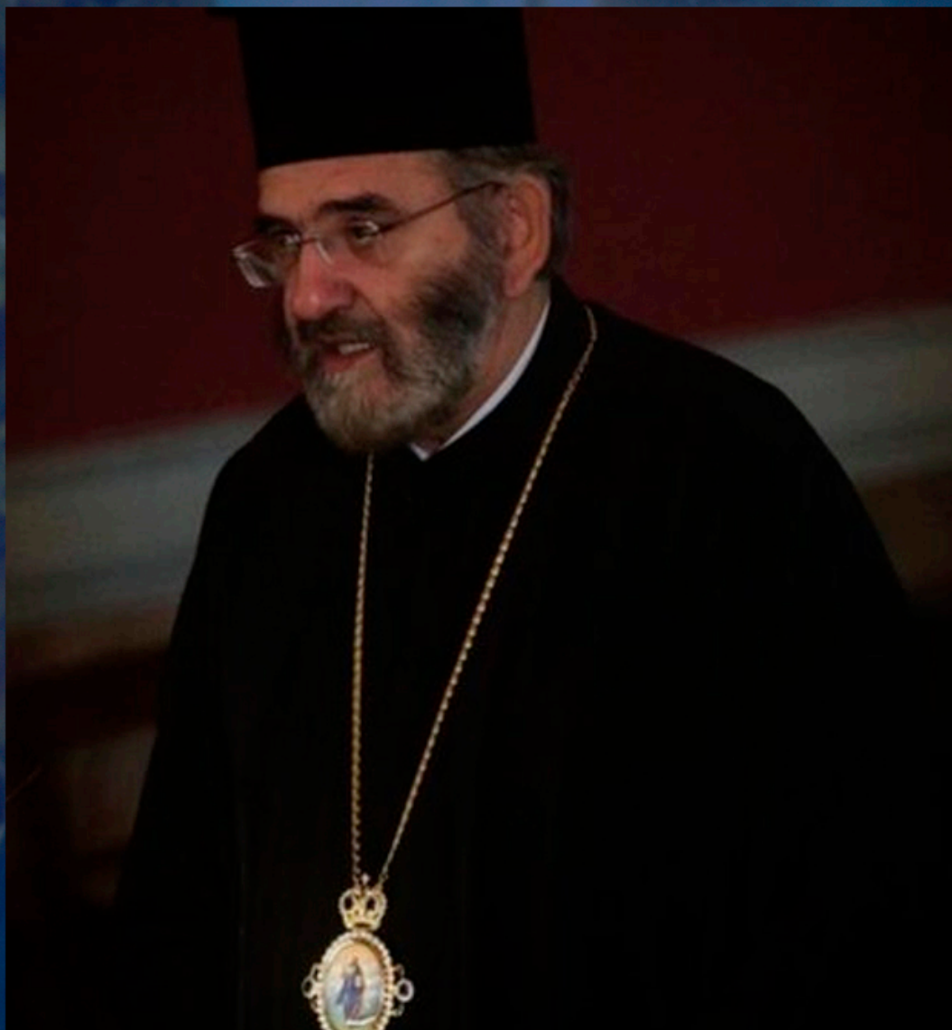
Episcopul Chiril de Abydos

Bazându-se pe o interpretare particulară și liberă a canoanelor, Fanarul a încercat să-și justifice „privilegiul unic de a primi apeluri de la ierarhii și clericii” tuturor Bisericilor Locale. Cu timpul, și-a revendicat pretențiile de a controla întreaga diaspora ortodoxă.