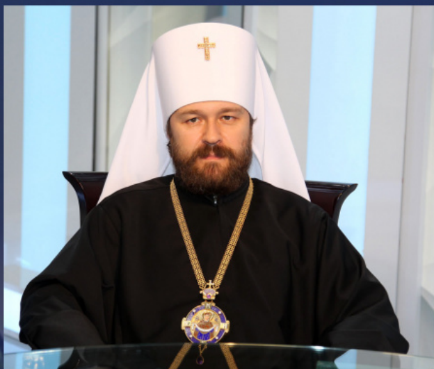
Mitropolitul Ilarion, participant la întrunirile Comisiei interortodoxe pentru pregătirea Sfântului și Marelui Sinod din 10-16 decembrie 2009 și 22-26 februarie 2011 la Chambesy

Însă dezvoltarea câștigului obținut nu a reușit. Timp de șase ani, Patriarhia Constantinopolului, care a prezidat Comisia pregătitoare interortodoxă, nu a convocat nicio ședință a acesteia din urmă. În 1999 a făcut o astfel de încercare, dar aceasta a eșuat din cauza crizei bisericești estone care a izbucnit cu trei ani mai devreme. Patriarhia Constantinopolului a solicitat ca așa-numita Biserică Apostolică Ortodoxă Estoniană, înființată pe teritoriul canonic al Bisericii Ortodoxe Ruse ca o structură autonomă a Patriarhiei Constantinopolului, să participe la ședințe pe picior de egalitate cu Bisericile Locale recunoscute de toți. Bineînțeles, Biserica Ortodoxă Rusă nu putea fi de acord cu o astfel de abordare.