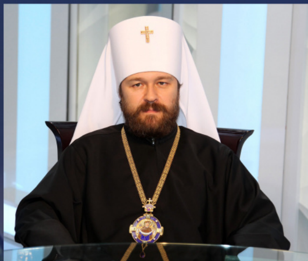
Mitropolitul Ilarion, participant la întrunirile Comisiei interortodoxe pentru pregătirea Sfântului și Marelui Sinod din 10-16 decembrie 2009 și 22-26 februarie 2011 la Chambesy

Însă dezvoltarea câștigului obținut nu a reușit. Timp de șase ani, Patriarhia Constantinopolului, care a prezidat Comisia pregătitoare interortodoxă, nu a convocat nicio ședință a acesteia din urmă. În 1999 a făcut o astfel de încercare, dar aceasta a eșuat din cauza crizei bisericești estone care a izbucnit cu trei ani mai devreme. Patriarhia Constantinopolului a solicitat ca așa-numita Biserică Apostolică Ortodoxă Estoniană, înființată pe teritoriul canonic al Bisericii Ortodoxe Ruse ca o structură autonomă a Patriarhiei Constantinopolului, să participe la ședințe pe picior de egalitate cu Bisericile Locale recunoscute de toți. Bineînțeles, Biserica Ortodoxă Rusă nu putea fi de acord cu o astfel de abordare.