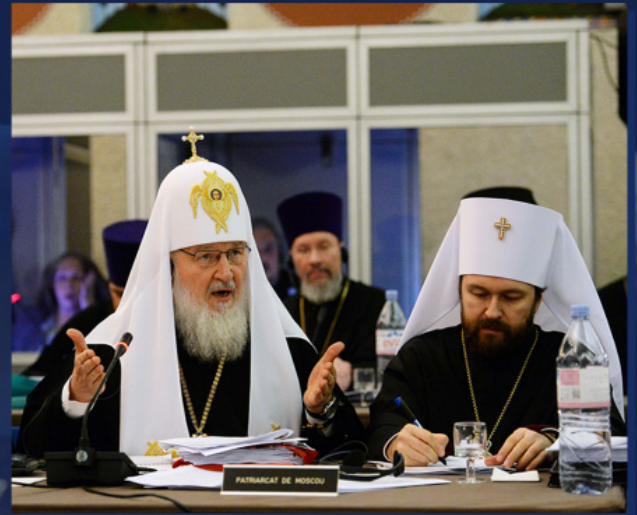
Sanctitatea Sa Chiril, Patriarhul Moscovei și al Întregii Rusii, și Mitropolitul Ilarion la Sinaxa Întâistătătorilor Bisericii Ortodoxe Locale. Chambesey, Elveția, 22-27 ianuarie 2016

La Sinaxa Întâistătătorilor din 2014 s-a decis ca subiectul autocefaliei să fie discutat din nou în cadrul Comisiei pregătitoare spre a fi prezentat la Sinodul Panortodox. Dar examinarea sa nu a avut loc sub pretextul formal al lipsei de timp. Cu toate acestea, în 2015, Întâistătătorii Bisericii Ortodoxe Georgiană, Sârbă și Bulgară, în corespondența lor cu Patriarhul Bartolomeu, au susținut introducerea subiectului autocefaliei pe ordinea de zi a Sfântului și Marelui Sinod.