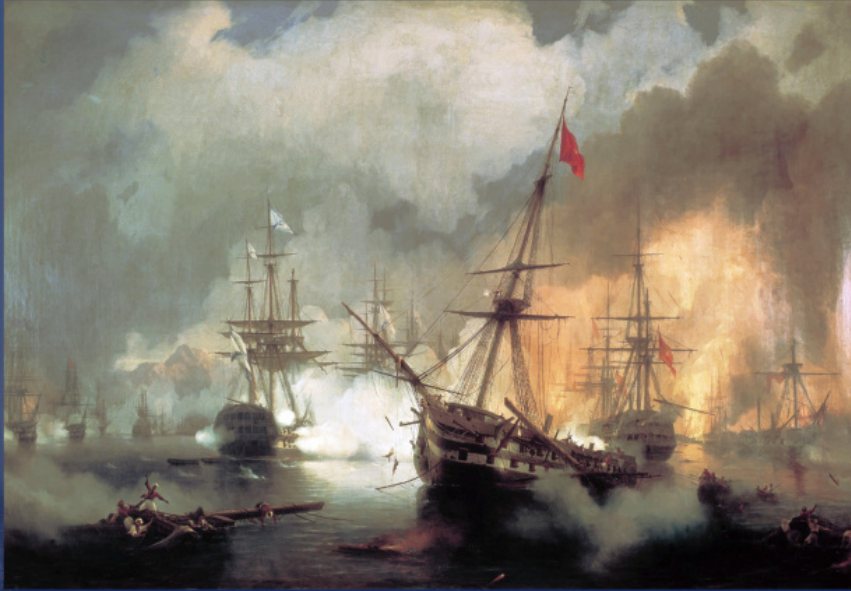
Bătălia de la Navarino. I. K. Aivazovsky, 1846 (lupta)/1848 – pictat