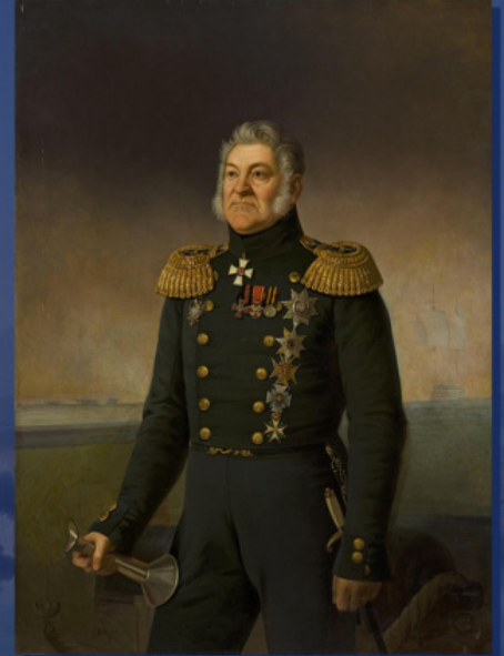
Portretul amiralului Loghin Petrovici Heiden. E. I. Botman, 1877

Și această minune s-a întâmplat. În martie 1827, Rusia a propus Marii Britanii și Franței să încheie o convenție privind problema greacă pentru a-l obliga pe sultan să facă concesii și să acorde autonomie grecilor. Conform acestei convenții, semnată la 24 iunie (6 iulie) 1827, cele trei puteri au devenit mediatori în rezolvarea conflictului greco-turc. Pentru a forța ambele părți să respecte armistițiul în timpul negocierilor, o escadrilă unită a celor trei puteri a fost trimisă în zona acțiunilor militare. La 8 (20) octombrie 1827, această escadrilă din Golful Navarino a distrus flota turco-egipteană staționată acolo. Cel mai mare succes în acțiunile sale l-a avut partea rusă a escadrilei sub comanda contraamiralului L.P. Heiden. Această bătălie, în amintirea căreia se desfășoară anual evenimente solemne în Navarino, a schimbat radical echilibrul puterii dintre state. Cu toate acestea, Înalta Poartă tot încă nu dorea să audă despre independență sau măcar autonomie pentru greci. După cum este arătat pe bună dreptate în manualul de istorie pentru elevii greci din clasa a VI-a, doar „înfrângerea Imperiului Otoman în războiul ruso-turc din anii 1828–1829, l-a obligat pe sultan să înceapă negocierile”.