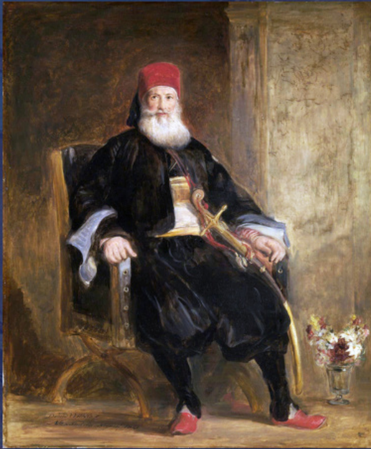
Muhammad Ali al Egiptului. David Wilkie, 1841