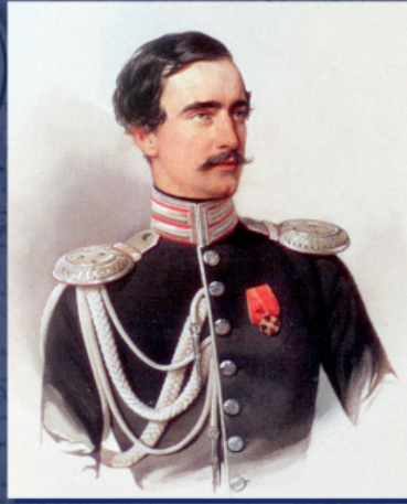
Contele Grigory Alexandrovici Stroganov. Acuarelă, V.I. Hau, 1847