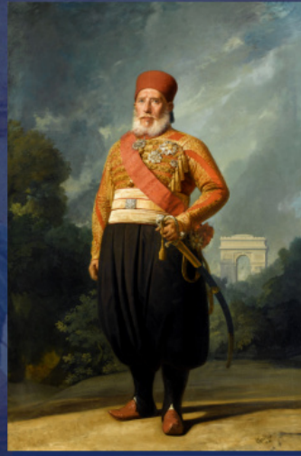
Ibrahim Paşa. Charles-Philippe Larivière, 1846