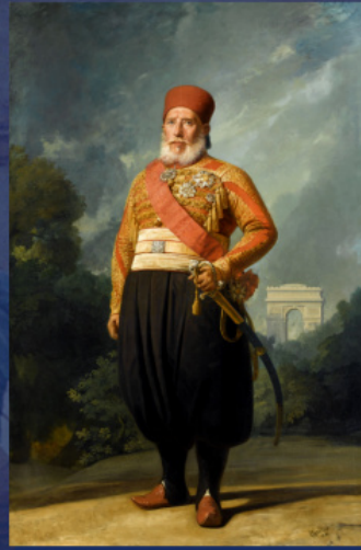
Ibrahim Paşa. Charles-Philippe Larivière, 1846