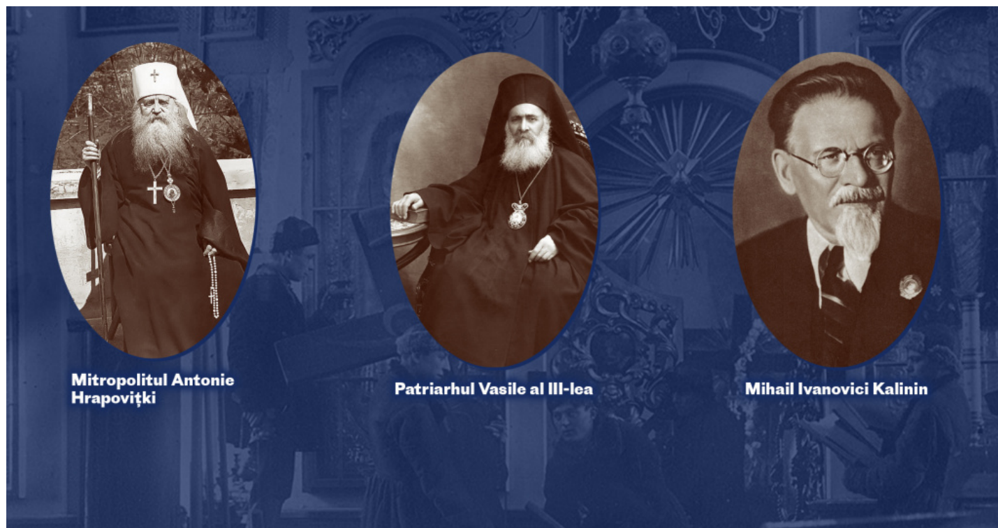
Mitropolitul Antonie Hrapovițki

recunoscut sinodul rus (al renovaționiștilor) ca fiind conducătorul oficial al Bisericii Ortodoxe Ruse și a interzis să officieze slujbe acelor ierarhi care fugiseră din Rusia în străinătate, în frunte cu Antonie Hrapovițky. Toți acești ierarhi sunt deferiți instanței bisericești de judecată”.