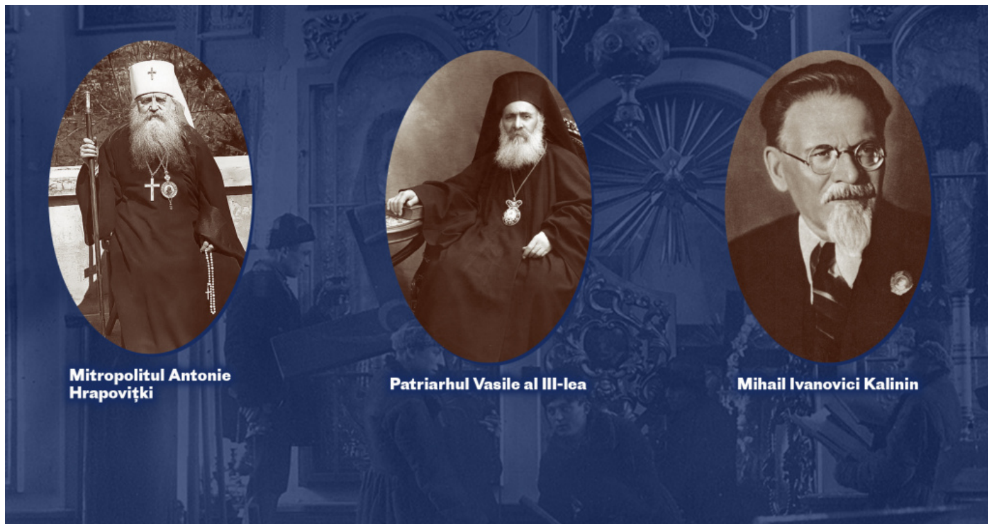
Mitropolitul Antonie Hrapovițki

recunoscut sinodul rus (al renovaționiștilor) ca fiind conducătorul oficial al Bisericii Ortodoxe Ruse și a interzis să officieze slujbe acelor ierarhi care fugiseră din Rusia în străinătate, în frunte cu Antonie Hrapovițky. Toți acești ierarhi sunt deferiți instanței bisericești de judecată”.