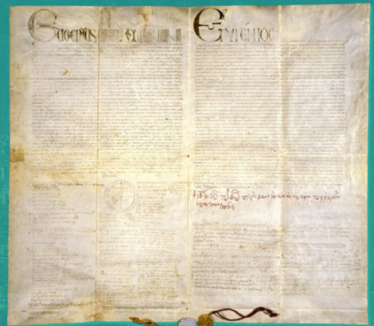
Η Ουνία της Φλωρεντίας του 1439

Ο σουλτάνος Μεχμέτ Β΄ απονέμει στον Πατριάρχη Γεννάδιο φερμάνι που επιβεβαιώνει τα πατριαρχικά προνόμια