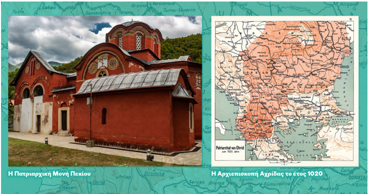
Η Πατριαρχική Μονή Πεκίου

συγκεκριμένη γλώσσα («μήτηρ Εκκλησία», «θυγατέρα Εκκλησία»). Επομένως, αυτή η πανελληνική ταυτότητα του Φαναρίου σημαίνει ότι έχουμε ιστορικά ήδη διαπιστώσει τα παραδείγματα αντισλαβικών διαθέσεων και ενεργειών, γι' αυτό και δεν θα εκπλαγούμε, εάν τις αντικρύσουμε εκ νέου.