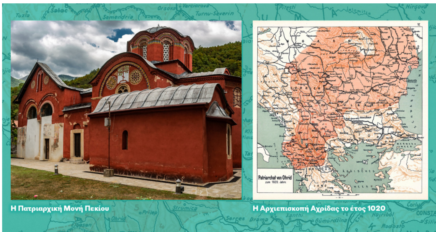
Η Πατριαρχική Μονή Πεκιού

συγκεκριμένη γλώσσα («μήτηρ Εκκλησία», «θυγατέρα Εκκλησία»). Επομένως, αυτή η πανελληνική ταυτότητα του Φαναρίου σημαίνει ότι έχουμε ιστορικά ήδη διαπιστώσει τα παραδείγματα αντισλαβικών διαθέσεων και ενεργειών, γι' αυτό και δεν θα εκπλαγούμε, εάν τις αντικρύσουμε εκ νέου.