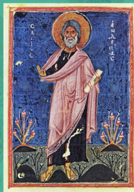
Ο άγιος Απόστολος Ανδρέας ο Πρωτόκλητος. Μικρογραφία. Βυζάντιο, 12 αι.

Εάν η απάντηση σε αυτή την ερώτηση είναι, ας πούμε, απλώς αρνητική, εάν εννοούμε τον Νεστόριο ή τον Πύρρο, πώς τότε το σημερινό Φανάρι βλέπει, λ.χ., τους Πατριάρχες, οι οποίοι κατείχαν τον θρόνο Κωνσταντινουπόλεως την περίοδο μεταξύ της Συνόδου Φερράρας-Φλωρεντίας το 1439 και την Άλωση της Πόλεως το 1453; Μια ενδιαφέρουσα ιστορική προοπτική μάς προτείνει το ακόλουθο γεγονός: παρόλο που ο Πατριάρχης Γεννάδιος Σχολάριος μετά την Άλωση της Πόλεως διέκοψε οριστικά την ενωτική πολιτική των προκατόχων του, ο ίδιος ο θρόνος δεν αναγνώρισε ως νόμιμη την απόφαση της Ρωσικής Εκκλησίας της Μόσχας να απομακρυνθεί από την πλανημένη ιεραρχία κατά την ενωτική διοίκηση της Κωνσταντινουπόλεως. Είναι οι σημερινοί Πατριάρχες Κωνσταντινουπόλεως κληρονόμοι άραγε εκείνων, οι οποίοι πέθαναν σε ενότητα με τη Ρώμη; Στην πραγματικότητα, ίσως η σημερινή εκκλησιαστική-πολιτική γραμμή του Φαναρίου να συμμορφώνεται