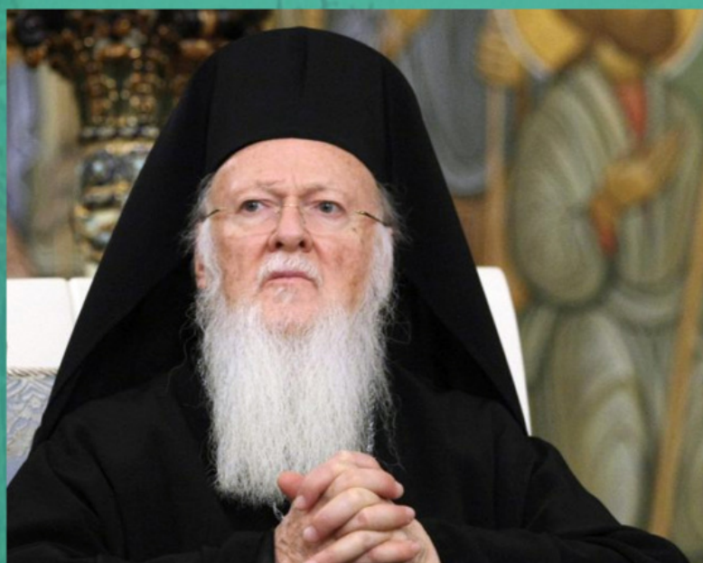
Πατριάρχης Βαρθολομαίος Α΄

Πώς παρουσιάζεται σήμερα η Κωνσταντινούπολη; Βεβαίως, οι φίλοι και οι γνωστοί μου, τους οποίους ενδιαφέρουν ακόμη οι γνώμες και οι ενέργειες του Πατριάρχη Βαρθολομαίου και άλλων Φαναριωτών αξιωματούχων, θα προτιμήσουν να υποδείξουν εκείνη την εικόνα, με την οποία και σήμερα το Φανάρι παρουσιάζεται από τους άλλους συνηθέστερα. Είναι η ιστορία για τον αρχαίο θρόνο του Αγίου Αποστόλου Ανδρέα, μιας τοπικής Εκκλησίας, η οποία μοιάζει να υφίσταται αδιαλείπτως εδώ και δύο χιλιετίες. Καθένας φυσικά, ακόμη και κάποιος με ελάχιστες γνώσεις της εκκλησιαστικής ιστορίας της Ορθόδοξου Εκκλησίας, θα μπορούσε με αφορμή αυτή τη θέση να αναρωτηθεί πολύ εύλογα: ουδέποτε δεν κατέστη πλήρως κατανοητό πώς ο θρόνος της Κωνσταντινουπόλεως αντιμετωπίζει τις εξαιρετικά σκοτεινές σελίδες της ίδιας της ιστορίας, τις περιόδους, που στον θρόνο του Πατριάρχη Βαρθολομαίου κάθονταν αιρεσιάρχες;