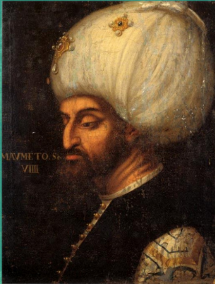
Προσωπογραφία του σουλτάνου Μεχμέτ Β'. Έργο του Πάολο Βερονέζε, 1579.

Γιάτσε διοργάνωσε την πρώτη εδαφική μονάδα του μελλοντικού στρατιωτικού συνόρου, δηλαδή την καπιτανία Σεν. Ακριβώς τότε εμφανίσθηκε το τοπωνύμιο «Κράινα» («Άκρη»), που υποδήλωνε τα ακριτικά κομμάτια κατά μήκος των ουγγρο-τουρκικών συνόρων, που ακολουθούσαν την κοίτη του ποταμού Ούνα.