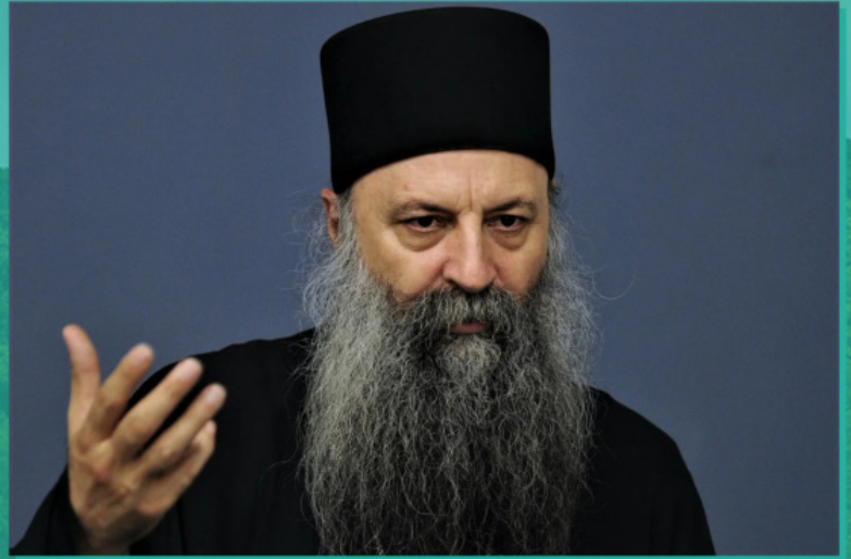
Ο Πατριάρχη Σερβίας Πορφύριος

Το 2014 η Ιερά Σύνοδος της Ιεραρχίας της Ορθοδόξου Εκκλησίας της Σερβίας εξέλεξε τον βοηθό επίσκοπο της εκκλησιαστικής επαρχίας Μπάτσκα Πορφύριο μητροπολίτη Ζάγκρεμπ και Λιουμπλιάνας. Η ενθρόνιση τελέσθηκε από τον Πατριάρχη Σερβίας Ειρηναίο παρουσία πολλών ιεραρχών της Εκκλησίας της Σερβίας στις 13 Ιουνίου 2014 στον καθεδρικό ναό Μεταμορφώσεως του Κυρίου στο Ζάγκρεμπ. Σε αυτή τη θέση ο μητροπολίτης Πορφύριος απέκτησε ευρεία δημοτικότητα χάριν της κοινωνικής και ειρηνευτικής του δράσεως, που απέβλεπαν στην εδραίωση της παρουσίας της ορθοδοξίας στην περιοχή. Επί μητροπολίτου Πορφυρίου ολοκληρώθηκαν επίσης τα έργα ανακαινίσεως της ιεράς μονής Λεπάβιν, του παλαιότερου πνευματικού κέντρου των ορθοδόξων Σέρβων στην Κροατία.