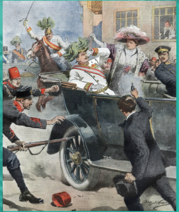
Η δολοφονία του Αρχιδούκα Φραγκίσκου Φερδινάνδου και της συζύγου του. Εικονογράφηση του Αχίλλε Μπελτράμε, 1914.

Οι σχέσεις μεταξύ των Σέρβων και των Κροατών παρέμειναν άκρως τεταμένες καθ' όλη τη διάρκεια υπάρξεως του Βασιλείου των Σέρβων, Κροατών και Σλοβένων και στη συνέχεια της Γιουγκοσλαβίας (από το 1929), διότι το νέο κράτος είχε ενιαίο χαρακτήρα, πράγμα που δεν ικανοποιούσε τον κροατικό πληθυσμό. Ενεργό επίσης ρόλο στο διεθνικό μίσος διαδραμάτιζε το Βατικανό, το οποίο διεξήγαγε τη λεγόμενη «Καθολική Κινητοποίηση» με σκοπό την προσέλκυση της νεολαίας σε ποικίλες θρησκευτικές οργανώσεις («Αετοί», «Σταυροφόροι») και συνέχιζε την πολιτική εκλατινισμού των Σέρβων και των Βοσνίων.