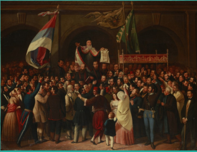
Η ανακήρυξη του Κυβερνείου της Σερβίας το 1848. Έργο του Πάβλε Σίμιτς, 1848-1849.