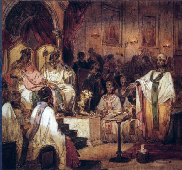
Η Δ΄ Οικουμενική Σύνοδος της Χαλκηδόνος. Έργο του Β. Σούρικοφ, 1876.