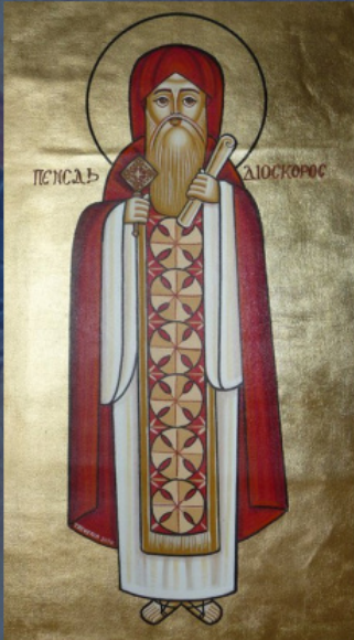
Ο Διόσκορος Αλεξανδρείας. Κοπτική εικόνα.

Εφέσου του έτους 449. Ο επίσκοπος Ολύμπιος Ευάζων στην ομιλία του προσφωνούσε τον αρχηγό αυτής της σκανδαλώδους ψευδοσυνόδου Διόσκορο Αλεξανδρείας ως «αγιώτατε πατέρα ήμών και οικουμενικέ πατριάρχα τής μεγάλης πόλεως τών Άλεξανδρέων» [4]. Μετά από δύο χρόνια, στη Σύνοδο της Χαλκηδόνος, οι λεγάτοι του Πάπα Λέοντος του Μεγάλου υπέγραφαν εξ ονόματος του «κυρίου ήμών, μακαριωτάτου αποστολικού άνδρòς τής οικουμενικής έκκλησίας και έπισκόπου τής πόλεως Ρώμης» [5].