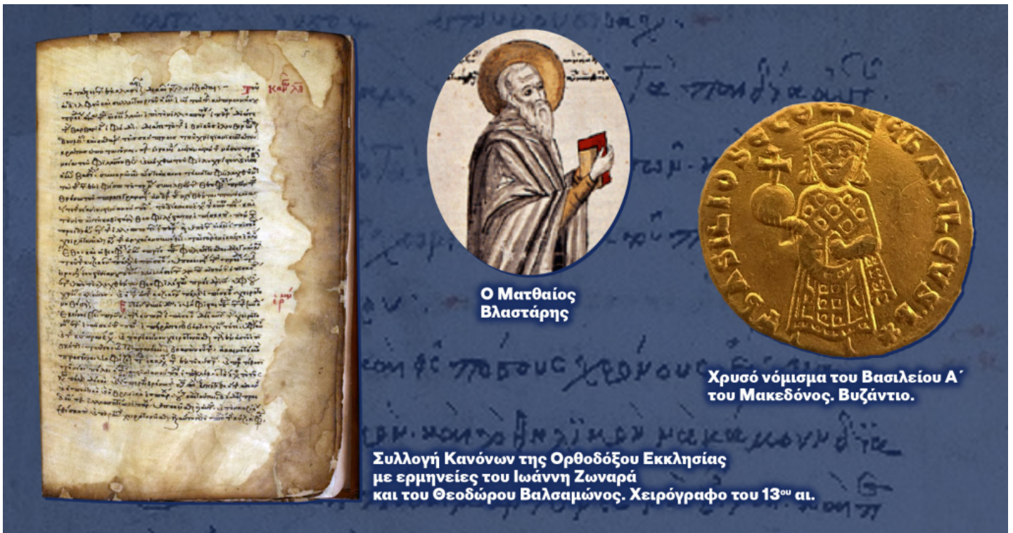
Ὁ Ματθαῖος Βλαστάρης

τάξεως τῶν Πατριαρχῶν... καὶ ὅτι πασῶν τῶν ἐκκλησιῶν κεφαλὴ ἐστὶν ἡ Κωνσταντινούπολις, ἀνάγνωθι βιβλ. α΄ κώδικος, τίτ. α΄, διατ. ζ΄, τίτ. β΄, διατ. στ΄, κ΄ καὶ κδ΄, καὶ τίτ. α΄ τῶν νεαρῶν, διατ. β΄ καὶ τίτ. β΄, διατ. γ΄. Ἡ δὲ ἰστ΄ διατ. τοῦ β΄ τίτ. τοῦ βιβλ. α΄ φησὶν ὅτι ὁ Κωνσταντινουπόλεως ἔχει τῶν ἄλλων προεδρίαν» [12]. Το κείμενο τούτο ακολουθεῖ καὶ ἡ «Εἰσαγωγή» τοῦ αυτοκράτορα Βασιλείου Α΄ (886 μ.Χ.), ὅπου αναφέρεται: «Ὁ Κωνσταντινουπόλεως θρόνος βασιλεία ἐπικοσμηθεὶς ταῖς συνοδικαῖς ψήφοις πρῶτος ἀνερρήθη, αἷς οἱ θεῖοι κατακολουθοῦντες νόμοι καὶ τὰς ὑπὸ τοὺς ἐτέρους θρόνους γινομένας ἀμφισβητήσεις ὑπὸ τὴν ἐκείνου προστάττουσιν ἀναφέρεσθαι διάγνωσιν καὶ κρίσιν» [13]. Εἶναι ἐνδεικτικὸ ὅτι κανένα ἀπὸ ὅσα κείμενα ἀναφέρει ὁ Νομοκάνονας δὲν κάνει λόγο γιὰ τὴν Κωνσταντινούπολη ὡς «κεφαλὴ πασῶν τῶν ἐκκλησιῶν» καὶ κανεὶς νόμος δὲν ἀπονέμει στὸν θρόνο Κωνσταντινουπόλεως παγκόσμια δικαιοδοσία. Εἰάν ὅμως μιλάμε γιὰ τὸ ἐδαφὸς τῆς ἴδιας τῆς Αυτοκρατορίας, ἐν προκειμένῳ τα λεγόμενα τοῦ Νομοκάνονα καὶ τῆς «Εἰσαγωγῆς» εἶναι ὀρθά.