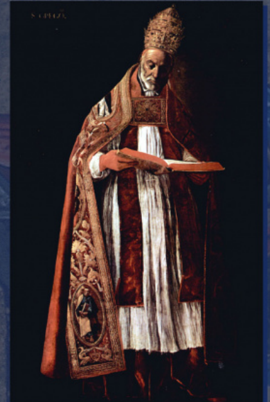
Ο Πάπας Γρηγόριος Α΄. Έργο του Φ. Σουρμπαράν, 1626-1627.

Ωστόσο μόνον στους νόμους του Ιουστινιανού (από το 530) η διατύπωση «Οικουμενικòς Πατριάρχης» αρχίζει να χρησιμοποιείται επισήμως ως προς τους αρχιεπισκόπους Κωνσταντινουπόλεως - Νέας Ρώμης [6]. Αυτή η καινοτομία δεν έγινε αμέσως αντιληπτή εκτός των ορίων του Βυζαντίου, ενώ όταν έγινε προκάλεσε αμέσως την οργισμένη αντίδραση εκ μέρους του θρόνου της Ρώμης. Ο Άγιος Πάπας Γρηγόριος Α΄ διέκρινε στη λέξη «οικουμενικòς» αξιώσεις της Κωνσταντινουπόλεως επί της κυριαρχίας στην Εκκλησία, πράγμα, που με πικρία περιέγραψε στον Ευλόγιο Αλεξανδρείας [7]. Απαντώντας ο Ευλόγιος, αλλά και ο ίδιος ο τότε Πατριάρχης Κωνσταντινουπόλεως διαβεβαίωσαν τον Πάπα ότι δεν είναι τίποτε περισσότερο από έναν πομπώδη τελεταρχικό τίτλο. Και ότι μάλιστα ο γνήσιος ηγέτης των χριστιανών όλης της υφηλίου είναι ο ίδιος, ο προκαθήμενος του αποστολικού θρόνου...