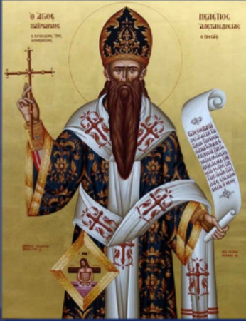
Ο Πατριάρχης Αλεξανδρείας Μελέτιος Α' (1549-1601)