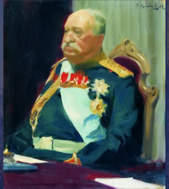
Ο κόμης Ν. Ιγκνάτιεφ. Έργο του Μπ. Κουστόντιεφ, 1902.

Είναι χαρακτηριστικό την ίδια στιγμή ότι οι Πατριάρχες Κωνσταντινουπόλεως καταδίκαζαν αυστηρώς και απερίφραστα τις απόπειρες της παπικής Ρώμης να τεκμηριώσει την πρωτοκαθεδρία της επί των λοιπών Εκκλησιών. Στην Πατριαρχική και Συνοδική Εγκύκλιο του 1895 αναφέρεται ευθέως: «Εκάστη κατά μέρος αυτοκέφαλος Έκκλησία έν τε τῇ Ἀνατολῇ καὶ τῇ Δύσει ἦν ὅλως ἀνεξάρτητος καὶ αὐτοδιοίκητος κατὰ τοὺς χρόνους τῶν ἐπτὰ Οἰκουμενικῶν Συνόδων· ὅπως δὲ οἱ ἐπίσκοποι τῶν αὐτοκεφάλων Ἐκκλησιῶν τῆς Ἀνατολῆς, οὕτω καὶ οἱ τῆς Ἀφρικῆς, τῆς Ἰσπανίας, τῶν Γαλλιῶν, τῆς Γερμανίας καὶ τῆς Βρεττανίας ἐκυβέρνην τὰ τῶν Ἐκκλησιῶν αὐτῶν ἕκαστοι διὰ τῶν ἰδίων τοπικῶν Συνόδων, οὐδὲν ἀναμίξεως δικαίωμα ἔχοντος τοῦ ἐπισκόπου Ρώμης, ὅστις καὶ αὐτὸς ἐπίσης ὑπήγετο καὶ ὑπεῖκεν εἰς τὰς συνοδικὰς ἀποφάσεις. Ἐν σπουδαίοις δὲ ζητήμασι δεομένοις τοῦ κύρους τῆς καθόλου Ἐκκλησίας ἐγένετο ἕκκλησις εἰς Οἰκουμενικὴν Σύνοδον, ἣτις μόνη ἦν καὶ ἔστι τὸ ἀνώτατον ἐν τῇ καθόλου Ἐκκλησίᾳ κριτήριον. Τοιοῦτον ὑπῆρχε τὸ ἀρχαῖον τῆς Ἐκκλησίας πολίτευμα» [17].