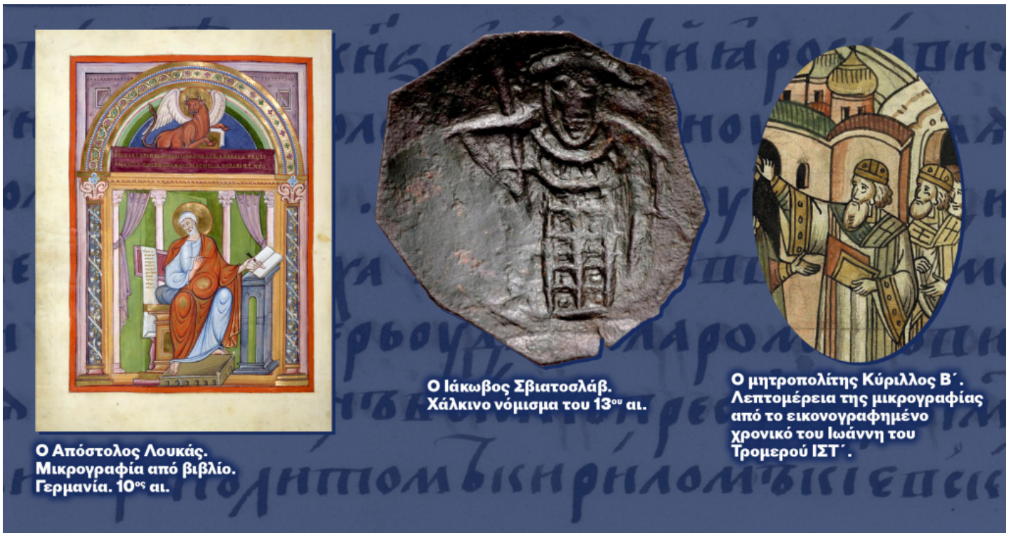
Ο Απόστολος Λουκάς. Μικρογραφία από βιβλίο. Γερμανία. 10 ος αι.