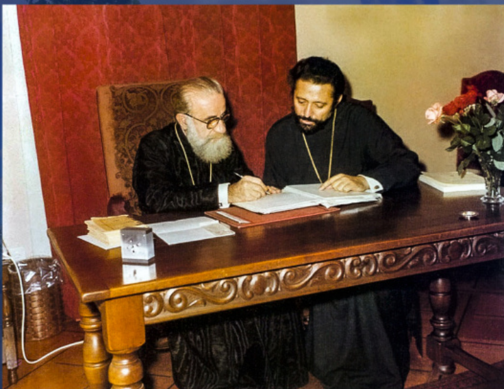
Οι μητροπολίτες Χαλκηδόνας Μελίτων και Ελβετίας Δαμασκηνός στην Προσυνοδική Διάσκεψη στο Σαμπεζύ, 1976.

Τον Νοέμβριο του 1993 στη Διορθόδοξη Προπαρασκευαστική Επιτροπή στο Σαμπεζύ της Ελβετίας το θέμα του Αυτοκεφάλου άρχισε τελικά να συζητείται επί της ουσίας.