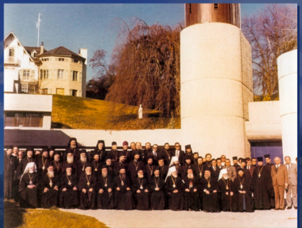
Η Α΄ Πανορθόδοξη Προσυνοδική Διάσκεψη στο Σαμπεζύ Ελβετίας, 1976.

Στην αρχή της συνεδριάσεως παρουσίασε εισήγηση ο γραμματέας της Επιτροπής μητροπολίτης Ελβετίας Δαμασκηνός, ο οποίος εξέθεσε πού συμφωνούν οι Ορθόδοξες Εκκλησίες και πού οι θέσεις τους αποκλίνουν. Ας παραθέσουμε τα σημαντικότερα χωρία εκείνης της έκθεσης: