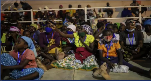
Χιλιάδες άνθρωποι αναμένουν για να διαφύγουν από την Πάλαμα της Μοζαμβίκης