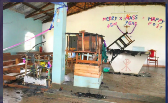
Ναός στην Κένυα μετά την πυρκαγιά

Τον τελευταίο καιρό έχει αυξηθεί η δράση των τρομοκρατικών ομάδων στη Λαϊκή Δημοκρατία του Κονγκό (ΛΔΚ), την Κεντροαφρικανική Δημοκρατία, το Καμερούν και τη Μοζαμβίκη. Βασική απειλή για τον χριστιανικό πληθυσμό της ΛΔΚ αποτελεί η εξτρεμιστική ομάδα «Ενωμένες Δημοκρατικές