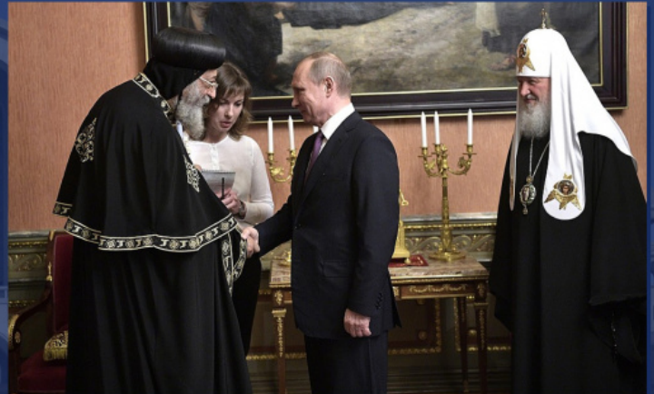
Συνάντηση του Β. Πούτιν με τον επικεφαλής της Κοπτικής Εκκλησίας Θεόδωρο Β΄ και τον Πατριάρχη Μόσχας και Πασών των Ρωσσιών Κύριλλο

Στενές σχέσεις συνδέουν το Πατριαρχείο Μόσχας με την Κοπτική Εκκλησία, ιδιαίτερως την τελευταία επταετία. Η Κοπτική Εκκλησία ήταν η πρώτη εκ των Αρχαίων Ανατολικών Εκκλησιών, με την οποία η Ρωσική Ορθόδοξη Εκκλησία συγκρότησε Επιτροπή Διαλόγου το 2016. Η Επιτροπή συνεχίζει το έργο της έως και σήμερα. Ο Πατριάρχης Θεόδωρος επισκέφθηκε τη Ρωσία δύο φορές, το 2014 και το 2017, είχε συναντήσεις με τον Πρόεδρο της Ρωσικής Ομοσπονδίας Β. Πούτιν και τον Αγιώτατο Πατριάρχη Μόσχας και Πασών των Ρωσσιών Κύριλλο. Η Κοπτική Εκκλησία και το Πατριαρχείο Μόσχας αντήλλαξαν επανειλημμένως επισκέψεις αποστολών εκπροσώπων των μέσω μαζικής ενημερώσεως και αντιπροσωπειών των συνοδικών τμημάτων και μοναζόντων.