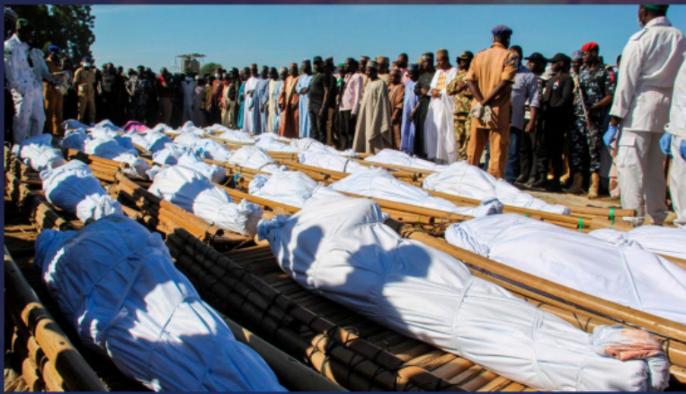
Κηδεία δολοφονημένων αγροτών στη Νιγηρία

Στην Ανατολική Αφρική, στη Σομαλία, την Κένυα και τις γειτονικές χώρες τις διώξεις εις βάρος χριστιανών εξαπολύει η τρομοκρατική ομάδα «Ας-Σαμπαάμπ». Σε βασική τακτική των τρομοκρατών αναδεικνύονται οι ενέδρες σε υπεραστικά λεωφορεία, τους επιβάτες των οποίων ξεχωρίζουν σε μουσουλμάνους και χριστιανούς και στη συνέχεια σκοτώνουν τους τελευταίους. Στην Κένυα, στις αρχές του 2021 διαπράχθηκε σειρά εμπρησμών χριστιανικών ναών.