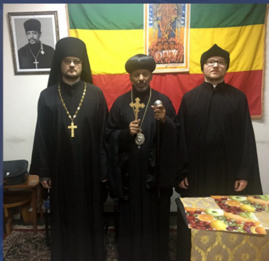
Η αντιπροσωπεία της Ρωσικής Ορθοδόξου Εκκλησίας στην Αιθιοπία

αποστολή έγινε δεκτή από πλήθη ανθρώπων, που κρατούσαν ρωσικές σημαίες και πανό με τα πορτρέτα του Β. Πούτιν και του Πατριάρχη Κυρίλλου.