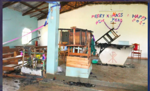
Ναός στην Κένυα μετά την πυρκαγιά

Τον τελευταίο καιρό έχει αυξηθεί η δράση των τρομοκρατικών ομάδων στη Λαϊκή Δημοκρατία του Κονγκό (ΛΔΚ), την Κεντροαφρικανική Δημοκρατία, το Καμερούν και τη Μοζαμβίκη. Βασική απειλή για τον χριστιανικό πληθυσμό της ΛΔΚ αποτελεί η εξτρεμιστική ομάδα «Ενωμένες Δημοκρατικές