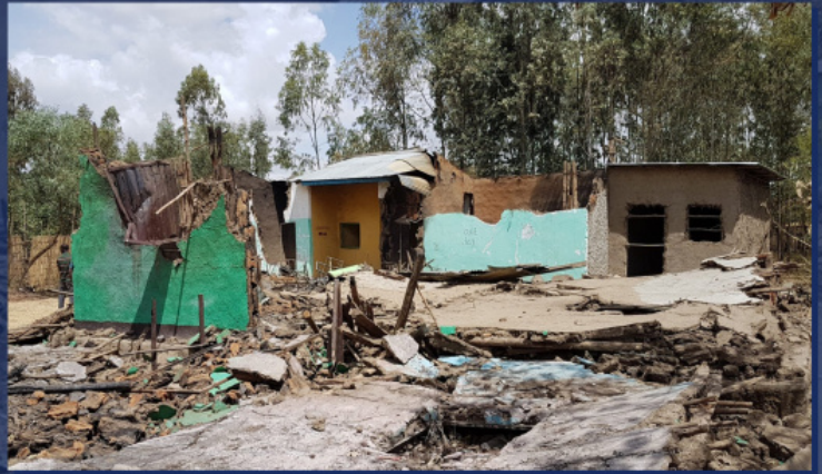
Ερείπια ναού μετά από επίθεση στην Αιθιοπία

Η Ρωσική Ορθόδοξη Εκκλησία καταβάλλει δραστήριες προσπάθειες, που αποβλέπουν στην προστασία των χριστιανών της Αφρικής. Τα τελευταία χρόνια έχουν συναφθεί απευθείας σχέσεις με τις βασικές χριστιανικές Εκκλησίες της ηπείρου, συμπεριλαμβανομένων των μεγαλύτερων εξ αυτών, της Αιθιοπικής και της Κοπτικής. Η Ρωσική Ορθόδοξη Εκκλησία συνεργάζεται μαζί τους στο πλαίσιο διμερών επιτροπών διαλόγου. Οι Προκαθήμενοι των Εκκλησιών της Αιθιοπίας και της Κοπτικής επισκέφθηκαν επανειλημμένως τη Ρωσία.