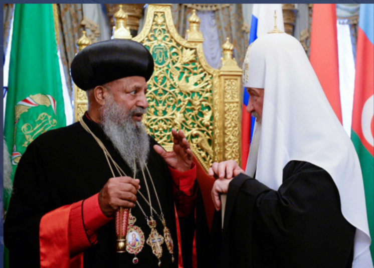
Ο Πατριάρχης Αιθιοπίας Αμπούνα Μαθίας και ο Αγιώτατος Πατριάρχης Κύριλλος

Τον Δεκέμβριο του 2019 ο Αγιώτατος Πατριάρχης Κύριλλος απέστειλε στον Πατριάρχη Αιθιοπίας Αμπούνα Μαθία και τον Πρωθυπουργό της Ομοσπονδιακής Λαϊκής Δημοκρατίας της Αιθιοπίας Α. Αλί επιστολές, όπου εξέφραζε την αγωνία του εξαιτίας της ανησυχητικής εξελίξεως της καταστάσεως και την υποστήριξή του. Στην επιστολή της Αυτού Αγιότητας επισημαίνεται ότι τα γεγονότα στην Αιθιοπία εντάσσονται στην ίδια γραμμή με τις διώξεις κατά των χριστιανικών Εκκλησιών σε σειρά περιοχών της υψηλίου, όπου καταγράφηκαν προσπάθειες να χρησιμοποιηθεί ο θρησκευτικός παράγοντας για την επίτευξη πολιτικών στόχων και παράλληλως να αποδυναμωθούν και να εκφοβισθούν οι παραδοσιακοί χριστιανοί.