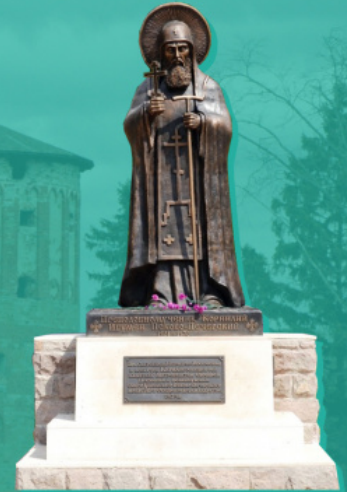
Αδριάντας του Οσιομάρτυρος Κορνηλίου, καθηγουμένου της Μονής των Σπηλαιών των Πσκοφ

Οι ορθόδοξοι ομολογητικοί αγώνες ξεκίνησαν εδώ εκ νέου από το 1841, όταν άρχισε το αυθόρμητο (σε αντίθεση, μάλιστα, με την τοπική «ειδική τάξη», στην οποία ήταν προσανατολισμένη η κρατική πολιτική της αυτοκρατορίας στην περιοχή της Βαλτικής) κίνημα μεταστροφής των Λετονών και Εσθονών αγροτών από τον Λουθηρανισμό στην Ορθοδοξία. Οι διώξεις, που εξαπέλυσαν εναντίον τους οι Γερμανοί ευγενείς της περιοχής της Βαλτικής, ήσαν εξαιρετικά απηνεύς.