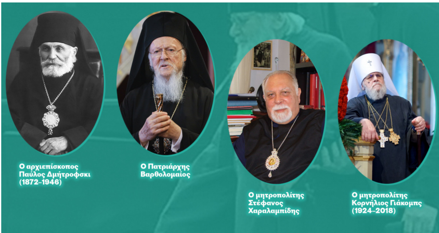
Ο αρχιεπίσκοπος Παύλος Δημήτροφσκι (1872–1946)