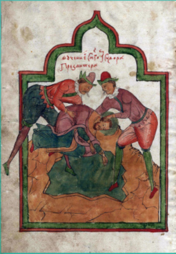
Ο ιερομάρτυς πρεσβύτερος Παΐδιωρος