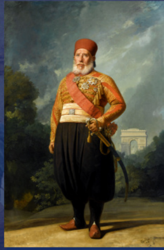
Ο Ιμπραήμ πασά. Έργο του Σαρλ Φιλίππ Ογκιούστ Λαριβιέρ. 1846