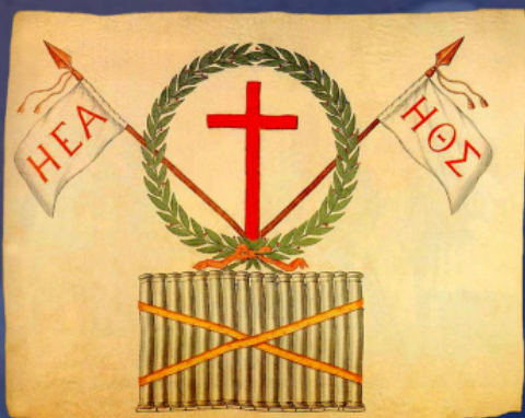
Το λάβαρο της μυστικιστικής οργάνωσης «Φιλική Εταιρεία»

Βορρά». Μετά τη λήξη των πολέμων κατά του Ναπολέοντα οι Έλληνες ακτιβιστές άρχισαν τις προετοιμασίες μιας εξέγερσης: στο έδαφος της Ρωσίας στην Οδησό ιδρύθηκε μια μυστική οργάνωση, η «Φιλική Εταιρεία», η οποία προετοίμασε την εξέγερση των Ελλήνων στις κτήσεις του σουλτάνου. Επικεφαλής της εταιρείας αναδείχθηκε ο στρατηγός του ρωσικού στρατού, Έλληνας στην καταγωγή, Αλέξανδρος Υψηλάντης. Στα τέλη Φεβρουαρίου του 1821 με μικρό απόσπασμα διήλθε τον συνοριακό ποταμό Προύθο και ξεσήκωσε τους Έλληνες της Μολδαβίας. Μετά από ένα μήνα άρχισε η Επανάσταση στην Ελλάδα.