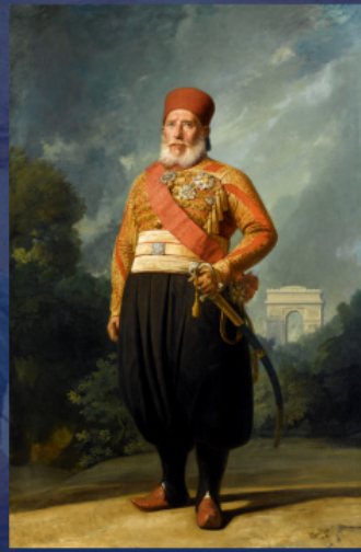
Ο Ιμπραήμ πασά. Έργο του Σαρλ Φιλίππ Ογκιούστ Λαριβιέρ. 1846