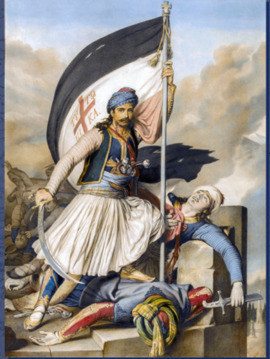
Η κατάληψη της Σαλώνας (Αμφισσα). Έργο του Λουί Ντιουπρέ. 1821

Δεν είναι καθόλου έτσι. Κατά την άνοιξη – καλοκαίρι του 1821 ο Ρώσος απεσταλμένος στη σουλτανική αυλή κόμης Γ. Στρόγκανοφ βομβάρδιζε την Υψηλή Πύλη (σουλτανική κυβέρνηση) με διακοινώσεις διαμαρτυρίας κατά των διώξεων και των πογκρόμ σε βάρος των Ελλήνων. Η ρωσική Αποστολή εντέλει αναχώρησε από την οθωμανική πρωτεύουσα και οι διπλωματικές σχέσεις μεταξύ των δύο χωρών διακόπηκαν.