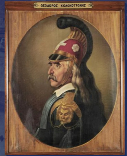
Ο Θεόδωρος Κολοκοτρώνης. Έργο του Διονυσίου Τσόκου. 1861

Όλα αυτά διαμόρφωναν στους Έλληνες επαναστάτες την ψευδή βεβαιότητα σε μια σύντομη νίκη. Περιφρόνησαν μάλιστα το γεγονός ότι πολλά φρούρια στην περιοχή της εξεγέρσεως ευρίσκονταν ακόμη στα χέρια των τουρκικών στρατοπέδων. Το 1824-1825 οι πολιτικές διαφωνίες στις γραμμές των Ελλήνων επαναστατών οδήγησαν σε σειρά εμφύλιων συρράξεων. Κι εκείνη την περίοδο ο σουλτάνος άλλαξε τακτική και στράφηκε για βοήθεια στον υποτελή του κυβερνήτη της Αιγύπτου Μεχμέτ Αλί. Το 1824 ο τουρκο-αιγυπτιακός στόλος προκάλεσε στη θάλασσα σειρά ηττών στους Έλληνες επαναστάτες, διασφαλίζοντας την ασφάλεια της διά θαλάσσης μεταφοράς στρατευμάτων στην περιοχή της εξεγέρσεως. Τον Φεβρουάριο του 1825 άρχισε η απόβαση των αιγυπτιακών στρατευμάτων στην Πελοπόννησο.