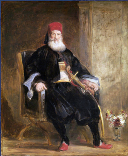
Ο Μεχμέτ Αλί Πασά της Αιγύπτου. Έργο του Δεϊβιντ Ουϊλκι. 1841