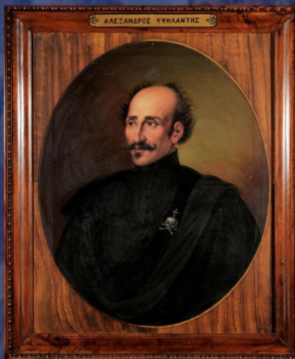
Ο Αλέξανδρος Υψηλάντης. Έργο του Διονυσίου Τσόκου