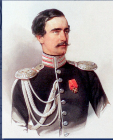
Ο κόμης Γρηγόριος Αλεξάνδροβιτς Στρόγκανοφ. Υδατογραφία του Β. Γκάου. 1847