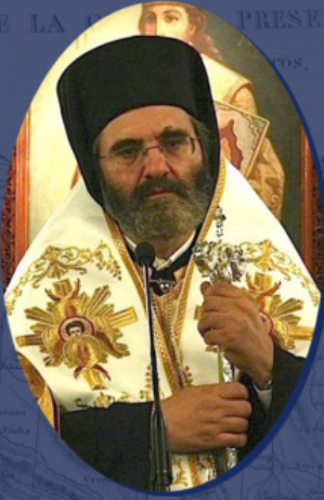
Ο επίσκοπος Αβύδου (νυν μητροπολίτης Κρήνης) Κύριλλος