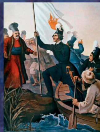
Η διάβαση του Προύθου από τον Υψηλάντη. Έργο του Πέτερ φον Γκεσ

Επί σχεδόν μια δεκαετία αγωνίσθηκαν οι γενναίοι Έλληνες για την ελευθερία τους. Οι δυνάμεις, όμως, ήσαν πολύ άνισες: οι πόροι μερικών εξεγερθεισών περιοχών ήταν ασύγκριτα μικρότεροι των πόρων της τεράστιας Οθωμανικής Αυτοκρατορίας. Γι' αυτό, παρά τις αρχικές επιτυχίες, χωρίς έξωθεν βοήθεια η Ελληνική Επανάσταση ήταν καταδικασμένη σε ήττα. Δυστυχώς, αργότερα, ορισμένοι Έλληνες πολιτικοί και προσωπικότητες της κοινωνίας της άρχισαν να αρνούνται την βοήθεια της Ρωσίας, της Αγγλίας και της Γαλλίας στη δημιουργία της ανεξάρτητης Ελλάδας. Ένα από τα τελευταία παραδείγματα είναι η επιστολή του επισκόπου Αβύδου (νυν μητροπολίτη Κρήνης) Κυρίλλου στο εκκλησιαστικό πρακτορείο ειδήσεων Romfea.gr. Ο Θεοφιλέστατος Κύριλλος αποδέχεται την ύπαρξη στη Ρωσία ενός ευρύτερου κοινωνικού κινήματος υπέρ των επαναστατημένων Ελλήνων, εν τούτοις ισχυρίζεται ότι η επίσημη Ρωσία δήθεν δεν έπραξε τίποτε για την Ελλάδα.