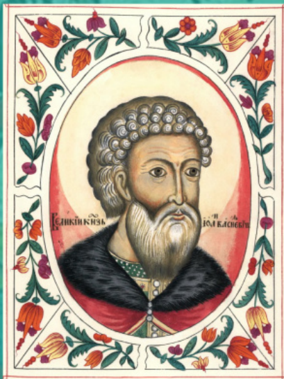
Ο Ιβάν Γ' του Βασιλείου. Προσωπογραφία από τον «Βασιλικό κατάλογο τίτλων», 17 ος αι