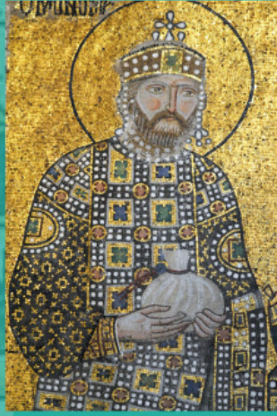
Ο Κωνσταντίνος Θ' ο Μονομάχος. Λεπτομέρεια του ψηφιδωτού του ναού της Αγίας Σοφίας Κωνσταντινούπολεως. Μέσα του 11 ου αι