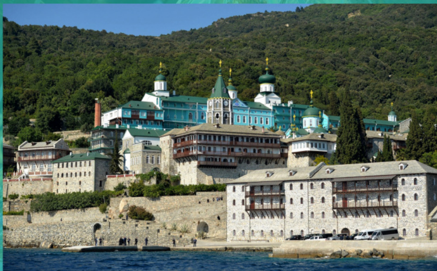
Η Μονή του Αγίου Παντελεήμονος στο Άγιον Όρος