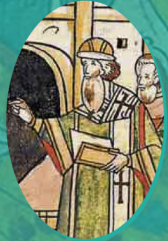
Ο μητροπολίτης Ζωσιμάς. Λεπτομέρεια μικρογραφίας. Χρονολογική συλλογή. Βιβλίο 17, σ. 140

Ο Σπυρίδων - Σάββας, συντάκτης της «Επιστολής περί δωρεών του Μονομάχου» (γύρω στο 1503) τοποθετεί στα χείλη του αυτοκράτορα του 11 ου αι. Κωνσταντίνου Μονομάχου την ακόλουθη νουθεσία προς τον εγγονό του, τον Ρώσο πρίγκιπα Βλαδίμηρο Μονομάχο: «Ας παραμείνουν οι Εκκλησίες του Θεού χωρίς αναστάτωση και όλη η Ορθοδοξία ας μείνει ήσυχη υπό την εξουσία της βασιλείας μας και της δικής σου αυτεξουσίου αυτοκρατορίας της Μεγάλης Ρωσίας. Ας ονομάζεσαι εφεξής θεόστεπτος βασιλέας, που στεφανώθηκε από το βασιλικό τούτο διάδημα από το χέρι του Αγιωτάτου Μητροπολίτη Νεοφύτου μετά των επισκόπων». Ενδεικτικό είναι ότι εδώ ο αυτοκράτορας δεν παραχωρεί ουδόλως τον τίτλο του και την κεντρική του θέση ως προστάτη ολόκληρης της Ορθοδοξίας, αλλά τρόπον τινά καθιστά κοινώνό της υπηρεσίας του τον Ρώσο πρίγκιπα, ο οποίος αναγνωρίζεται ως «αυτεξούσιος και κυρίαρχος» βασιλέας της Μεγάλης Ρωσίας. Ακριβώς αυτόν τον τίτλο και «θα αποκαταστήσει» το 1547 ο Ιβάν Βασιλιεβιτς Γκρόζνι (ο Τρομερός) την ώρα της περίφημης στέψεώς του ως βασιλέα.