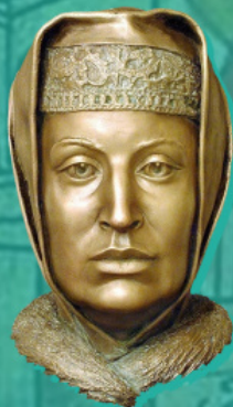
Η Σοφία Παλαιολογίνα. Πλαστική αναπαράσταση του Σ. Α. Νικίτιν, 1994