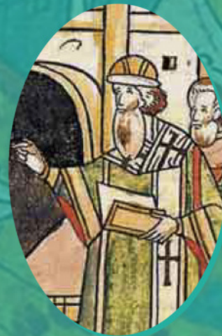
Ο μητροπολίτης Ζωσιμάς. Λεπτομέρεια μικρογραφίας. Χρονολογική συλλογή. Βιβλίο 17, σ. 140

Ο Σπυρίδων - Σάββας, συντάκτης της «Επιστολής περί δωρεών του Μονομάχου» (γύρω στο 1503) τοποθετεί στα χείλη του αυτοκράτορα του 11 ου αι. Κωνσταντίνου Μονομάχου την ακόλουθη νουθεσία προς τον εγγονό του, τον Ρώσο πρίγκιπα Βλαδίμηρο Μονομάχο: «Ας παραμείνουν οι Εκκλησίες του Θεού χωρίς αναστάτωση και όλη η Ορθοδοξία ας μείνει ήσυχη υπό την εξουσία της βασιλείας μας και της δικής σου αυτεξουσίου αυτοκρατορίας της Μεγάλης Ρωσίας. Ας ονομάζεσαι εφεξής θεόστεπτος βασιλέας, που στεφανώθηκε από το βασιλικό τούτο διάδημα από το χέρι του Αγιωτάτου Μητροπολίτη Νεοφύτου μετά των επισκόπων». Ενδεικτικό είναι ότι εδώ ο αυτοκράτορας δεν παραχωρεί ουδόλως τον τίτλο του και την κεντρική του θέση ως προστάτη ολόκληρης της Ορθοδοξίας, αλλά τρόπον τινε καθιστά κοινωνό της υπηρεσίας του τον Ρώσο πρίγκιπα, ο οποίος αναγνωρίζεται ως «αυτεξούσιος και κυρίαρχος» βασιλέας της Μεγάλης Ρωσίας. Ακριβώς αυτόν τον τίτλο και «θα αποκαταστήσει» το 1547 ο Ιβάν Βασιλιεβιτς Γκρόζνι (ο Τρομερός) την ώρα της περίφημης στέψεώς του ως βασιλέα.