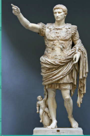
Ο Οκταβιανός Αύγουστος από το Πρίμα Πόρτα. Μουσείο του Κιαραμόντι, Βατικανό, 1 ος αι