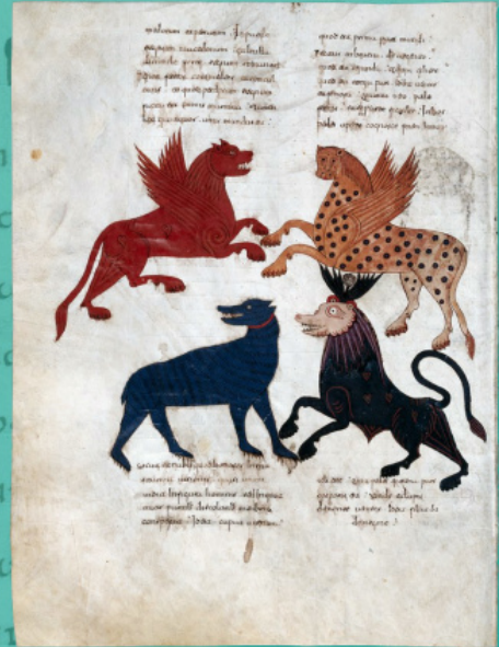
Θηρία από το όραμα του προφήτη Δανιήλ. Μπεάτ από την Λιεμπάν. Κώδικας του Φερνάντο Α' και της Ντόνα Σάντσα, 1047

Οι τέσσερις βασιλείες που περιέγραψε, ταίριαζαν άψογα με την παγκόσμια ιστορία: Το νέο βασίλειο της Βαβυλώνας (η χρυσή λέαινα) διαδέχθηκε η Περσία (η ασημένια αρκούδα), την οποία απορρόφησε το μακεδονικό κράτος του Αλεξάνδρου, που διαιρέθηκε μετά τον θάνατό του (η χάλκινη λεοπάρδαλη με τα τέσσερα κεφάλια). Στη συνέχεια η πανίσχυρη Ρωμαϊκή Αυτοκρατορία ένωσε όλη σχεδόν την οικουμένη στις σιδερένιες αγκαλιές της. Από όλες τις υπόλοιπες την διέκρινε η έλλειψη ενός κυρίαρχου έθνους (πράγμα που εξηγούσε την ανομοιότητα του θηρίου, που την εκπροσωπούσε, με κάθε άλλο θηρίο), ενώ το μίγμα πηλού με τον σίδηρο εξηγείτο εύκολα από τη σταδιακή ανάμειξη των φιλοπόλεμων Ρωμαίων με τους κατακτημένους λαούς. Τα κέρατα μπορούν να συσχετισθούν με τους αυτοκράτορες, οι οποίοι αγωνίζονταν για την εξουσία, ενώ «το στόμα λαλούν μεγάλα», το οποίο καταπίεζε τον «λαό των αγίων», ήταν φυσικό να ταυτισθεί με την έλευση του Αντιχρίστου, του οποίου έπεται η Βασιλεία του Θεού.