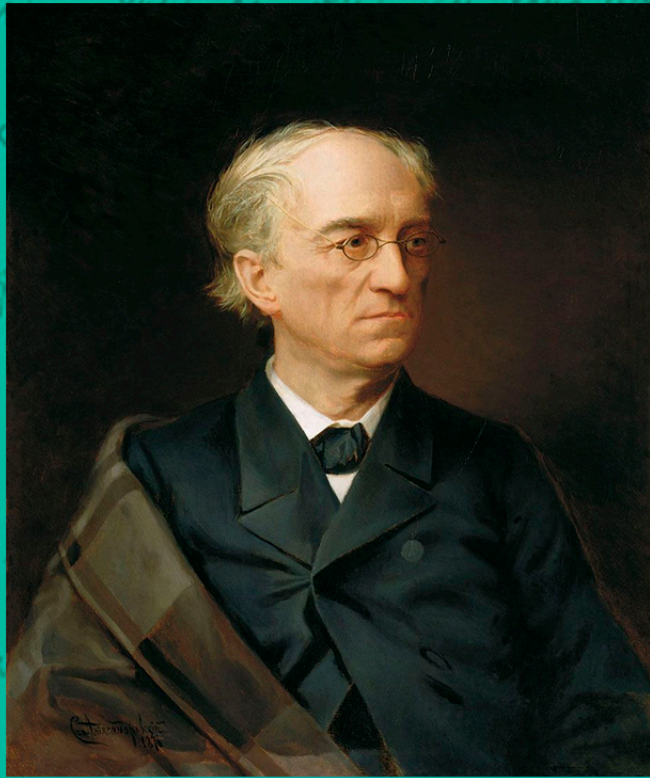
Προσωπογραφία του Θεοδώρου Τιούτσεφ. Έργο του Σ.Φ. Αλεξαντρόφσκι, 1876

Τον 19 ο αι. το δόγμα της Τρίτης Ρώμης με το αρχικό εσχατολογικό νόημά του φαινομενικά λησμονήθηκε. Αλλά το 1849, κατά την κορύφωση των επιτυχιών της εξωτερικής πολιτικής του Νικολάου Α΄, ο 45ετής Ρώσος διπλωμάτης Θεόδωρος Τιούτσεφ γράφει το ποίημα «Ρωσική γεωγραφία», το οποίο έχει ως κατακλείδα την βιβλική μνεία της «τελευταίας βασιλείας»: