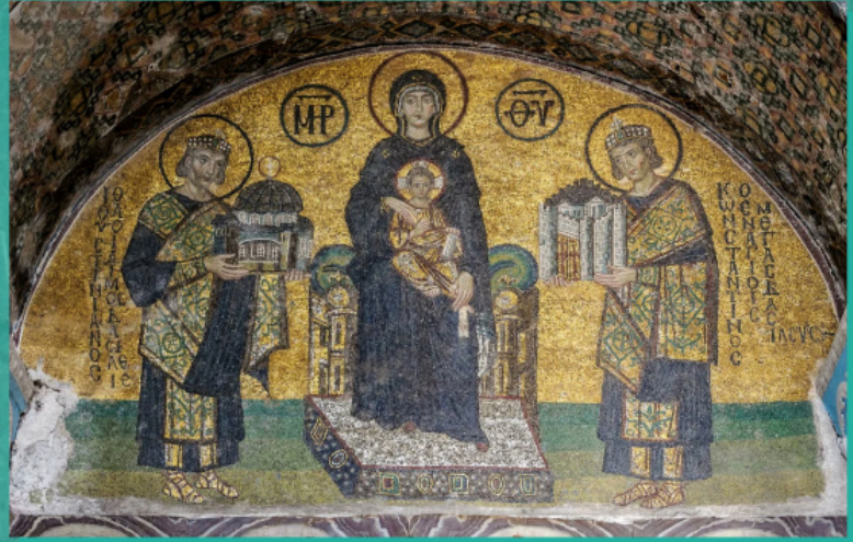
Οι αυτοκράτορες Κωνσταντίνος (δεξιά) και Ιουστινιανός (αριστερά) ενώπιον της Θεοτόκου. Ψηφιδωτό, ναός της Αγίας Σοφίας (μέσα του 10 ου αι.)