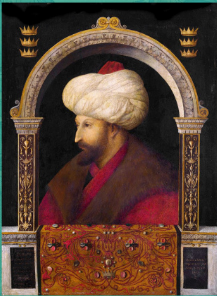
Προσωπογραφία του Σουλτάνου Μεχμέτ Β'. Έργο του Τζεντίλε Μπελλίνι. 1480. Εθνική Πινακοθήκη του Λονδίνου

γὰρ πρὸς αὐτοὺς τις εἶρετο· „Καὶ διὰ τί ὑπεγράφετε;”—ἔλεγον· „Φοβούμενοι τοὺς Φράγγους.”—Καὶ πάλιν ἐρωτῶντες αὐτοὺς, εἰ ἐβασάνισαν οἱ Φράγγοι τινά, εἰ ἐμαστίγωσαν, εἰ εἰς φυλακὴν ἔβαλον;—„Οὐχί”—„Ἀλλὰ πῶς;”—„Ἡ δεξιὰ αὕτη ὑπέγραψεν,” ἔλεγον, „κοπήτω· Ἡ γλῶττα ὠμολόγησεν, ἐκριζούσθω.”—Οὐκ ἄλλο εἶχον τί λέγειν· Καὶ γὰρ ἦσαν τινες τῶν ἀρχιερέων ἐν τῷ ὑπογράφειν λέγοντες· „Οὐχ ὑπογράφωμεν, ἐὰν τὸ ἱκανὸν ἡμῖν τῆς προσόδου παράσχηται;”—Οἱ δὲ ἔδιδον καὶ ἐβάπτετο κάλαμος. Ὑπὲρ ἀριθμὸν γὰρ ἦσαν τὰ δαπανηθέντα εἰς αὐτοὺς νομίσματα καὶ τὰ ἐν χερσὶ μετρηθέντα ἐκάστου τῶν πατέρων. Εἶτα μεταμεληθέντες οὐδὲ τὰ ἀργύρια ὑπέστρεψαν. Πρὸς τὴν φωνὴν οὖν αὐτῶν, ὅτι τὴν πίστιν αὐτῶν πέπρακαν, καὶ ἐπέκεινα τοῦ Ἰούδα ἤμαρτον τοῦ στρέψαντος τὰ ἀργύρια. Ἀλλ' οἶδε κύριος καὶ ἀνεβάλετο· καὶ πῦρ ἀνήφθη ἐν Ἰακώβ καὶ ὀργὴ ἀνέβη ἐπὶ τὸν Ἰσραὴλ». (Κρασαβίνα Σ.Κ. Ο Δούκας και ο Σφραντζής σχετικά με την Ουνία της Ορθοδόξου και της Καθολικής Εκκλησίας, Vyzantiiskyi Vremennik, 1973, τ. 27, σ. 145.)