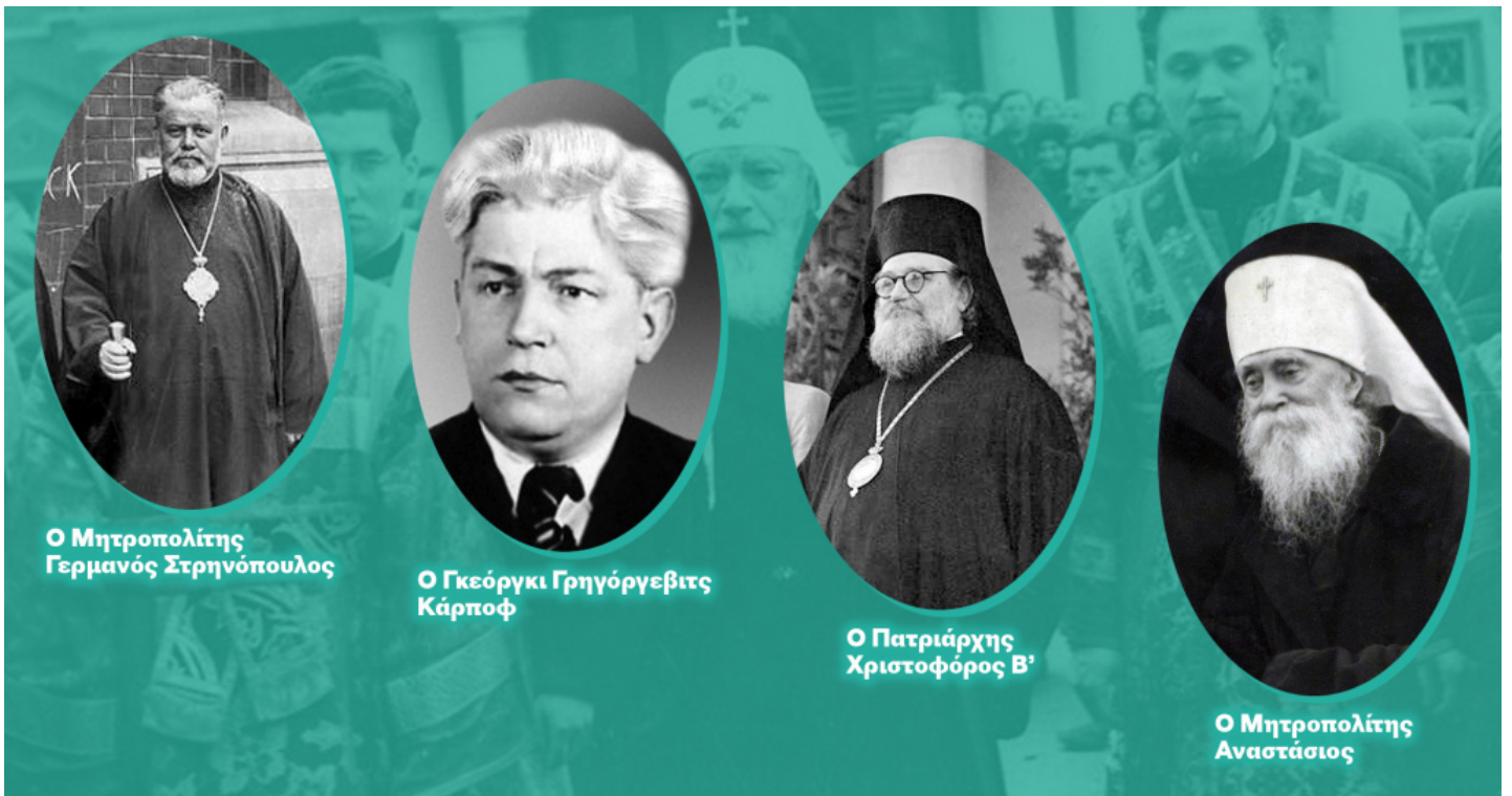
Ο Μητροπολίτης Γερμανός Στρηνόπουλος