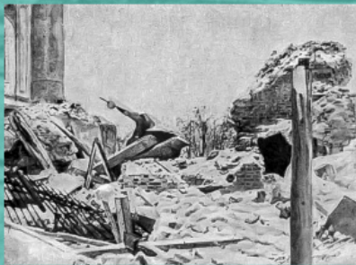
Ερείπια της εκκλησίας στο χωριό Σίλιμπουχοβο της Περιφέρειας Μόσχας