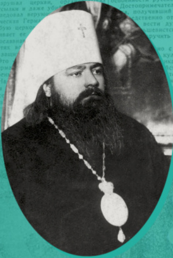
Ο Μητροπολίτης Σέργιος Βοσκρεσένσκι