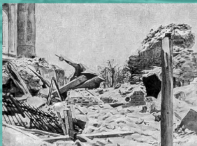
Ερείπια της εκκλησίας στο χωριό Σίλιμπουχοβο της Περιφέρειας Μόσχας