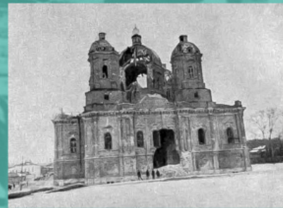
Ο Ναός των Αγίων Μυροφόρων στην πόλη Σέρπουχοφ στην Περιφέρεια Μόσχας