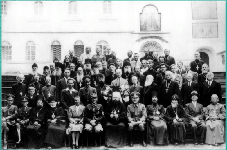
Κληρικοί της Ορθόδοξου Ιεραποστολής Πσκοφ και Γερμανοί στρατιωτικοί στη Μονή των Σηλαιών του Πσκοφ

Σχεδόν όλες οι κατεχόμενες από τα γερμανικά στρατεύματα ρωσικές περιφέρειες ευρίσκονταν κοντά στο μέτωπο και διοικούνταν από στρατιωτική διοίκηση, η οποία σε πολλές περιπτώσεις στις πρακτικές εκδηλώσεις της χαλάρωνε τη ναζιστική κατευθυντήρια γραμμή έναντι της Ρωσικής Εκκλησίας. Ιδιαίτερα ευνοϊκή σε σύγκριση με άλλες περιφέρειες ήταν η κατάσταση στη Βορειοδυτική Ρωσία, όπου έδρασε επιτυχώς η Ορθόδοξη Ιεραποστολή Πσκοφ. Ο επικεφαλής της Εξαρχίας Βαλτικής του Πατριαρχείου Μόσχας μητροπολίτης Σέργιος Βοσκρεσένσκι κατόρθωσε ήδη στα μέσα Αυγούστου του 1941 να εξασφαλίσει άδεια της στρατιωτικής διοικήσεως να ιδρύσει Ιεραποστολή και εν συνεχεία, μέχρι τη δολοφονία του τον Απρίλιο του 1944, απέδιδε μεγάλη προσοχή στη λειτουργία της. Η θρησκευτική αναγέννηση σε διάφορες περιοχές της Ρωσίας εξελισσόταν πολύ δυναμικά και ήταν στενώς συνδεδεμένη με την αύξηση της εθνικής αυτοσυνειδησίας.