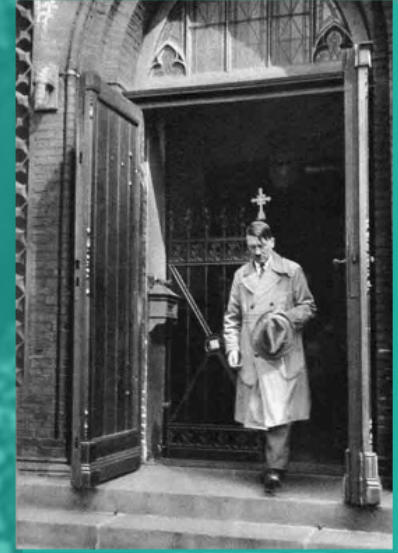
Ο Χίτλερ εξέρχεται από ναό, 1931

Μετά την έναρξη, την άνοιξη του 1941, της στρατιωτικής επιθέσεως του Ράιχ στα Βαλκάνια και τον Ιούνιο κατά της ΕΣΣΔ, η προηγούμενη πολιτική υπέστη σημαντικές αλλαγές (τα πρώτα σημάδια αυτών των αλλαγών κατέστησαν εμφανή ήδη στο Κυβερνείο της Πολωνίας το 1939-1940). Επικράτησε η εχθρική στάση έναντι της Ρωσικής Ορθοδόξου Εκκλησίας. Επεκτάθηκαν και μάλιστα ενισχύθηκαν αισθητά εις βάρος της οι μέθοδοι άσκησης πίεσεως, οι οποίες είχαν ήδη δοκιμασθεί σε άλλες ομολογίες στο έδαφος της ίδιας της Γερμανίας, όπου η κατευθυντήρια γραμμή για τη διευθέτηση του «θρησκευτικού ζητήματος» είχε ως γνώμονα τη διάλυση (εσωτερική και εξωτερική) των διαμορφωθείσων παραδοσιακών ανθεκτικών δομών, την «ατομικοποίηση» των Εκκλησιών. Καταβλήθηκαν προσπάθειες να διαμελισθεί και η Ρωσική Εκκλησία σε αρκετά τμήματα, που δεν θα επικοινωνούσαν μεταξύ τους (κυρίως, με βάση το εθνικό κριτήριο), αυτά τα τμήματα να τεθούν υπό πλήρη έλεγχο και ταυτόχρονα καταβαλλόταν προσπάθεια να χρησιμοποιηθούν οι εκκλησιαστικές οργανώσεις για να βοηθήσουν τις διοικήσεις στα κατεχόμενα εδάφη και για προπαγανδιστικούς σκοπούς. Σε αυτό οφείλεται και η μεταβολή στη στάση έναντι του ρωσικού ιερού κλήρου της Διασποράς, του οποίου επιχειρήθηκε η πλήρης απομόνωση από τα γεγονότα στη Ρωσία και από τους αιχμαλώτους ή εκτοπισθέντες στη Γερμανία για καταναγκαστικές εργασίες συμπατριώτες τους.