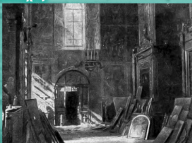
Εσωτερικό του Ναού της Κοιμήσεως της Θεοτόκου, που καταστράφηκε και λεηλατήθηκε από τους Γερμανούς