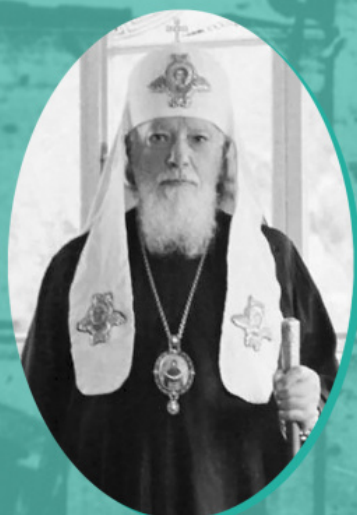
Ο Πατριάρχης Μόσχας και Πασών των Ρωσικών Αλέξιος Α΄