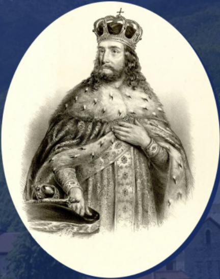
სტეფანე უროშ III დეჩანელი. ანასტასი იოვანოვიჩის ლიტოგრაფია