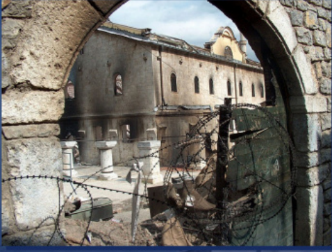
პრიზრენის წმინდა გიორგის სახელობის ტაძარი დარბევის შემდეგ, 2004 წლის მარტი.