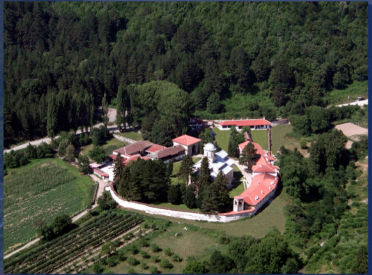
მაღალი დეჩანის მონასტერი