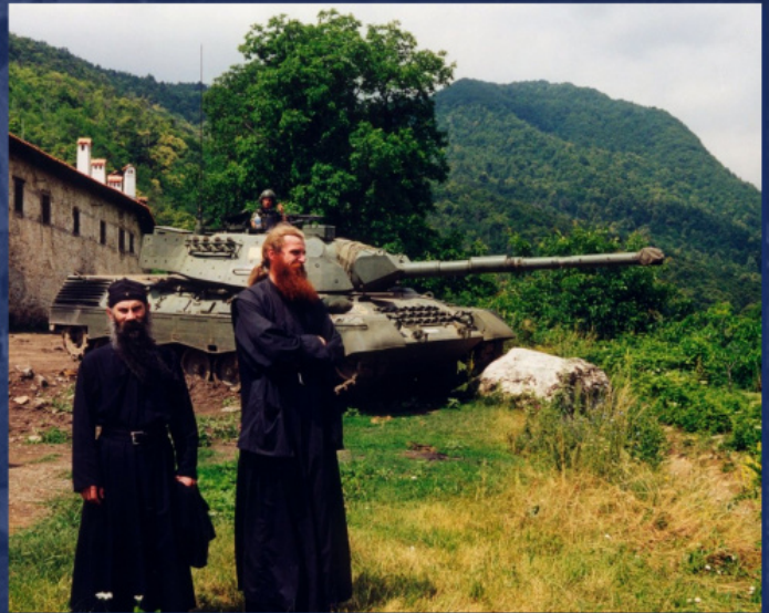
KFOR-ის საერთაშორისო კონტიგენტის დაცვის ქვეშ

2004 წლის 17 მარტს კოსოვოსა და მეტოქის მთელს ტერიტორიაზე მოეწყო მრავალრიცხოვანი და კარგად ორგანიზებული თავდასხმა სერბებზე. დარბევის შედეგად დაიღუპა 19 ადამიანი, 140-ზე მეტი დაიჭრა, რამდენიმე ათასი სერბი გაიქცა თავიანთი დანგრეული სახლებიდან. ასევე შეიბღალა, განადგურდა თუ გადაინვა 35 ტაძარი და მონასტერი. და ეს ყველაფერი ხდებოდა ზოგჯერ „კოსოვოს ძალების“ სამხედრო მოსამსახურეების გულგრილი მზერის ფონზე, რომლებიც რეგიონში მოვლენილნი იყვნენ იმისათვის, რომ მრავალტანჯულ მინაზე უსაფრთხოება უზრუნველყოთ და მშვიდობა დაეცვათ.