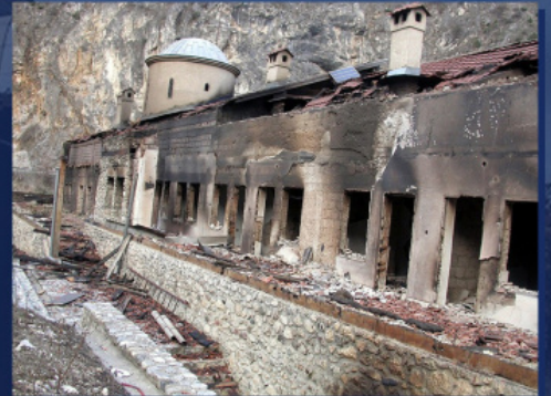
მთავარანგელოზთა სახელობის მონასტერი პრიზრენის მახლობლად დარბევის შემდეგ, 2004 წლის მარტი.

2008 წელს ალბანელებმა გამოაცხადეს კოსოვოს დამოუკიდებლობა, რომელსაც დღემდე არ აღიარებს რუსეთი, ჩინეთი და ბევრი სხვა ქვეყანა. აი, როგორი სიტყვებით უპასუხა ამაზე სერბეთის პატრიარქმა პავლემ თავის სააღდგომო ეპისტოლეში 2008 წელს: „ამა სოფლის ძლიერთ <...> სურვილი აქვთ კოლექტიურად დასაჯონ მართლმადიდებელი სერბი ხალხი, უნდათ მისი გატეხვა და ნაშლა, რომ მისგან შექმნან უსახური ბრბო, რომ მისი წიალიდან გული ამოგლიჯონ... ქრისტეს ნებას დამორჩილებულნი, ჩვენ ვამონებთ მათ უკანონობას, მათ თვალთმაქცობას, რომლებიც შეგვახსენებს, თუ როგორ დაიბანა პილატემ მართალთა სისხლში გათხვრილი ხელები“.