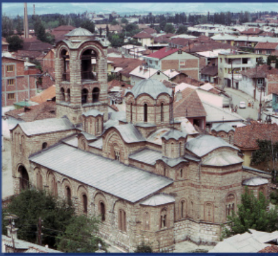
ლევების ღვთისმშობლის ეკლესია