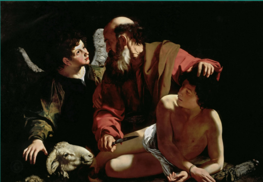
ისააკის მსხვერპლად შეწირვა. მიქელანჯელო მერიზი და კარავაჯო, 1598 წ.

ჩვენ არ გაგვაჩნია ღმერთის ისეთი სრულყოფილი და სრული სიყვარული, როგორც ჩვენს წმინდა მამებს ჰქონდათ. ვისაც წმინდა სიყვარულით უყვარს ღმერთი, შეურევნელად სიცრუისა და პირმოთნეობისა, მას არაფერი აშორებს ღვთის სიყვარულს – არც შვილები, არც ცოლი, არც ძმა, არც ოჯახი, არც ოქრო, არც ხელისუფლება. როგორც ღვთის გულწრფელად მოსიყვარულე აბრაამმა არ დაინდო თავისი ძე – ისააკი, როდესაც მისგან მისი მსხვერპლად შეწირვა ებრძანა, არამედ შეისმინა მისი და გააკეთა ის, რაც ნაბრძანები ჰქონდა. და როგორც წმინდა მონამენი, რომლებმაც ღვთის სიყვარული არჩიეს ღრობებით ცხოვრებას და მოთმინებით იტანდნენ ტანჯვას, ღვთისთვის ღვრიდნენ საკუთარ სისხლს. ღვთისადმი სიყვარულის მიზეზით ასრულებდნენ ისინი წმინდა პავლე მოციქულის სიტყვებს: „ვინ განმაშორნეს ჩუენ სიყვარულსა მას ქრისტესსა: ჭირმან ანუ იწროებამან, დევნამან ანუ სიყმილმან, შიშლოებამან ანუ ურვამან ანუ მახვილმან?.. რამეთუ მრწამს მე, ვითარმედ არცა სიკუდილმან, არცა ცხოვრებამან, არცა ანგელოზთა, არცა მთავრობათა, არცა ძალთა, არცა ამან სოფელმან, არცა მან სოფელმან, არცა სიმაღლეთა, არცა სიღრმეთა, არცა სხუამან დაბადებულმან შემიძლოს ჩუენ განყენებად სიყვარულსა ღმერთისასა, რომელ არს ქრისტე იესუსს მიერ უფლისა ჩუენისა (რომ. 8:35, 38-39).