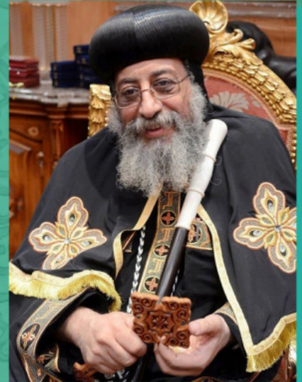
კომპიუტერული ეკლესიის პატრიარქი თავადროს II

წარმოდგენილი ნაწარმოები თავისი არსით წარმოადგენს ქრისტიანის კეთილმსახური ცხოვრების საფუძვლების მოკლე გადმოცემას და თავისი სიმარტივითა და, იმავდროულად, აზრის სიღრმით საოცარ ემოციებს იწვევს, შეიცავს ყოველი დროისათვის აქტუალურ სულიერ რჩევებს და უეჭველად ცხოველ ინტერესს გამოიწვევს მკითხველთა ფართო წრეში.