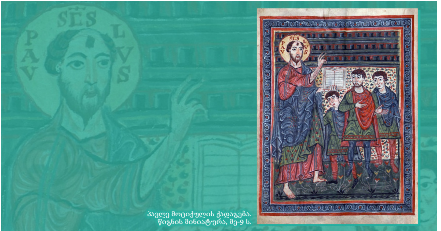
პავლე მოციქულის ქადაგება. წიგნის მინიატურა, მე-9 ს.

ჩემო შვილებო, თითოეულ თქვენგანს მცნებად ვაძლევ, რომ არ მიეახლოს ეკლესიის სანუკვარ საიდუმლოებს, სანამ წინასწარ ყველას არ შეურიგდება. ვისაც თავის ძმაზე რამე წყენა გაგაჩნია – იჩქარე მასთან შერიგება, სთხოვე შენდობა და დიდი მეტანია გაუკეთე, და მხოლოდ ამის შემდეგ მიეახლე საიდუმლოებს. იცოდეთ, რომ ძმებს შორის სიყვარული და მათი გულების ურთიერთშერიგება არის კურთხევა, რომელშიც მადლის მთელი სავსება მყოფობს.