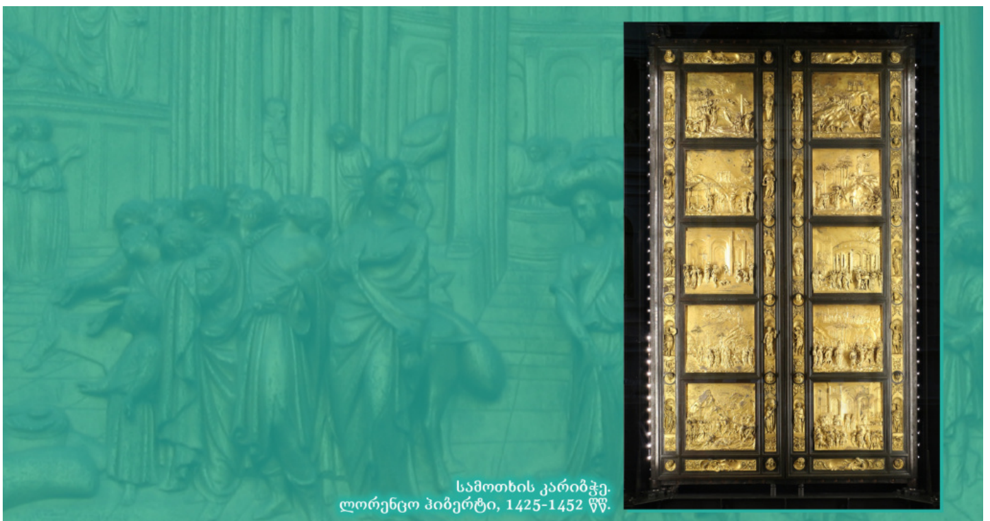
სამოთხის კარიბჭე. ლორენცო პიბერტი, 1425-1452 წწ.

ღვანლის მსურველმა დაე, ესწრაფვოს მას მხიარული გულით, უდებების გარეშე. კურთხეულნი არიან, ვინც ყოველთვის გულში სიხარულით შრომობენ, რამეთუ მათთვის სამოთხის კარი იხსნება.