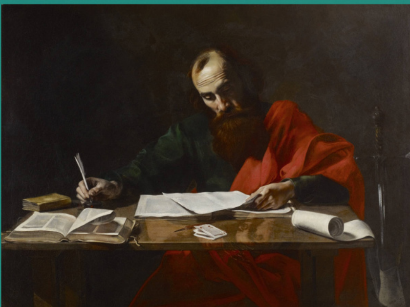
წმინდა პავლე ეპისტოლეს წერს. ვალანტენ დე ბულონი, 1618-1620 წწ.

დაიმარხეთ ეს თქვენს გულებში და ნუ განიკითხავთ მოყვასს, ნუ აწყენინებთ მას, რათა არ განარისხოთ მასში დამკვიდრებული ღმერთი. იმიტომ, რომ ყოველგვარი პატივი, რასაც ადამიანი თავის მოყვასს აღმოუჩენს, ეს არის ქრისტესთვის მიგებული პატივი – დიდება მას!