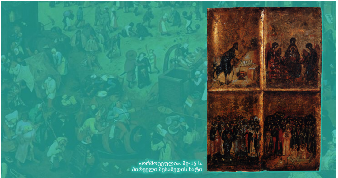
«ორმოცეული». მე-15 ს. პირველი მესამედის ხატი

მარხვა უკავშირდება რამდენიმე ყველა თქვენგანისთვის ცნობილ სათნოებას, მაგრამ მათ მხოლოდ მაშინ მოაქვთ შედეგი, როცა ერთად არიან. ყურადღებით იყავით, ნუ უგელებელყოფთ მარხვას, და მაშინ ჩვენი მტრები, რომლებსაც შურთ და ცდილობენ ჩვენი სათნოებების გათელვას, უღონონი გახდებიან ჩენთვის ზიანის მოსაყენებლად. რაც მეტად უგულებელყოფთ მარხვებს, მით მეტის ზიანის მოტანას შეძლებენ ისინი ჩვენთვის.