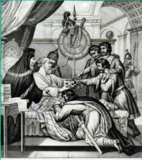
НАСТАВЛЕНИЕ ЯРОСЛАВА СЫНО- ВЪЯМЪ 1054

იაროსლავის შუგონება თავის ვაჟებს, 1054 წ. ბ. ა. ჩორიკოვის ლითოგრაფია, 1836 წ.