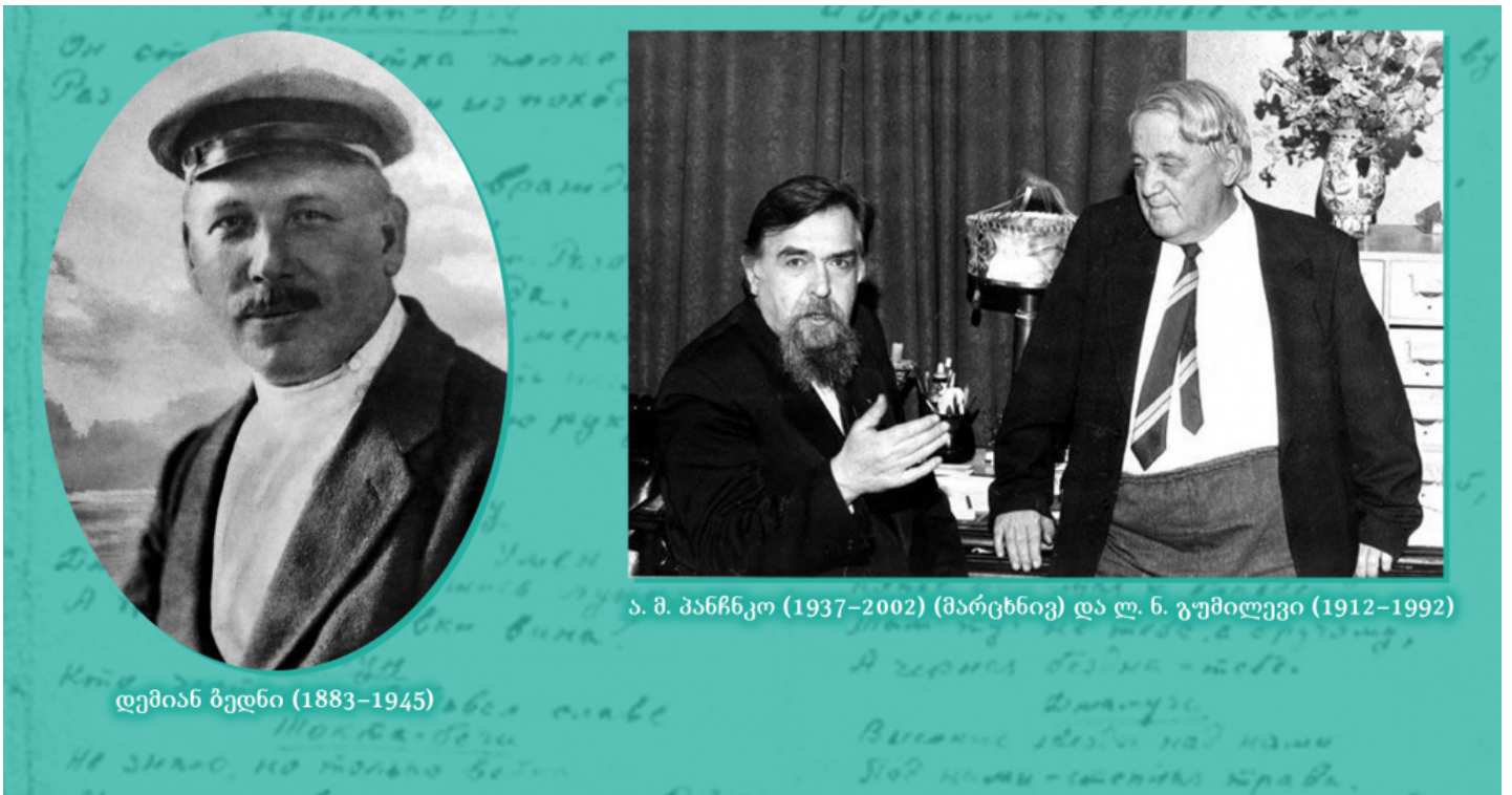
ა. მ. პანჩკო (1937–2002) (მარცხნივ) და ლ. ნ. გუმილევი (1912–1992)

„მაგრამ უნდა გვახსოვდეს, რომ რუსმა ხალხმა დიდი ფასი გადაიხადა კლესიის ამ დადებითი მხარისათვის: რელიგიური იდეოლოგიის შხამი აღწევდა (უფრო ღრმად, ვიდრე წარმართულ დროში) სახალხო ცხოვრების ყველა ფორმებში, ის აბლაგვებდა კლასობივ ბრძოლას, აღადგენდა ახალ ფორმაში პირველყოფილ შეხდულებას და მრავალი საუკუნით ნერგავდა ადამიანების ცნობიერებაში იმეცეციური ცხოვრების იდეას, ხელისუფლების საღვთო წარმომავლობას და პროვიდენციალიზმს. [8]