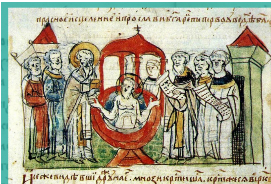
ვლადიმერ სვიატოსლავის ძის ნათლობა. მინიატურა რამივილოვის ჟამთააღწერიდან

„იგი ახალი კონსტანტინეა დიდი რომისა; როგორც ის მონათლა თავად და ხალხიც მონათლა, ესეც მსგავსადვე მოიქცა. თუკი მანამდე ბილნი და ავხორცული სურვილებით ცხოვრობდა, სამაგიეროდ შემდგომში გულმოდგინებდა სინანულში, – მოციქულის სიტყვისაებრ: სადა-იგი განმრავლდა ცოდვაჲ, მუნ უფროსად გარდაემატა მადლი [რომ. 5:20]. გაკვირვებას იმსახურებს – რამდენი სიკეთე გაუკეთა რუსეთის მინას, ნათელი მიაღებინა მას... მისთვის ლოცვა გვმართებს, რამეთუ მისი მეშვეობით შევიცანით ჩვენ ღმერთი“. [1]