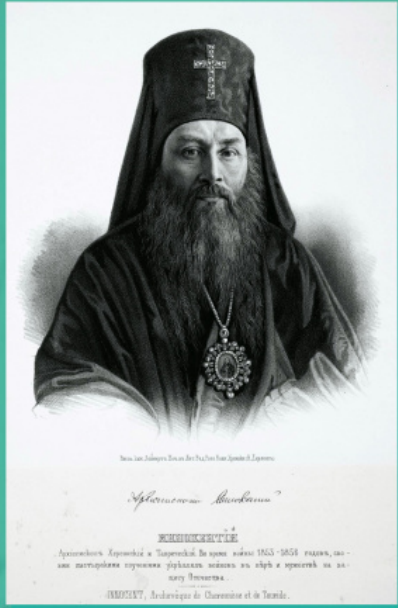
ინოკენტი (ბორისოვი), ხერსონისა და თავრიდის მთავარეპისკოპოსი (1800–1857)