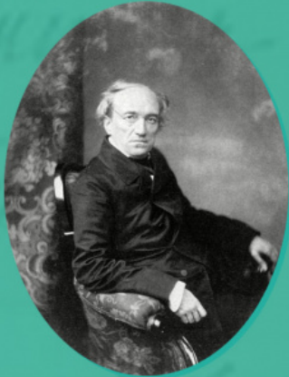
გ. ი. ტიუტჩევი (1803–1873). ლვიტკის ფოტოგრაფია, 1856 წ.