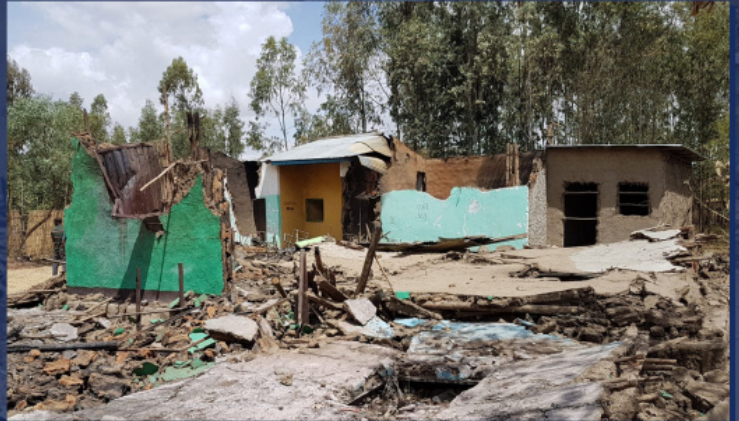
ტაძრის ნანგრევები ეთიოპიაში თავდასხმის შემდეგ

რუსეთის მართლმადიდებელი ეკლესია აქტიურად დგას აფრიკელ ქრისტიანთა დასაცავად. უკანასკნელ წლებში პირდაპირი კონტაქტები დამყარდა კონტინენტის ძირითად ქრისტიანულ ეკლესიებთან, მათ შორის უმსხვილესებთან – ეთიოპიისა და კოპტურ ეკლესიებთან. მათთან მუშაობას რუსეთის მართლმადიდებელი ეკლესია ახორციელებს ორმხრივი სადიალოგო კომისიის მუშაობის ფარგლებში. ეთიოპიისა და კოპტური ეკლესიების წარმომადგენლები არაერთხელ სწვევიან რუსეთს.