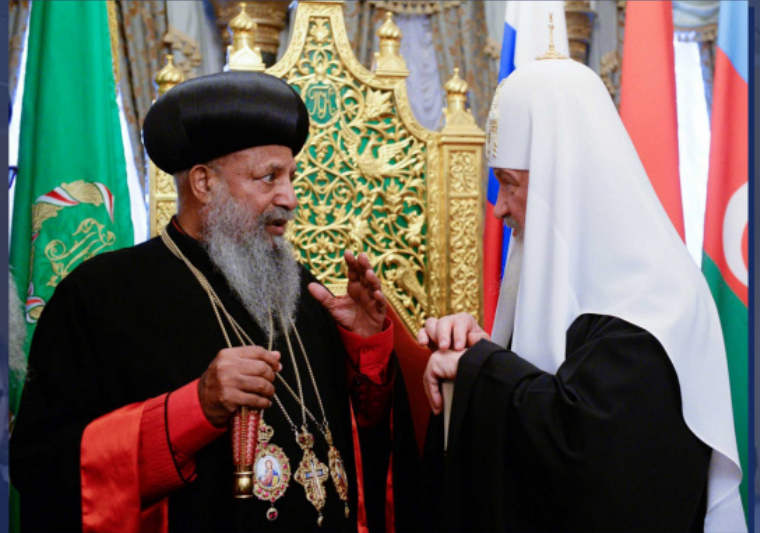
ეთიოპიის პატრიარქი აბუნა მათე და უწმინდესი პატრიარქი კირილე

2019 წ. დეკემბერში უწმინდესმა პატრიარქმა კირილემ ეთიოპიის პატრიარქ აბუნა მათესა და ეფდრ-ის პრემიერ-მინისტრ ა. ალის წერილი გაუგზავნა, სადაც შეშფოთებას გამოხატავდა ქვეყანაში საგანგაშო ვითარების გამო და მხარდაჭერას აღუთქვამდა. მისი უწმინდესობის წერილში აღნიშნული იყო, რომ ეთიოპიის მოვლენები იმავე რიგში დგას, რომელშიც მსოფლიოს სხვა რეგიონებია ქრისტიანების დევნის მხრივ, სადაც ადგილი აქვს რელიგიური ფაქტორის პოლიტიკური მიზნებისათვის გამოყენების მცდელობებს, პარალელურად კი ტრადიციული ქრისტიანების დასუსტებასა და დაშინებას.