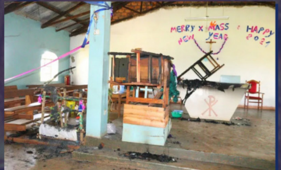
ეკლესია კენიაში ხანძრის შემდეგ

უკანასკნელ დროს ტერორისტული ჯგუფები გააქტიურდნენ კონგოს დემოკრატიულ რესპუბლიკაში (კდრ), ცენტრალურ აფრიკულ რესპუბლიკაში, კამერუნში და მოზამბიკში. კდრ-ს ქრისტიანი მოსახლეობისათვის ძირითად საფრთხეს წარმოადგენს ექსტრემისტული დაჯგუფება „გაერთიანებული დემოკრატიული ძალები“ (გდძ). მხოლოდ 2020 წელს გდძ-ს კისერზეა 849 ადამიანის სიკვდილი სამოქალაქო მოსახლეობას შორის – ძირითად, ქრისტიანების. 2021 წლის იანვრში გდძ-ს ბოევიკებმა მშვიდობიანი მოსახლეობის მთელი რიგი მასობრივი მკვლელობა ჩაიდინეს, – უმთავრესად ქრისტიანულ