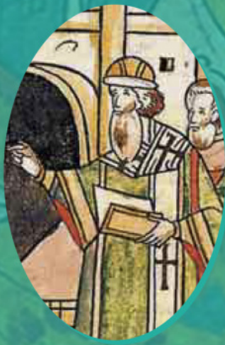
მიტროპოლტი ზოსიმე. მინიატურის ფრაგმენტი. სახის ანალისტიური კრებული, წიგნი 17, გვ. 140.

სპირიდონ-საბას „ეპისტოლე მონომახის საჩუქრების შესახებ“ (დაახ. 1503წ.), XI საუკუნეში იმპერატორი კონსტანტინე მონომახი თავის შვილიშვილს, რუს მთავარ ვლადიმერ მონომახს ანდერძად ეუბნება: „დაე, ღვთის ეკლესიამ უშფოთველად იცხოვროს და მთელმა მართლმადიდებლობამ დაიმკვიდროს მშვიდობა ჩვენი სამეფოსა და შენი თავისუფალი თვთმპყრობელი დიდი რუსეთის ხელმწიფობის ქვეშ. დაე ამიერიდან იწოდებოდეს ღვთივკურთხეულ მეფედ, დაგვირგვინებული ამ სამეფო გვირგვინით უწმინდესი მიტროპოლიტის ნეოფიტეს ხელითა და ეპისკოპოსების თანხმობით“.