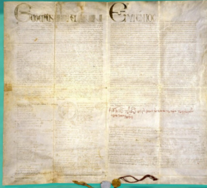
ფლორენციის უნია, 1439 წ.