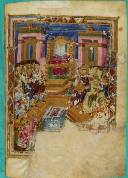
II მსოფლიო კრება (მე-IX ს.-ს მინიატურა გრიგოლ დვთისმეტყველის თხზულებებისთვის)