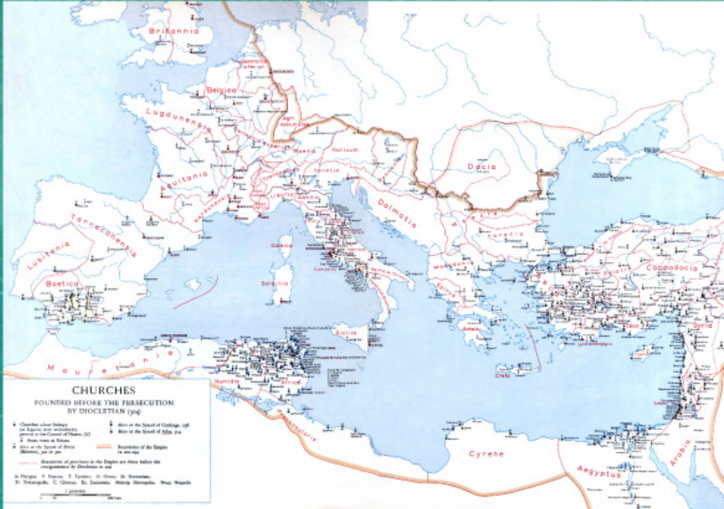
საეკლესიო კათედრები მე- IV ს.-ს დასაწყისში