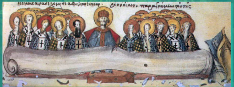
IV მსოფლიო კრება. ბიზანტური მინიატურა