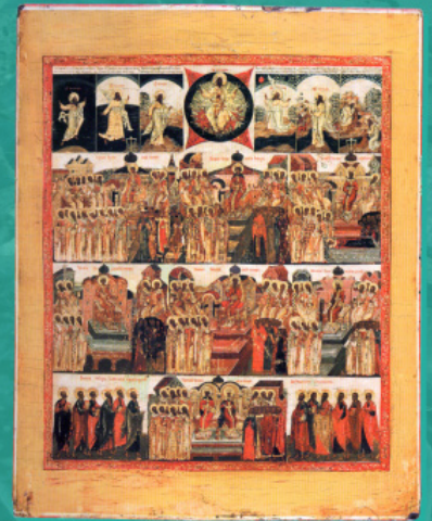
კონსტანტინე I დიდი (234-337 წწ.)