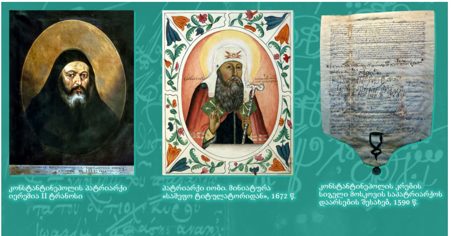
კონსტანტინეპოლის პატრიარქი იერემია II ტრანოსი

პაპის ნაცვლად უხუცეს მამად ყოფნა მართებს უწმინდეს დიდ უფალ იერემიას, ახალი რომის – კონსტანტინეპოლის მთავარეპისკოპოსსა და მსოფლიო პატრიარქს, მის შემდეგ კი იყოს ოთხი პატრიარქი: ალექსანდრიის, ანტიოქიის, იერუსალიმისა და რუსეთის სამეფოს სამეფო ქალაქ მოსკოვის.