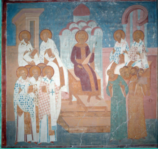
ტრულის კრება, მატთანური კრებულის წინა ყდის მინიატურა

წინაოთხმოციკორა . იქვეაქრძალ . პრა ალა . ი . მოვიწყობაქარნიცორკ მოვანიპოსონჩენისრქანიწიცი მე კონა მოაპოსონინესაქარქანაგო ყრსაანაგოთსაქარანი . ივპოსა სთონქოკორ . მადგრაქანიქრნიცი ყრსანიქრანიქრნიანიქრანიქრანი .