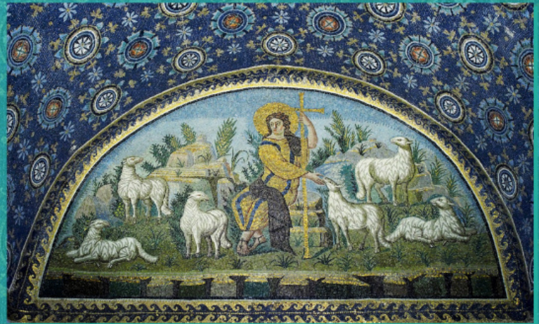
ქრისტე – მწყემსი კეთილი. გალა პლაციდიას მავზოლეუმის მოზაიკა (რავენა, მე- VI ს.)