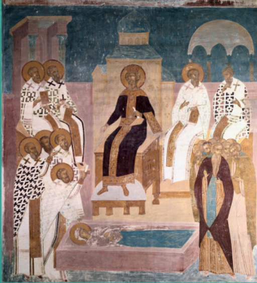
დიონისე. IV მსოფლიო კრება. ღვთისმშობლის შობის კრება. ფერაპონტეს მონასტერი, რუსეთი, 1502 წ.

ალექსანდრიის საყდარი კი პეტრე მოციქულის მონაფის, წმინდა მარკოზის დაარსებული იყო. ამ ფონზე რითი შეეძლო ბიზანტიას ეამაყა, რომელსაც სულ ახლახან უმნიშვნელო ქალაქად იცნობდნენ? მხოლოდ რამდენიმე საუკუნის შემდეგ გამოჩნდა გადმოცემა, რომ აქ იქადაგა ანდრია მოციქულმა, რაც კონსტანტინეპოლს სამოციქულო კათედრის სტატუსს ანიჭებდა, თანაც პირველწოდებული მოციქულის, წინდა პეტრეს უფროსი ძმის მიერ დაარსებულს.